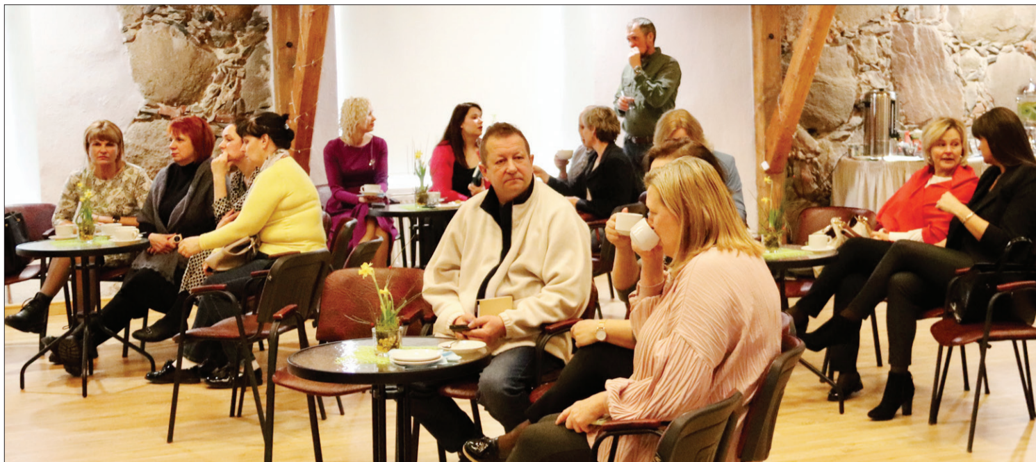
Novada uzņēmējiem bija iespēja noklausīties ziņošanas lektorus un aprunāties citam ar citu.