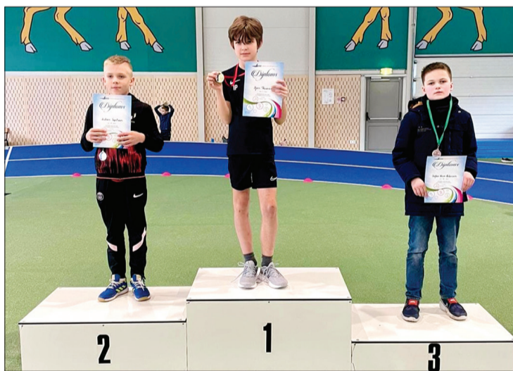
Ugāles sporta centrā tika aizvadītas Ventspils novada atklātās sacensības vieglatlētikā U12 grupai, te trīs godalgo vietu ieguvēji.

● Niklāvs Fogels – 5. vieta augstlēkšanā, treneris A. Paipals,