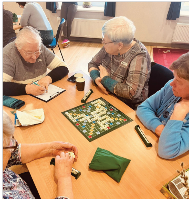
Usmā satikās vārdu minēšanas spēles "Scrabble" entuziasti.

noturētu spilgtu saules gaismu plaukstā. Un pietauptu to. Kādam klusākam brīdim, kad noderēs.