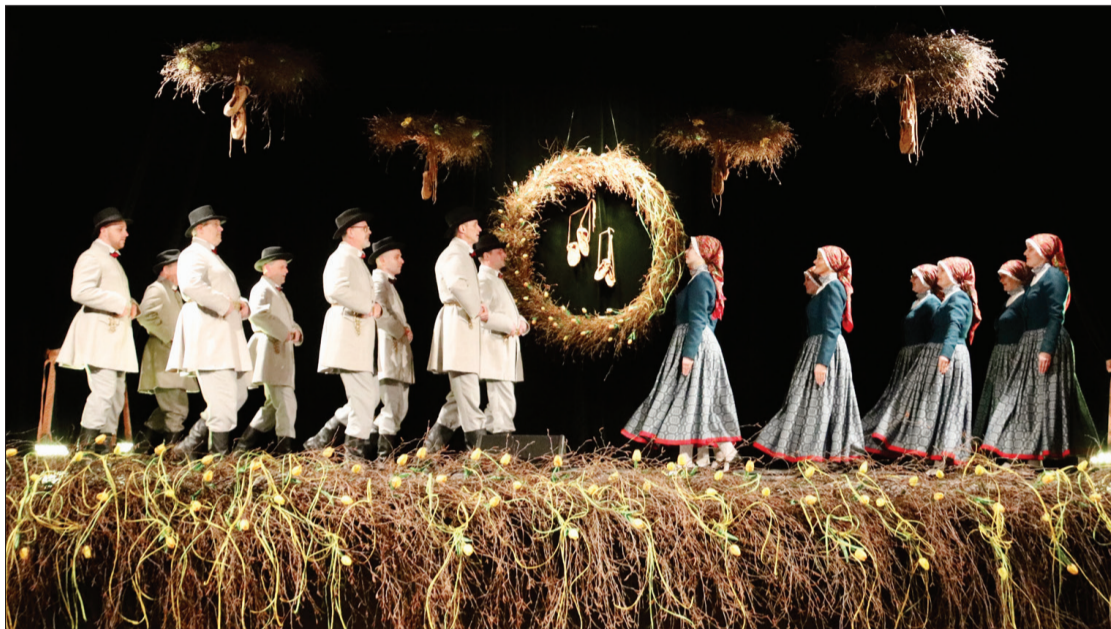
VPDK "Usma" cēli izdejo deju "Dižais dancis".

Ugāles tautas namā "Gaisma" 9. marta vakarā valdīja enerģiska gaisotne. Tur savu devīto dzimšanas dienu atzīmēja vidējās paaudzes deju kolektīvs "Usma" kopā ar draugiem, priecējot pilnu zāli skatītāju.