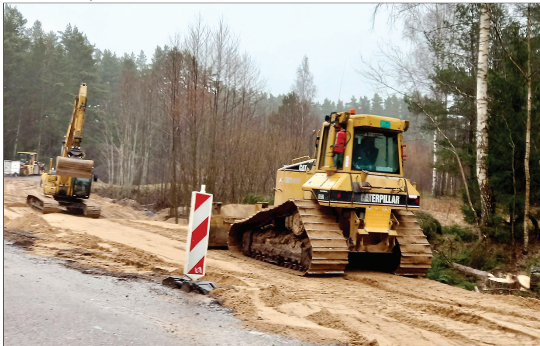
Darbus objektā paredzēts pabeigt līdz šā gada beigām.