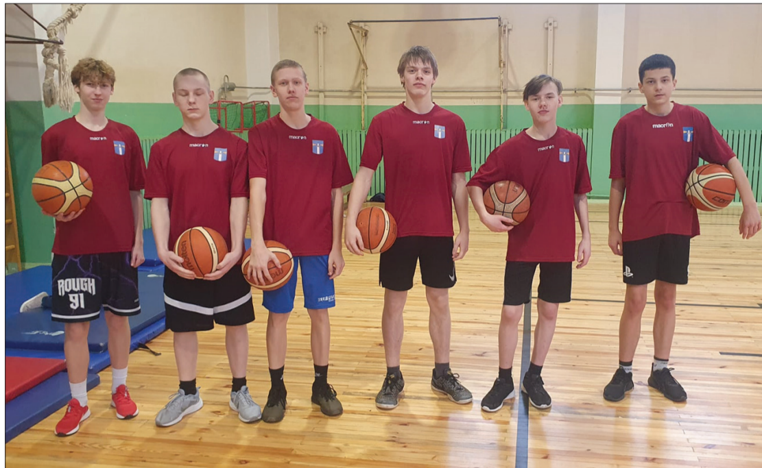
Puīši iesaistījās sportiskās aktivitātēs.

pot putnu būrišus, kurus izvietot skolas teritorijā augošajos kokos. Lielāko klašu skolēni pēc informatīvi izglītojošas nodarbības devās iestādīt egli pie skolas.