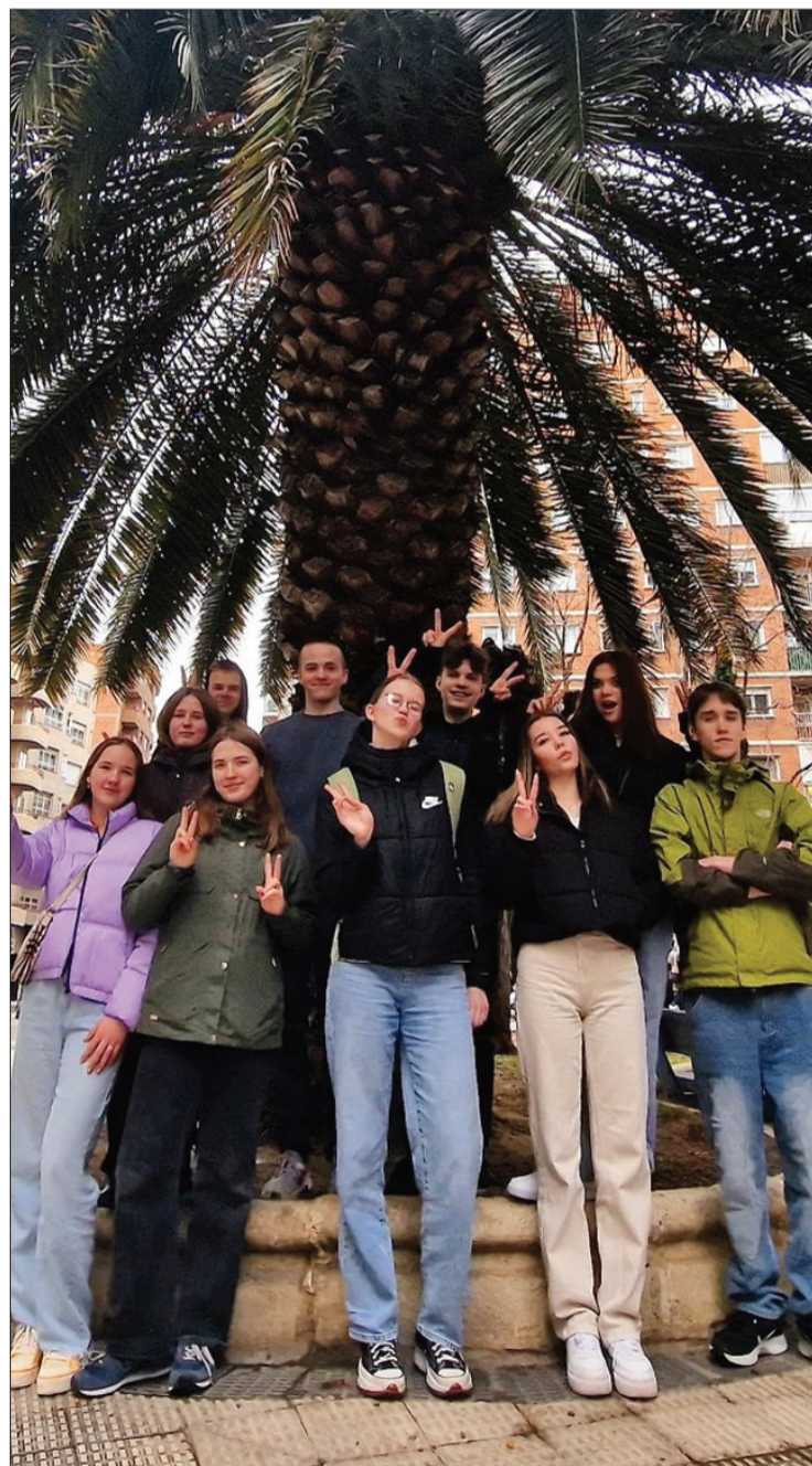
Piltēnieki izbauda spāņu viesmīlību.