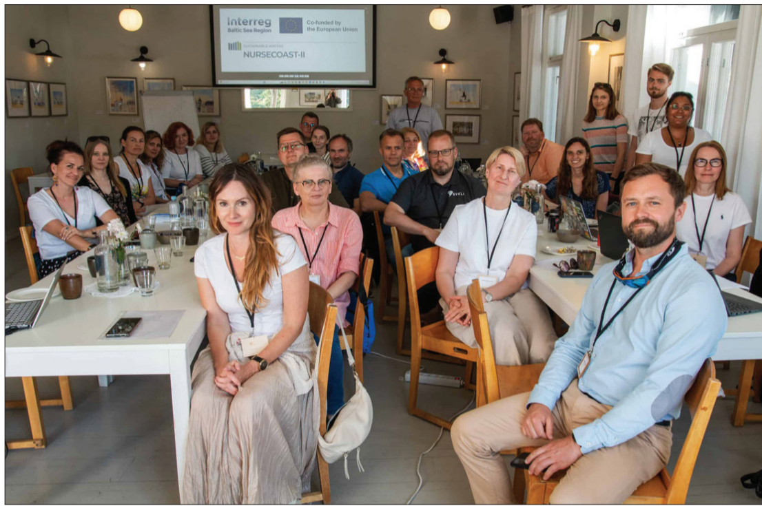
Projekta partneri "NURSECOAST-II" atklāšanas sanāksmē Somijā pērnā gada maijā.

"NURSECOAST-II" projekts ir zīmīgs arī ar to, ka ir vērsti tieši uz mazo notekūdeņu attīrīšanas sistēmu problēmām, un, tā kā visas Ventspils novada attīrīšanas sistēmas tiek ietvertas mazo sistēmu kategorijā, projekts netieši sniegs pienesumu visām Ventspils novada attīrīšanas stacijām, jo tā gaitā tiks pētīti un testēti pielāgoti tehnoloģiskie risinājumi mazas apdzīvotības notekūdeņu attīrīšanas sistēmu spe-