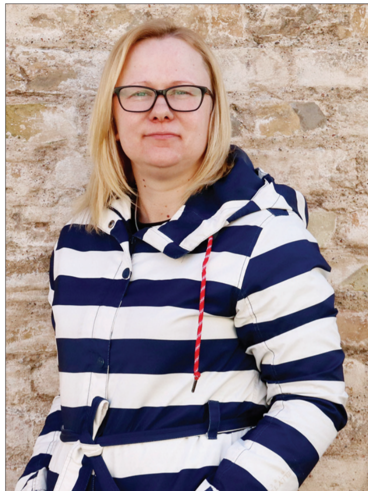
Dace ir apņēmības pilna vēl labāk iemācīt bērniem lasīt skaļi, jo šī prasme attīsta arī valodu.

"Man ļoti patīk strādāt arī Usmā. Tur es lielākoties tiekos ar pieaugušajiem lasītājiem, kuri tik ļoti nav jāizklaidē. Sākumā bažījās, kā usmenieki mani uzņems, bet esmu iejutusies, un kāds ienāk tikai, lai sasveicinātos. Usmā esmu otrdienās un piektdienās. Pēcpusdienās iegriežas bērni, kas ir atbraukuši no Ugāles vidusskolas, un mēs vismaz apsveicināties. Kad uzsāku darbu Usmā, saaicāju vietējos iedzīvotājus – ne tikai, lai iepazītos, bet arī uzzinātu, ko viņi vēlas darīt. Tā atklājās, ka pieaugušie usmenieki grib spēlēt galda spēles. Sa-