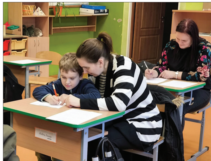
Topošie pirmklasnieki un vecāki kopā ar bērniem darbojas pirmajā iepazīšanās nodarbībā ar nākamo audzinātāju.