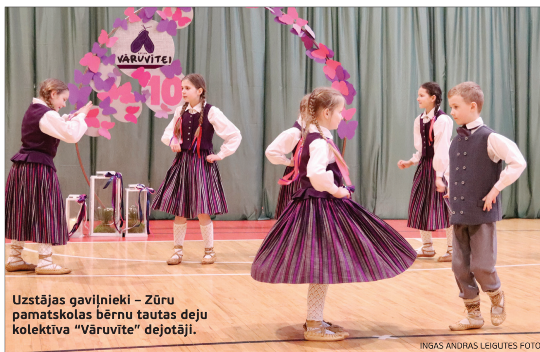
Uzstājas gaviļnieki – Zūru pamatskolas bērnu tautas deju kolektīva "Vāruvīte" dejotāji.