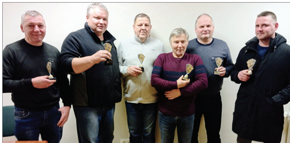
Veiksmīgie Užavas zolmaņi.