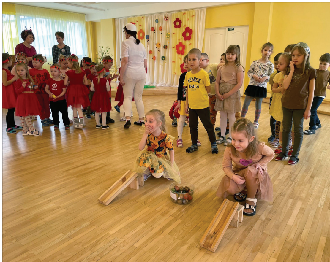
"Lācīša" audzēkņi izbauda svētku burvību.