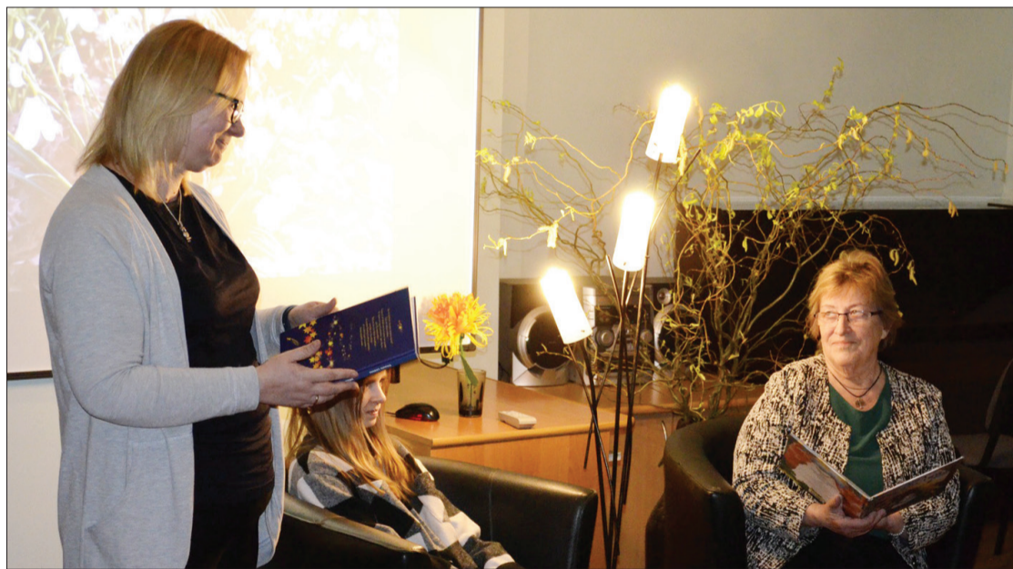
Veriņa lasīja pasaku "Zelta zoss".

Lai ieskandinātu Starptautiskās sievietes dienas tuvošanos, tika organizēts jau otrais pasaku kopā lasīšanas pasākums un kā pasaku lasītājas tika uzaicinātas četras stiprās sievietes – ugālnieces.