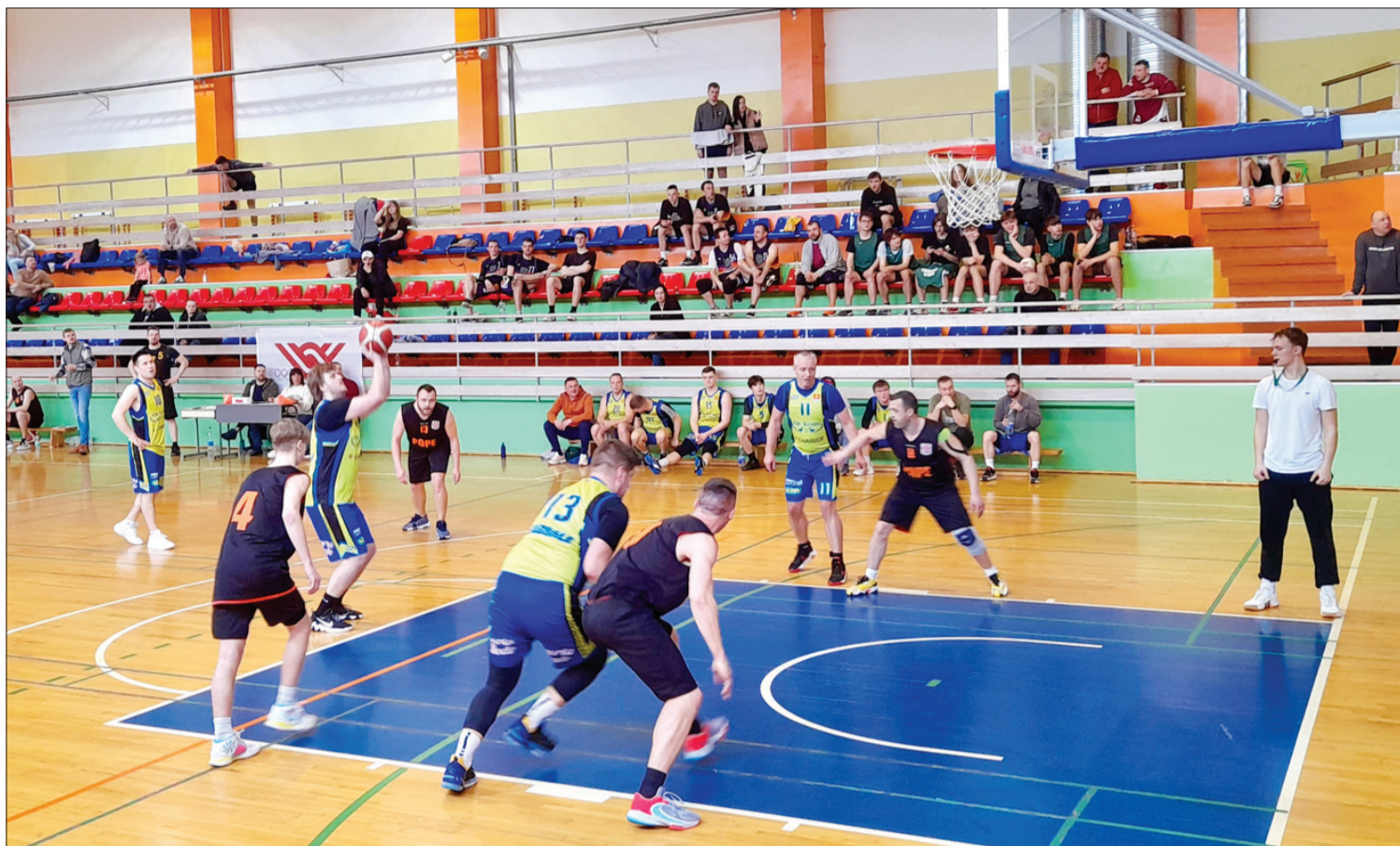
Spraigs spēles moments, ir vēlme uzvarēt.

Ventspils novada sporta darba organizators Arvis Anderšmits