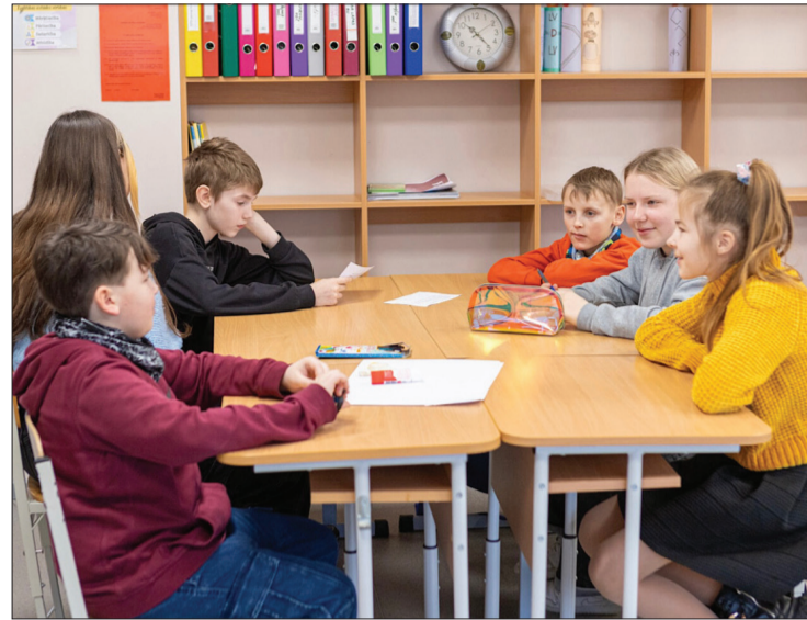
Skolēni aktīvi iesaistījās lasītprasmes veicināšanas aktivitātē.

Par visu vairāk skolēni bija apmierināti par jaukto grupu darbu,