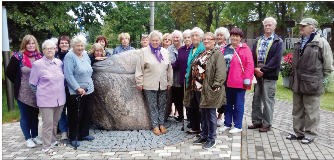
Ugāles seniori ekskursijā, iepazīstot Ziemeļkurzemi.