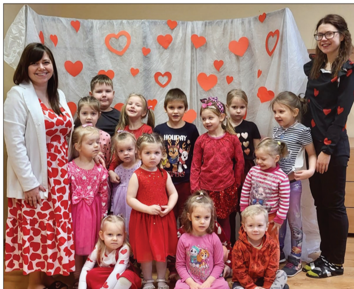
Draudzīgās ballītes dalībnieki.

mā pirmsskolēni devās uz Užavas saietu namu, kur notika spēļu rīts. Ar azartu bērni ņēma dalību visās piedāvātajās sportiskajās aktivitātēs, kā arī pagatavoja sirsniņrotu gan sev, gan saviem mīļajiem. Paldies Gundegai Krūmiņai par šo pasākumu. Noslēgumā bērni tika katrs pie sava balona un sirsniņām konfektēm.