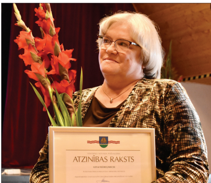
Gita saņēma apbalvojumu nominācijā "Par mūsdienīgu un kvalitatīvu izglītības darba organizēšanu un vadību".

Puzes skolas saimē Gita jūtas ļoti labi. Kolēģi ir draudzīgi un izpalīdzīgi, un arī Gita cenšas palīdzēt viņiem – visbiežāk IT jomā, jo atbalsta skolotājus digitalizācijas procesā un labprāt paskaidro, ja ir kāds jautājums par informācijas tehnoloģiju lietošanu. Skolas direktore