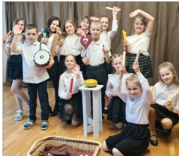
1.–3. klašu audzēkņi pēc koncerta Vārves pagasta senioriem.

15. februārī Zūru pamatskolā notika skolas skatuves runas konkurss, kurā savas prasmes demonstrēja 27 skolēni. Apsveicam godalgoto vietu ieguvējus. Prieks, ka droši jutās un bez aizķeršanās pirmo reizi šajā pasākumā runāja 1. klašu skolēni. 1. vietu ieguva Dārta Doniņa. 2.–4. vietu – Gustavs Lazdiņš, Tomass Mizovskis, Elza Gruntmane. 2.–3. klašu grupā 1. vietu ieguva Agate Misiņa, 2. vietu – Sandra Zālīte, 3. vietu – Keita Suščenko. Savukārt 4.–6. klašu grupā 1. vietu izcīnīja Amēlija Klestrova, 2. vietu