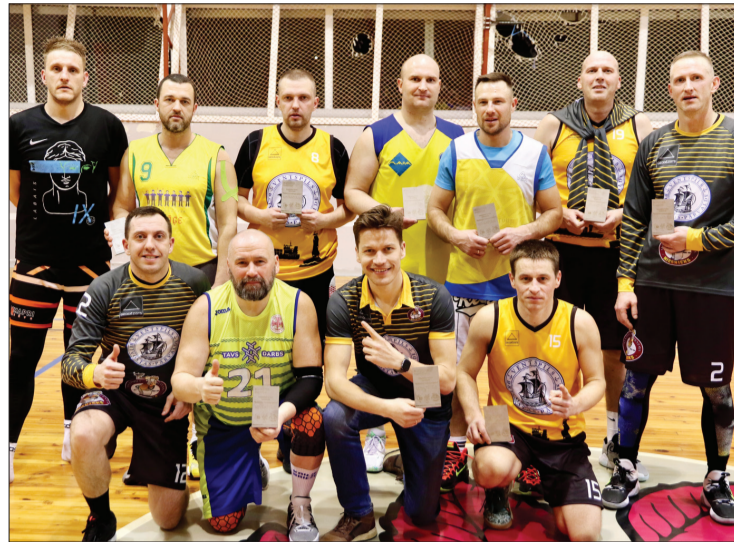
Kunģi no Ventspils brīvostas pārvaldes komandas.