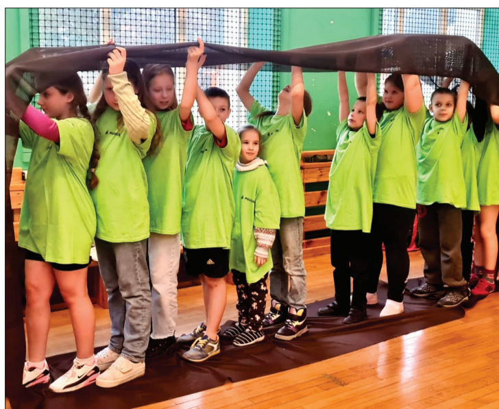
Užavnieki ar prieku izbaudīja sportiskās aktivitātes.

14. februārī skolā bija Draugu diena. Visas dienas garumā skolas gaitenēs varēja iesaistīties dažādās nopietnās un ne tik nopietnās