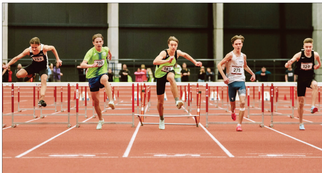
Uz starta Elans, kuram 4. vieta 400 m distancē.

22. un 23. februārī Rīgas jaunajā manžā tika aizvadīts Latvijas čempionāts telpās U16 grupai. Sacensības notika 24 disciplīnās, un par čempionāta augsto līmeni liecina fakts, ka 13 disciplīnās par čempionu bija iespējams kļūt, sasniedzot sezonā labāko rezultātu.