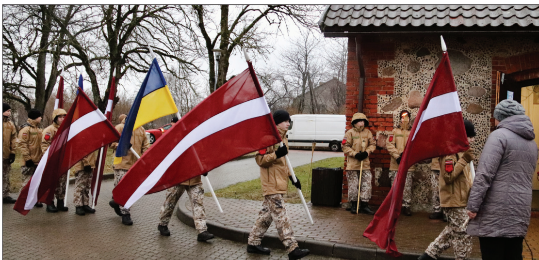
Popē labi pamanāmi bija jaunsargi – viņi stāvēja goda sardzē, saņēma ziedojumus, vārīja boršču.

24. februāri Popes kultūras nama iekšpagalmā notika labdarības pasākums, veltījums Ukrainai "Cerību mazliet". Lai gan lija, to apmeklēja cilvēki no vairākiem pagastiem, slēpējoties zem lietussargiem un ieklausoties skaistās dziesmās.