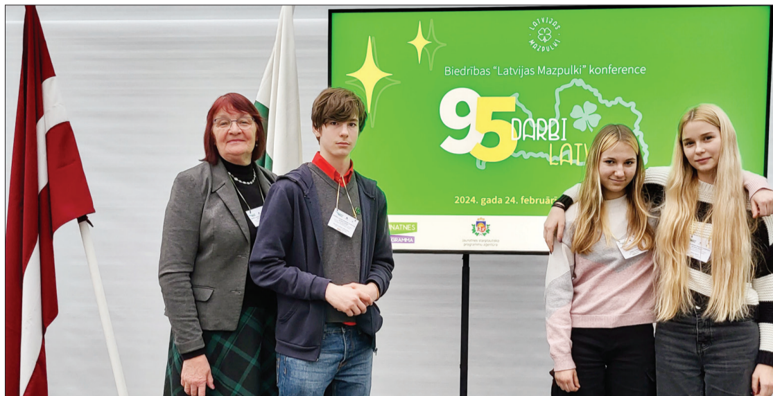
Mazpulku konferences dalībnieki no Puzes.

mazpulcēns var izvēlēties savu projektu, bet, kā jau katru gadu, Latvijas Mazpulku padome piedāvā prioritāros projektus. Šogad ir piedāvāti šādi projekti: