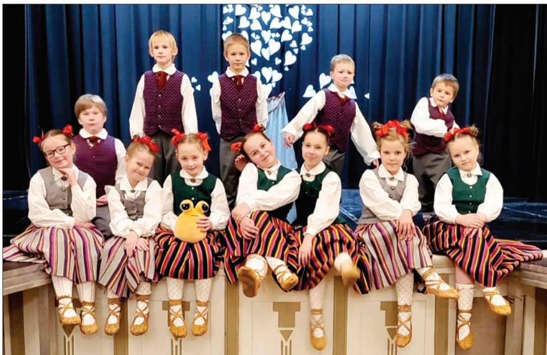
Tautisko deju kolektīva "Piltenes dadziši" dalībnieki.

Gatavošanās XIII Latvijas Skolu jaunatnes dziesmu un deju svētku deju lielkoncertam 2025. gadā Piltenes pamatskolā sākusies jau šajā rudenī.