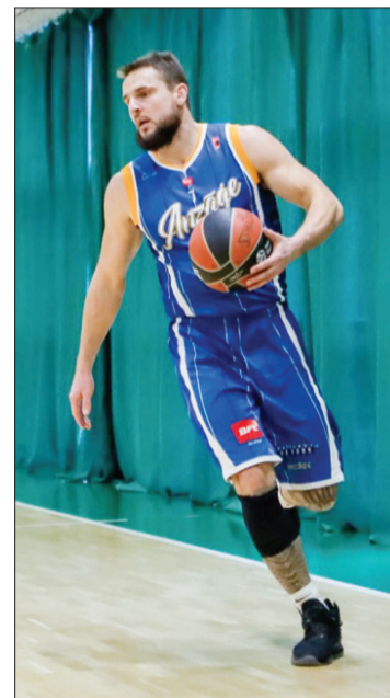
Mirklis no spēles, kurā "Anzāģe/Ventspils novads" ieguva trešo vietu.