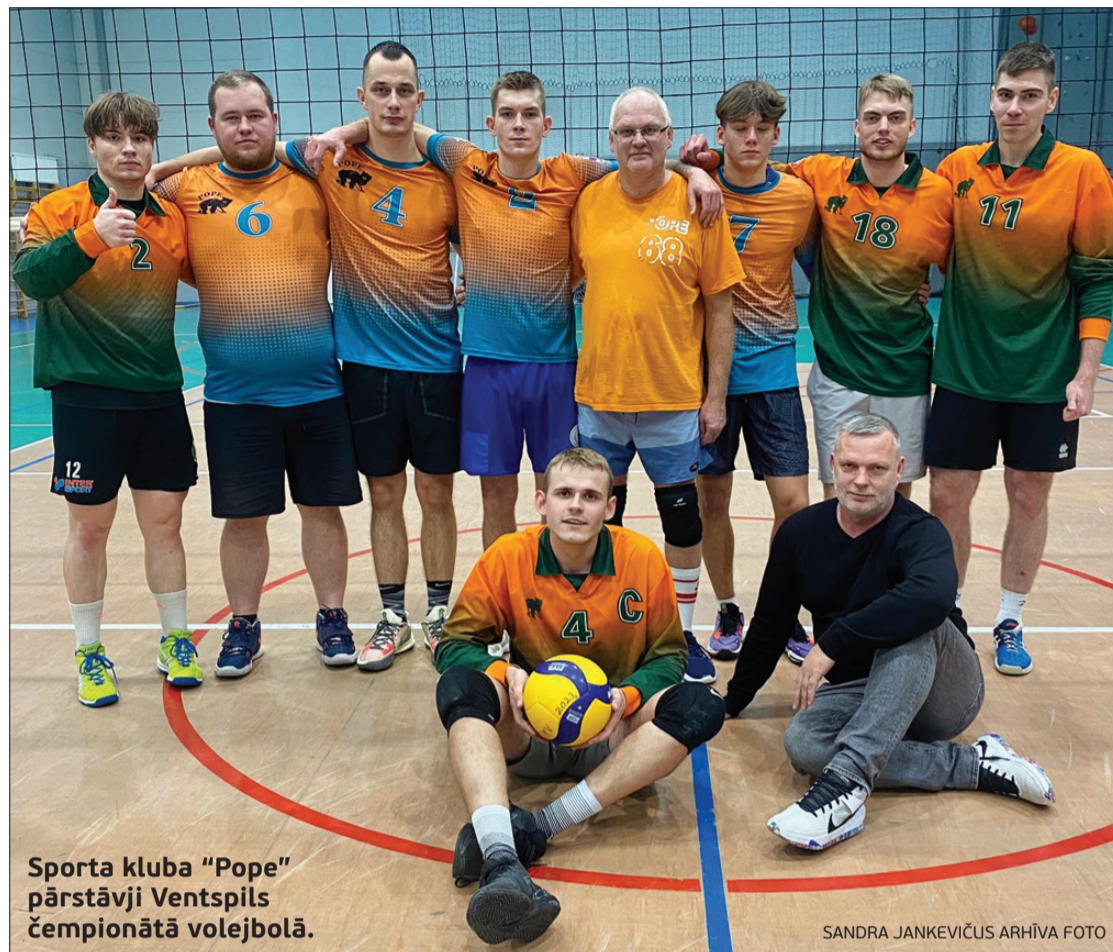
Sporta kluba "Pope" pārstāvji Ventspils čempionātā volejbolā.