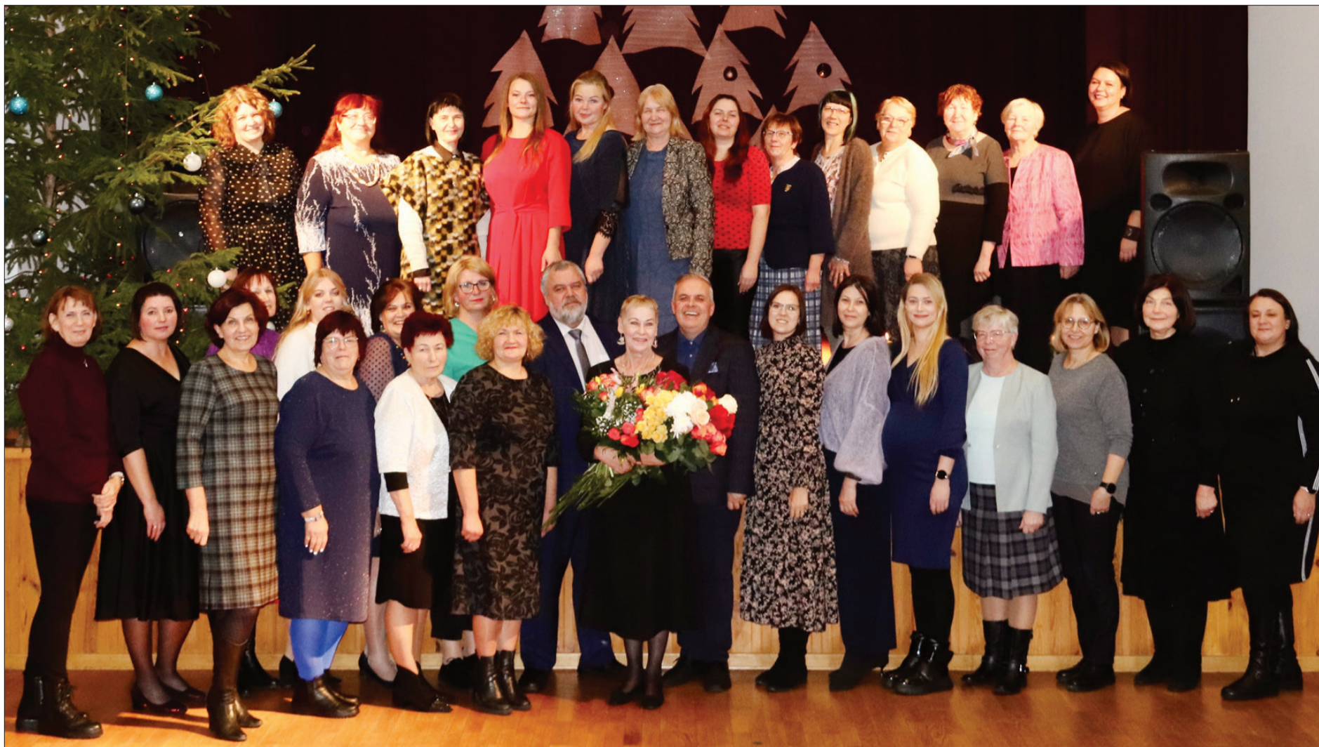
Ventspils novada smaidīgie kultūras darbinieki.