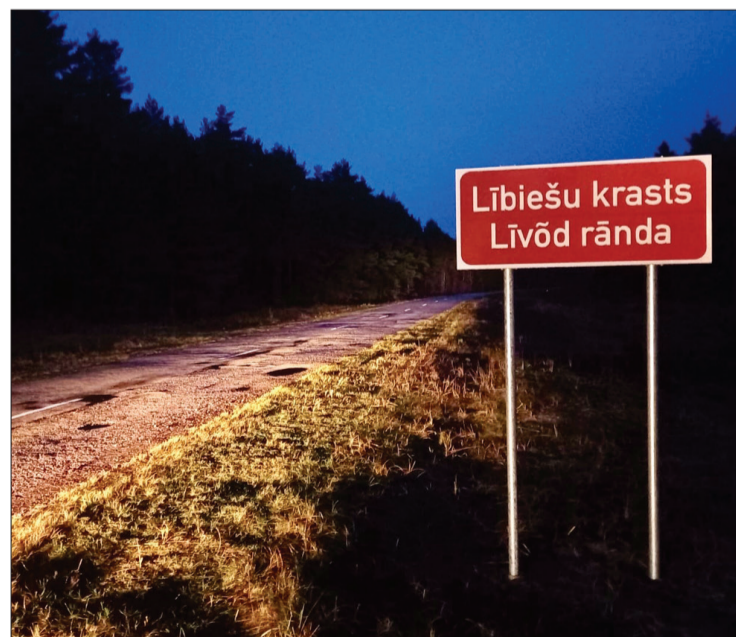
Šādi uzskatāmi redzams, ka Ventspils novadā sasniegts Lībiešu krasts.

Vietas, kur tiek uzstādītas šādas ceļazīmes, izvēlējās darba grupa, kurā darbojās Satiksmes ministrijas, Tieslietu ministrijas, Valsts valodas centra un VSIA "Latvijas Valsts ceļi" pārstāvji. Lībiešu krasta zīmes un ceļazīmes