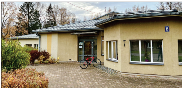
Ventavā, Skolas ielā 8, atvērts saietu nams "Mazā Vinda".

Saskaņā ar novada pašvaldības nolikumu Vārves pagastā ir izveidots saietu nams "Mazā Vinda" (iepriekš pazīstams kā sabiedriskais centrs). Tas atrodas Skolas ielā 8.