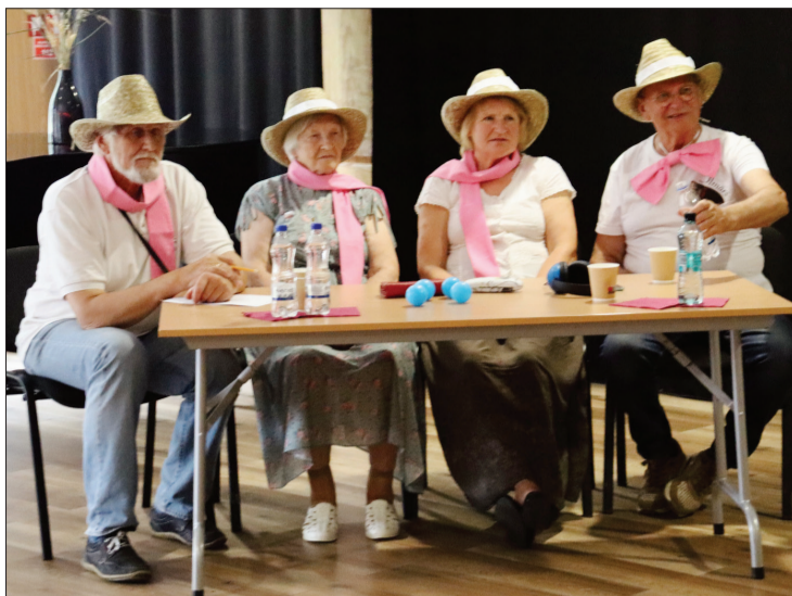
"Vakarblāzmas" pārstāvji vienā no daudzajiem pasākumiem.

Senioru klubīnā "Vakarblāzma" darbojas 20 dalībnieki. Gada nogalē