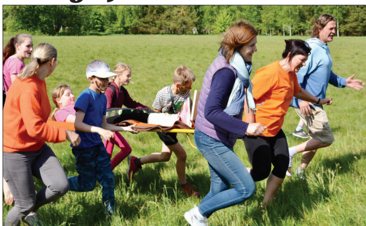
Kopā ar vecākiem ir interesanti piedalīties dažādās aktivitātēs.

27. maija rītā piedzīvojumu kārie Uģāles vidusskolas skolēni kopā ar ģimenēm piedalījās skolas padomes organizētajā pārgājienā no skolas līdz Uģāles augstākajam punktam – Virpes kalnam.