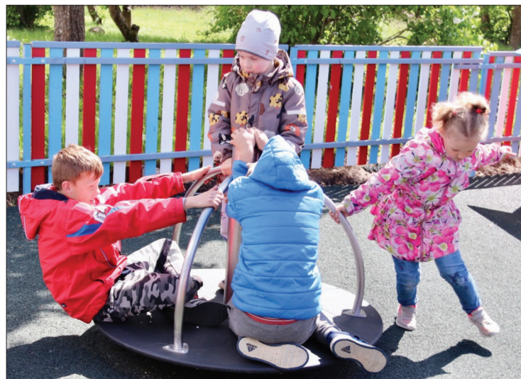
Rotaļu laukuma atklāšanas dienā bērni tūdaļ steidza izmēģināt dažādas iekārtas.