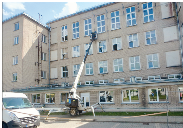
Ugāles vidusskolā šovasar notiek pārbūves darbi.