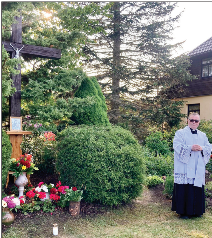
Maija dziedājums Alsungā pie Rotkaļu krusta.