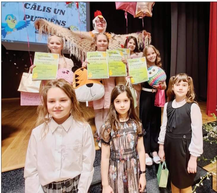
Jaunās dziedātājas pēc dalības vokālistu konkursā.