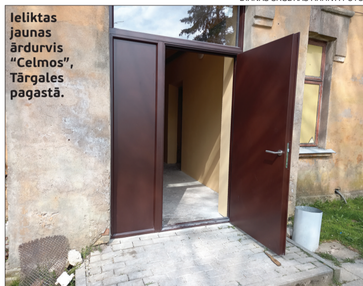
Ieliktas jaunas ārdurvis "Celmos", Tārgales pagastā.

Pagastos, kuros nav SIA "Vnk serviss" pieņemšanas vietas, rēķinus par komunālajiem pakalpojumiem skaidrā naudā apmaksāt būs iespējams saskaņā ar šādu grafiku: