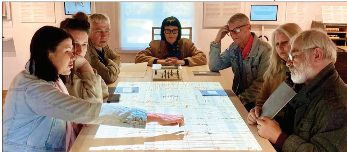
Erudīte lasītāju kluba biedri apskata jaunizveidoto ekspozīciju.

Pērnrudden lasītāju kluba (LK) tikšanās reizē, apspriežot Eduarda Veidenbauma daiļradi, iecerējam apskatīt "Kalāčus", dzejnieka dzimtas mājas, un viņam veltīto ekspozīciju. Apdomājom braucienu, nolēmām to darīt pavasarī, kad diena garāka, jo brauciens gana tāls.