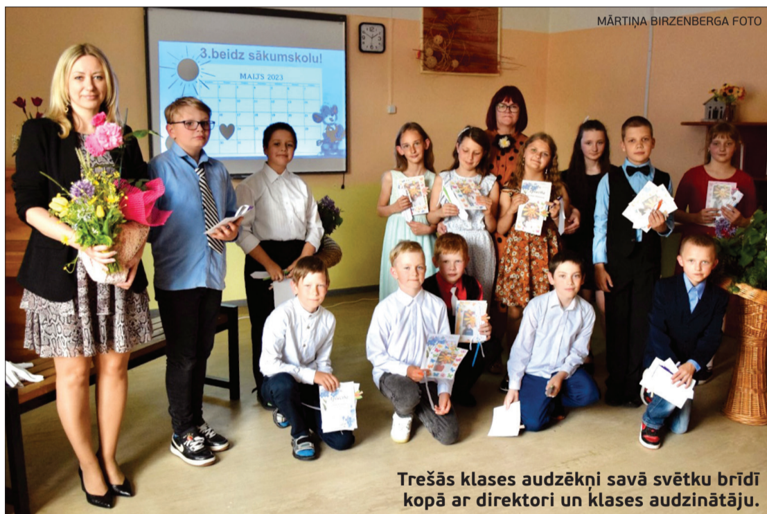
Trešās klases audzēkņi savā svētku brīdī kopā ar direktori un klases audzinātāju.