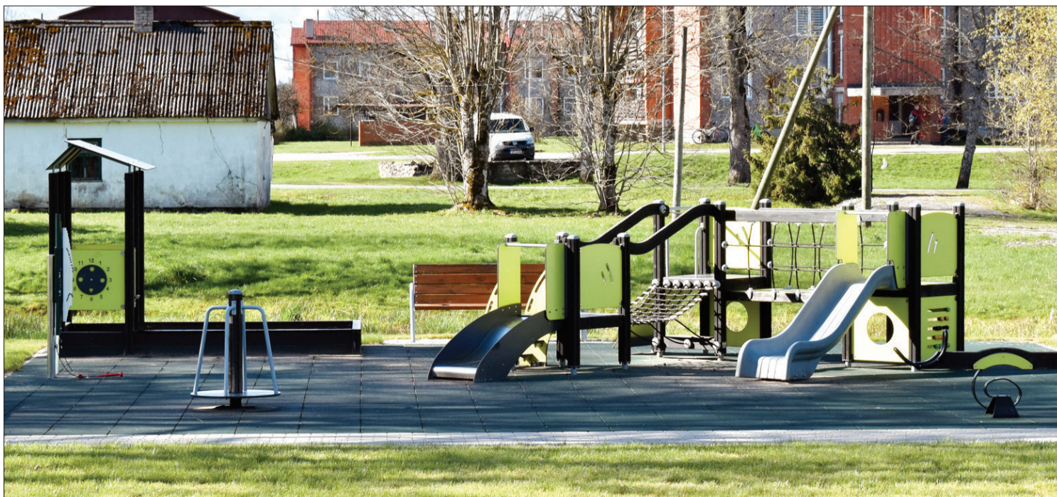
Vecās pagastmājas dārzā uzstādītas arī rotaļu iekārtas.