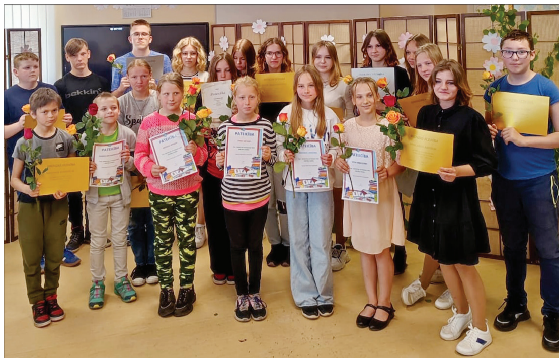
“Ābeļziedu brīža” dalībnieki, kad tika godināti skolēni, kuri mācās labāk un cenšas vairāk par citiem.

Skolā atbalstījām arī Starptautisko āra izglītības dienu. Mācību stundas notika ārpus skolas telpām. Katrs skolotājs bija izdomājis kaut ko interesantu. 9. klase ķīmijas stundā pētīja rapsi, bet 8. klase – ūdens paraugus no diķa un upes, mūzikā – skaņu raksti par ozolu, latviešu valodas stundā 1. klase mācījās veidot aprakstu par pavasara ziediem, 4. un 5. klase vizuā-