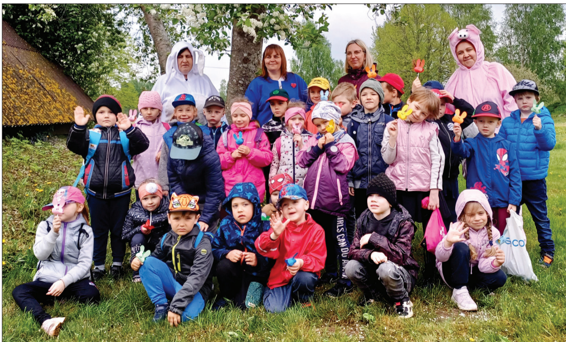
Pirmsskolēni piedalījās sportiskās aktivitātēs, tostarp stafetēs. Te – atelpas brīdī.