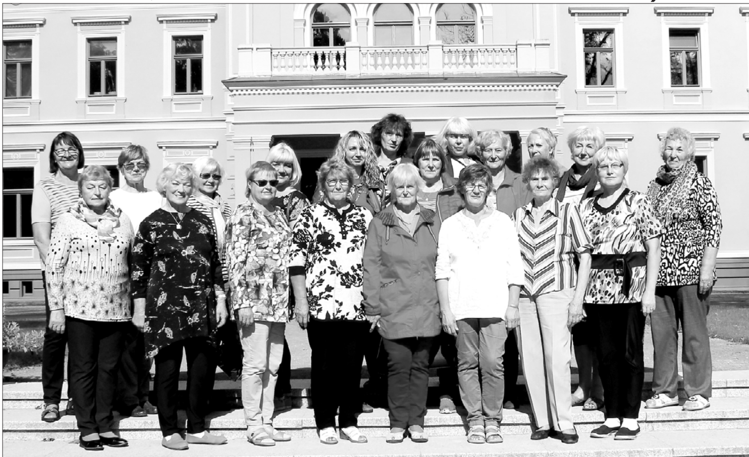
"Spārnu" dāmas Pluņģē pie Ogiņskā pils.