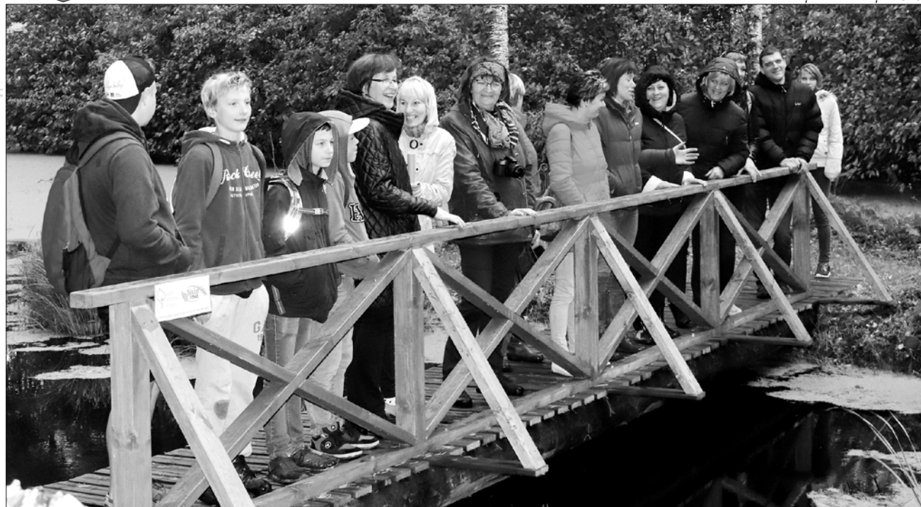
Īstenojot projektu "Pašvaldību labie darbi parkos Latvijas simtgadei", Mežaparkā uzbūvēts jauns tiltiņš.