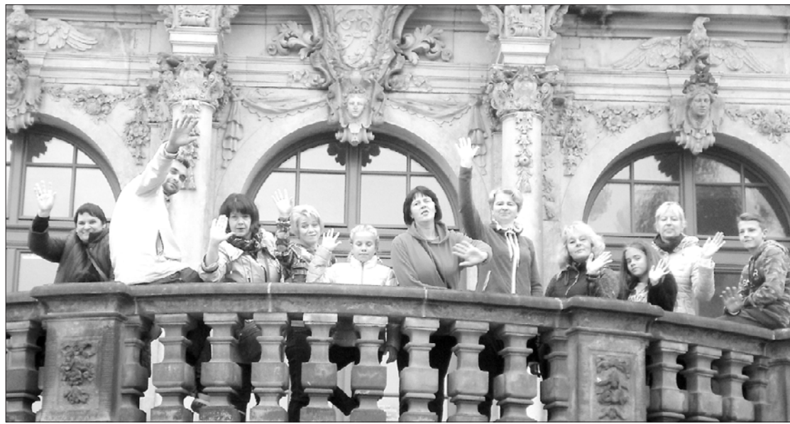
Sveiciens no amatiereteātra "Vārava" Drēzdenē.