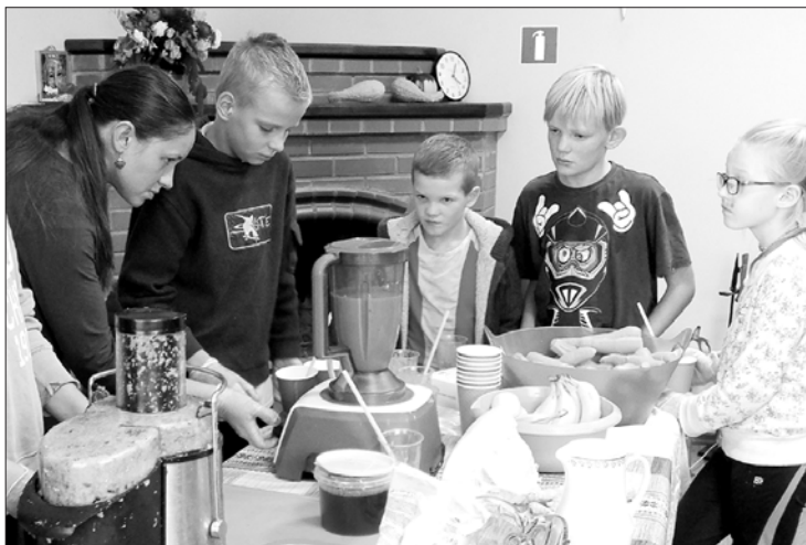
Bērni ar interesei vēro, kā top sula un kokteiļi.