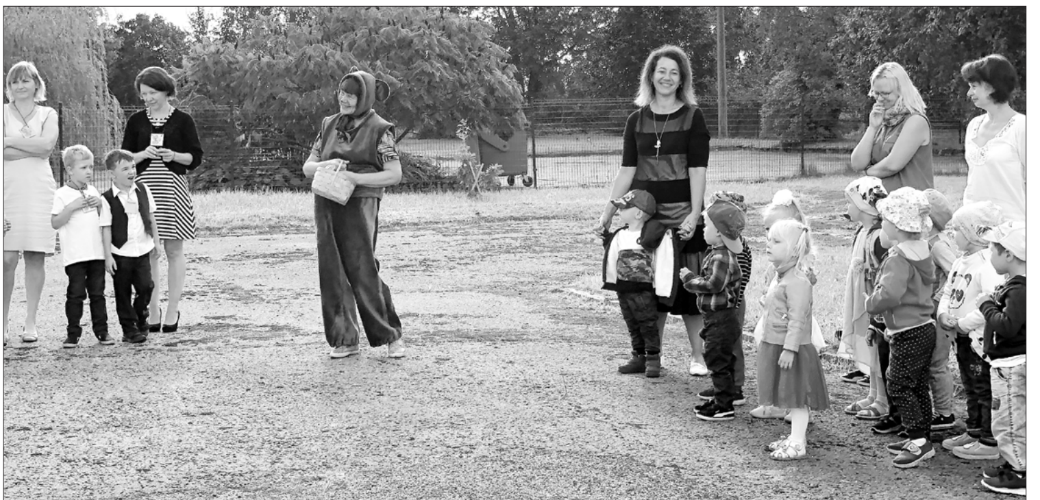
Lācēns sagaida bērnus.