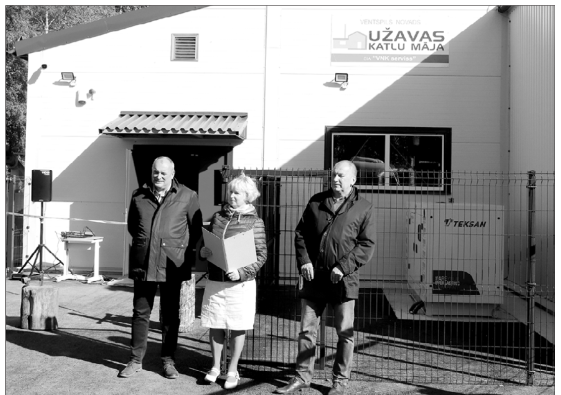
Jaunajā katlumājā uzstādīti divi apkures katli, to jauda ir 300 un 700 MWh.