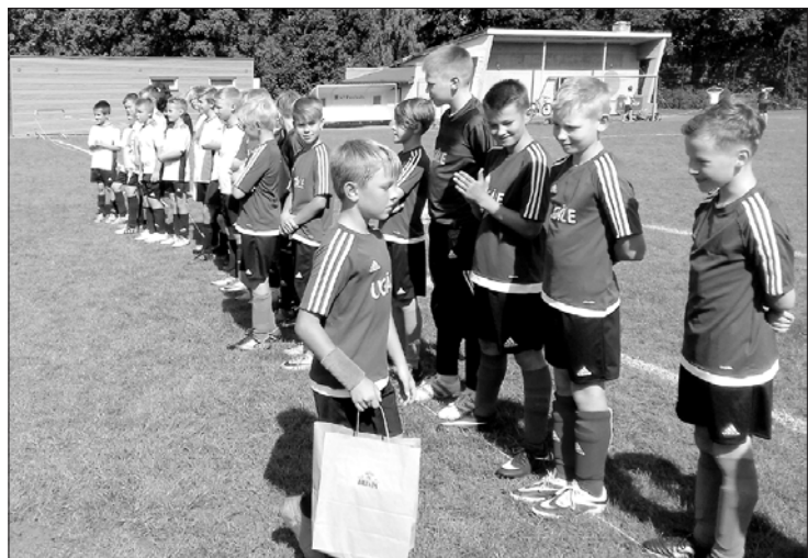
Uz starta – U11 grupas futbolisti.