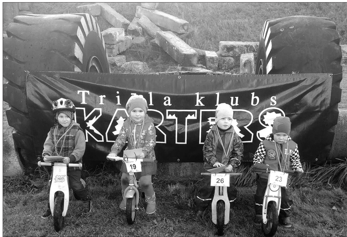
Sacensībās piedalījās arī pavisam mazi sportisti.