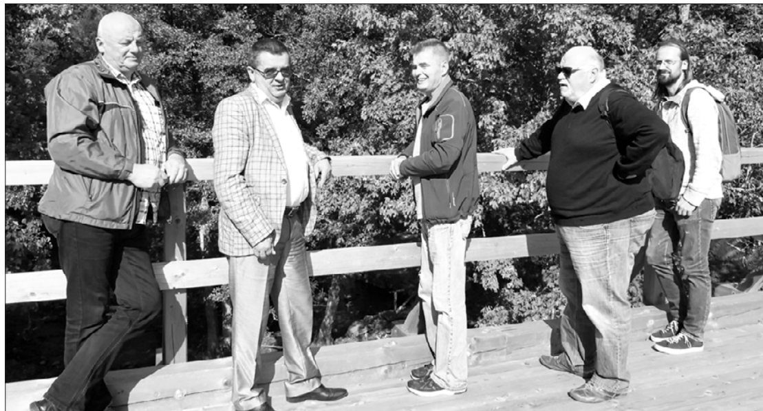
Projekta partneri satikušies Jūrkalnē.