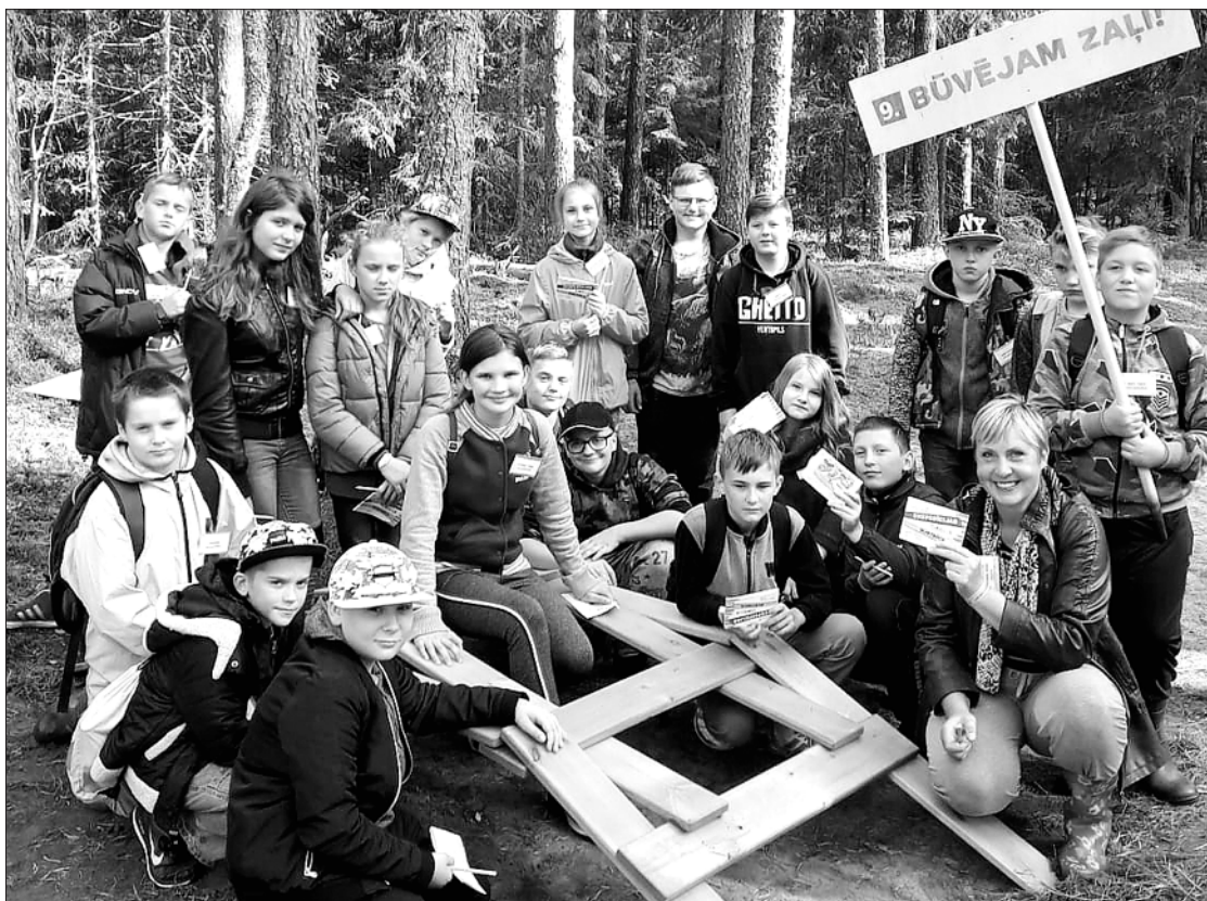
Ekspedīcijā 6. klases skolēni uzzināja, kā jākopj jaunaudze.