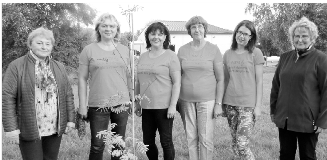
Ansambļa "Saiva" dziedātājas iestādījušas pilādzīti.