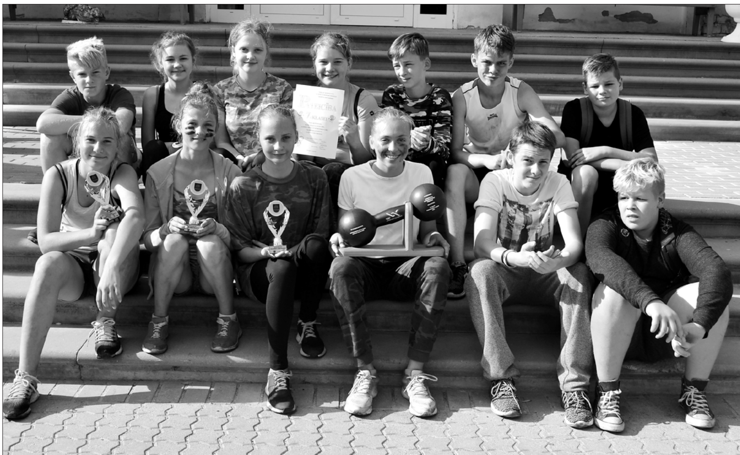
Vieni no uzvarētājiem – 7. klases pārstāvji.

Spriedze, sacensību un komandu vienotības gars valdīja starp klašu komandām. Bija prieks vērot, kā dalībnieki spēkojas savā starpā un cenšas būt labākie. Olimpiskās dienas rīkotāji, sporta skolotāji un vecāko klašu skolēni visu bija pārdomājuši līdz pēdējam sīkumam. Interesanti bija gan mazajiem, gan lielajiem dalībniekiem, neviens nepalika bez uzdevuma. Kāds spēlēja futbolu, cits stritbolu, pludmales volejbolu, frīsbiju, tautas bumbu vai pionierbolu, vēl citi tajā pašā laikā piedalījās stafetēs. "Katru spēli bija vērts izspēlēt, pat ja tajā zaudējam!" – tā savstarpējās spēles vērtēja 8. klases meitene. Sporta erudītu konkursā "Ko tu zini par tenisu, tenisistiem un vēl..." vajadzēja demonstrēt zināšanas par Latvijas tenisu, slavenākajiem tenisistiem un mūsu valsts vieglatlētājiem, kuri šovasar