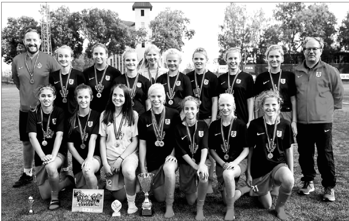
Labi veicās arī meitenēm futbolistēm.