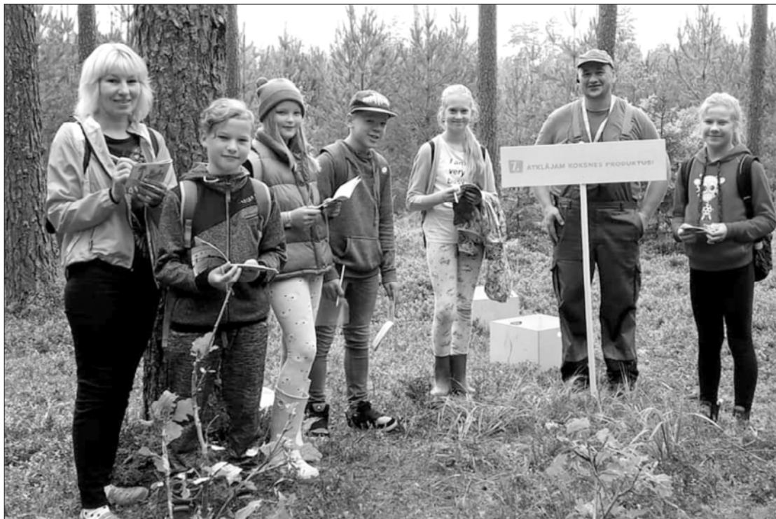
Ekoskolas pārstāvji iepazīst meža bagātības.

Savukārt 7. septembrī 5. un 8. klase piedalījās "Piekrastes Tirrades" talkā un vāca atkritumus