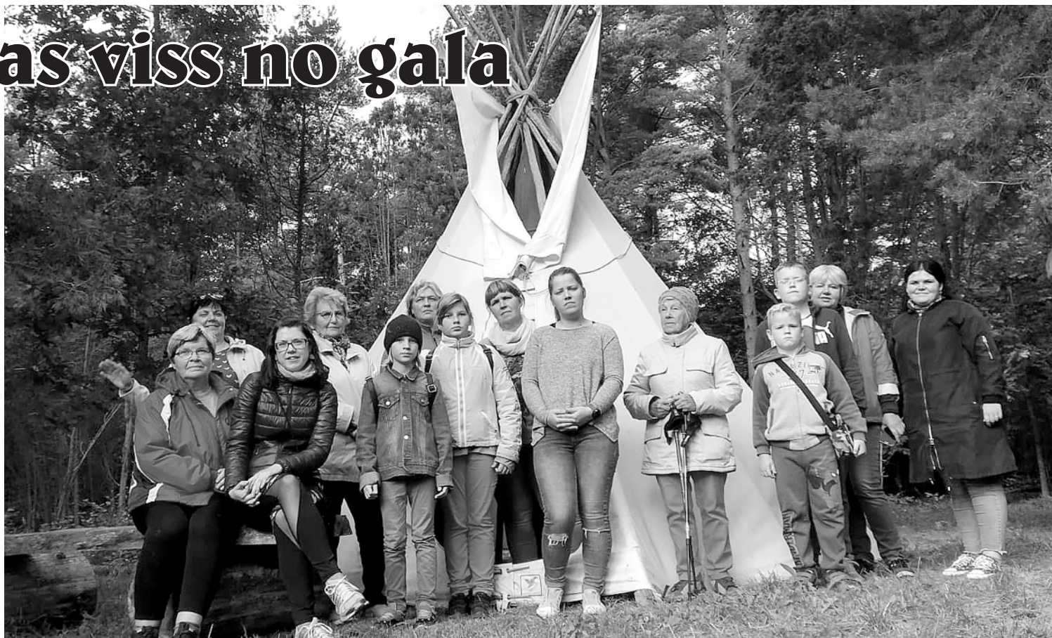
Pārgājiena dalībnieki nonākuši pie vigvama.

14. septembrī pasākumā "Un sākas viss no gala..." uz kopīgu vakarēšanu sanāca pulciņi dalībnieki, lai kopīgi pārspriestu šīs sezonas plānus. Šis pasākums bija īpašs ar to, ka piedalījāmies akcijā "Stādām nākotni", tādēļ ikviens