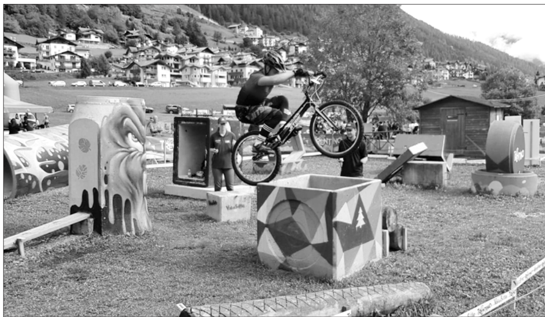
Ansim kvalifikācijā 37 soda punkti un 7. vieta.

Sacensību norises vieta – Val di Sole ieleja Trentino provincē Itālijā. Ziemas sezonā ieleja ir iecienīts kalnu slēpošanas kūrorts, bet vasarā viena no aktīvās atpūtas iespējām ir ritenbraucējiem. Pirms diviem gadiem Val di Sole notika gada lielākais UCI triāla notikums – pasaules čempionāts.