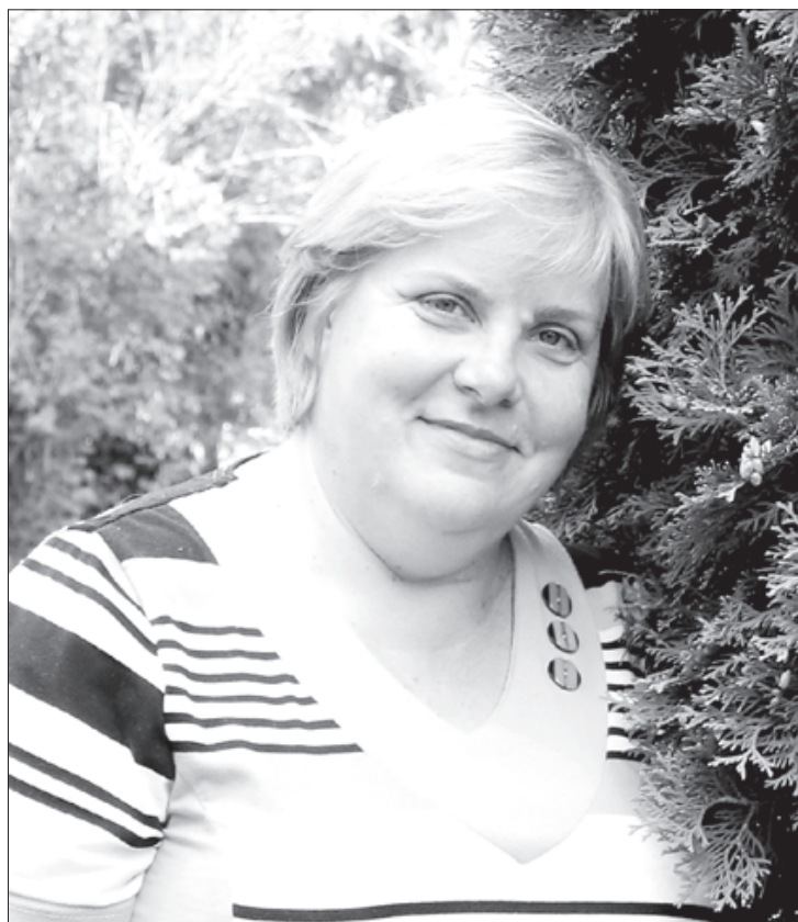
Dace veiksmīgi sadarbojas ar Sociālā dienesta, bāriņtiesas un policijas darbiniekiem, viņa izprot gan bērnu, gan vecāku problēmas.

– Es nemaz neprotu izvārit ne daudz, uz plīts vienmēr lieku sešu vai astoņu litru katlu. Ilgu laiku biju pilnas slodzes mamma, dzīvoju mājās un varēju izdarīt visu, kas bija vajadzīgs. Tas mani nenogurdināja. Biju pie tā pieradusi. To gan atceros, ka pusdienu galdā uzklāšana prasīja