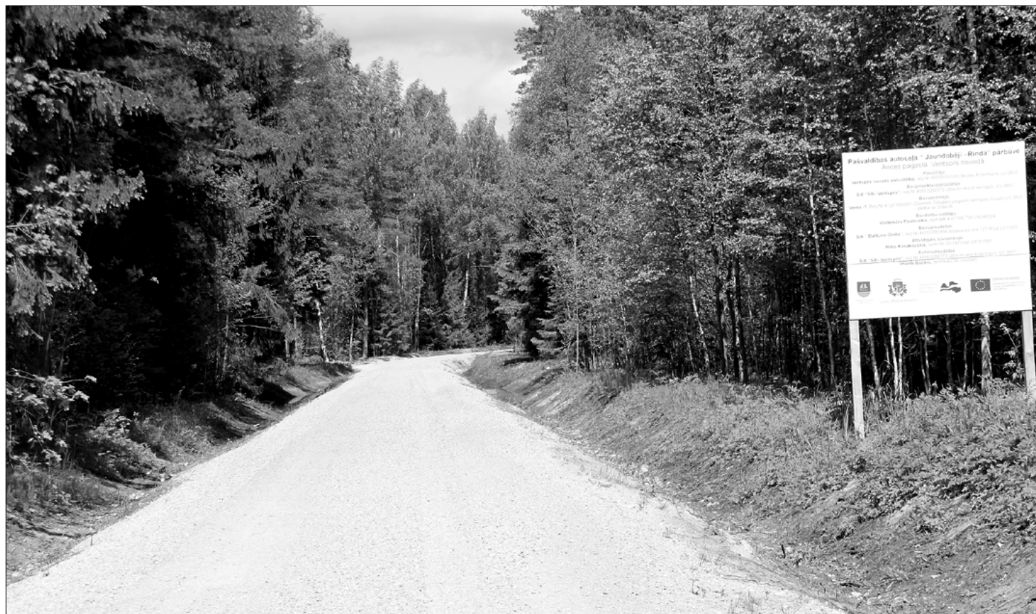
Ances pagastā pārbūvēts ceļš "Jaundobēji – Rinda".