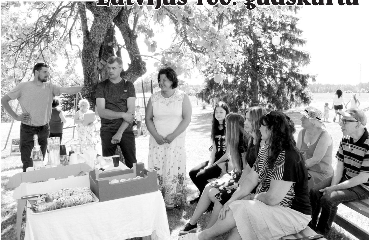
Projekta dalībnieki ir gatavi jauniem izaicinājumiem.

Kad projektā veicamie darbi bija sadalīti, Ameļciema un Dandzišciema iedzīvotāji izveidoja komandas, lai augustā piedalītos spēlē "Es i pužiš!". Komandas nopietni gatavojās, domājot par norīcējumu un mācoties tāmnieku dialektā stāstīt stāstu. 14. augustā Puzes kultūras namā spēle gāja