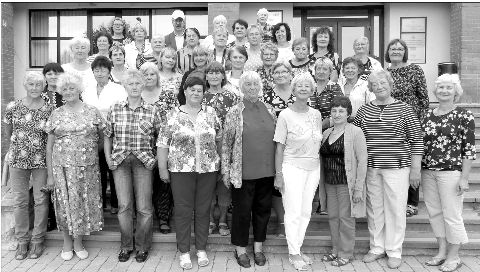
Ventspils novada seniori priecājas par kopā pavadīto laiku.