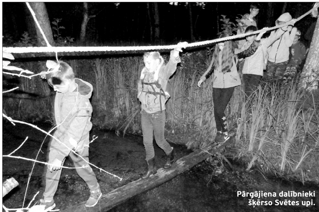
Pārgājiena dalībnieki šķērso Svētes upi.

Tālākajā ceļā nācās būt ļoti uzmanīgiem, jo pie upes ietekas Puzes ezerā ir liela bebru māja, un bebri