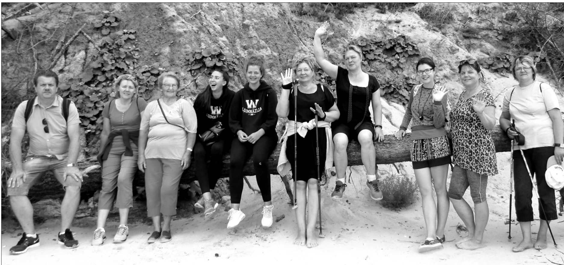
Užavnieki devušies ceļā, lai sasniegtu Jūrkalni.