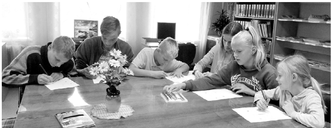
Skolēni rāda savas prasmes pirms mācību gada sākuma.