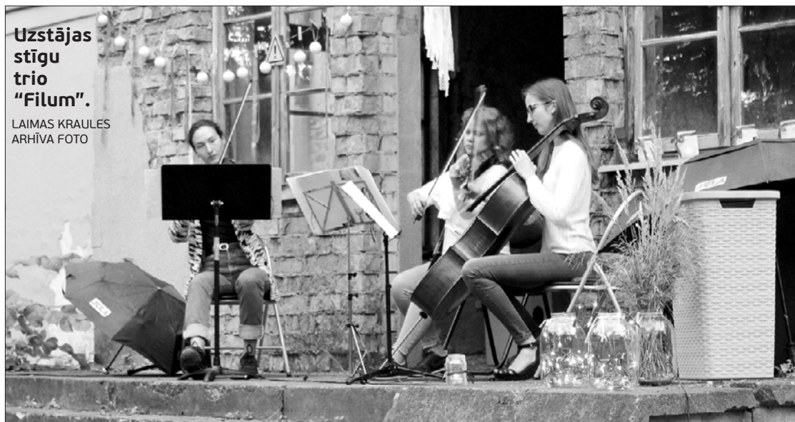
Uzstājas stīgu trio "Filum".