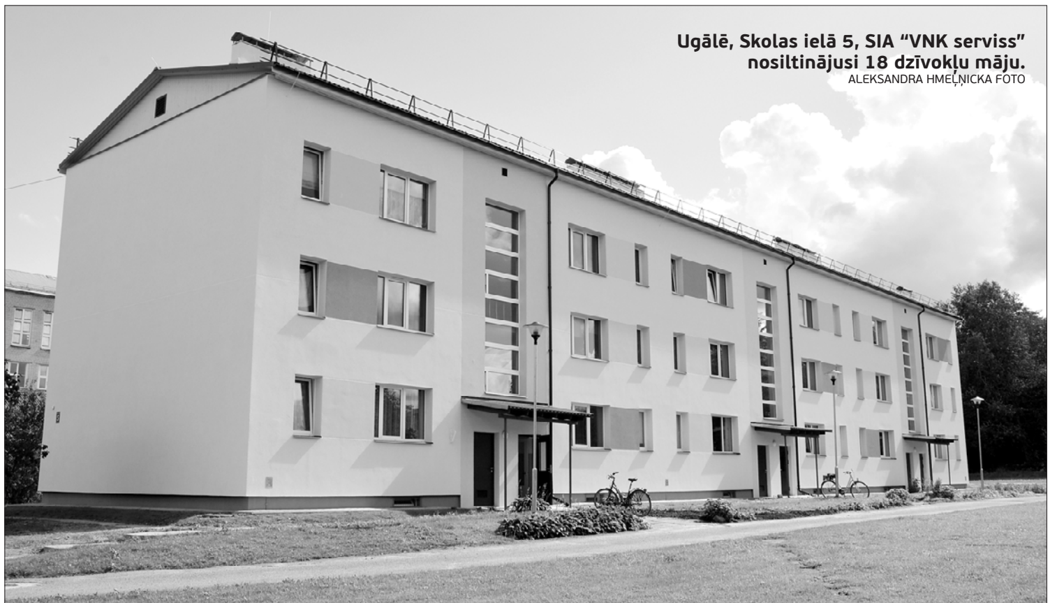
Ugālē, Skolas ielā 5, SIA "VNK serviss" nosiltinājusi 18 dzīvokļu māju.

Būvdarbi notika trīs mēnešus. Renovācijas laikā nomainīts ēkas jumta segums, siltināti bēniņi un pagraba pārsegums. Vecie logi nomainīti pret energoefektīviem trīs stiklu pakašu logiem, renovējot arī starplogu blokus. Pagrabā, lai telpas varētu vēdināt, iebūvēti atveramie logi. Ēka siltināta ar 150 mm minerālvates plāksnēm, tādējādi vismaz divas reizes samazinot siltuma zudumus caur celtnes sienām. Veikta mājas cokola hid-