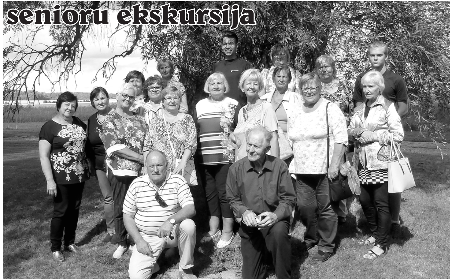
Tārgales ekskursanti devušies izzinošā ekskursijā uz Bauskas pusi.

Codē ekskursantu grupa devās uz saimniecību "Vaidelotes". Šeit