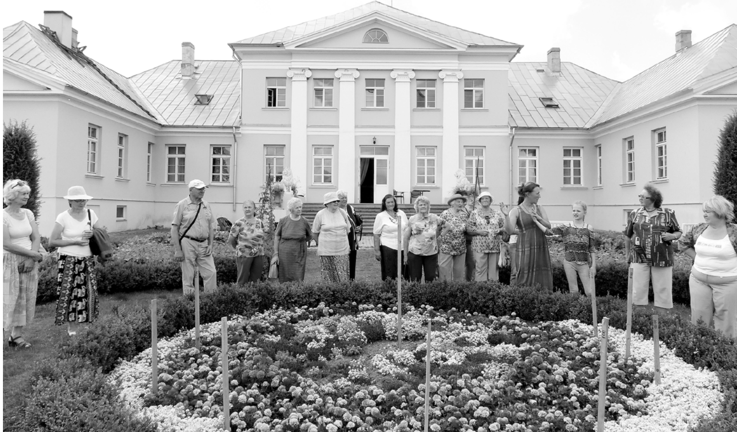
Pužiņi ieradusies Bruknā.