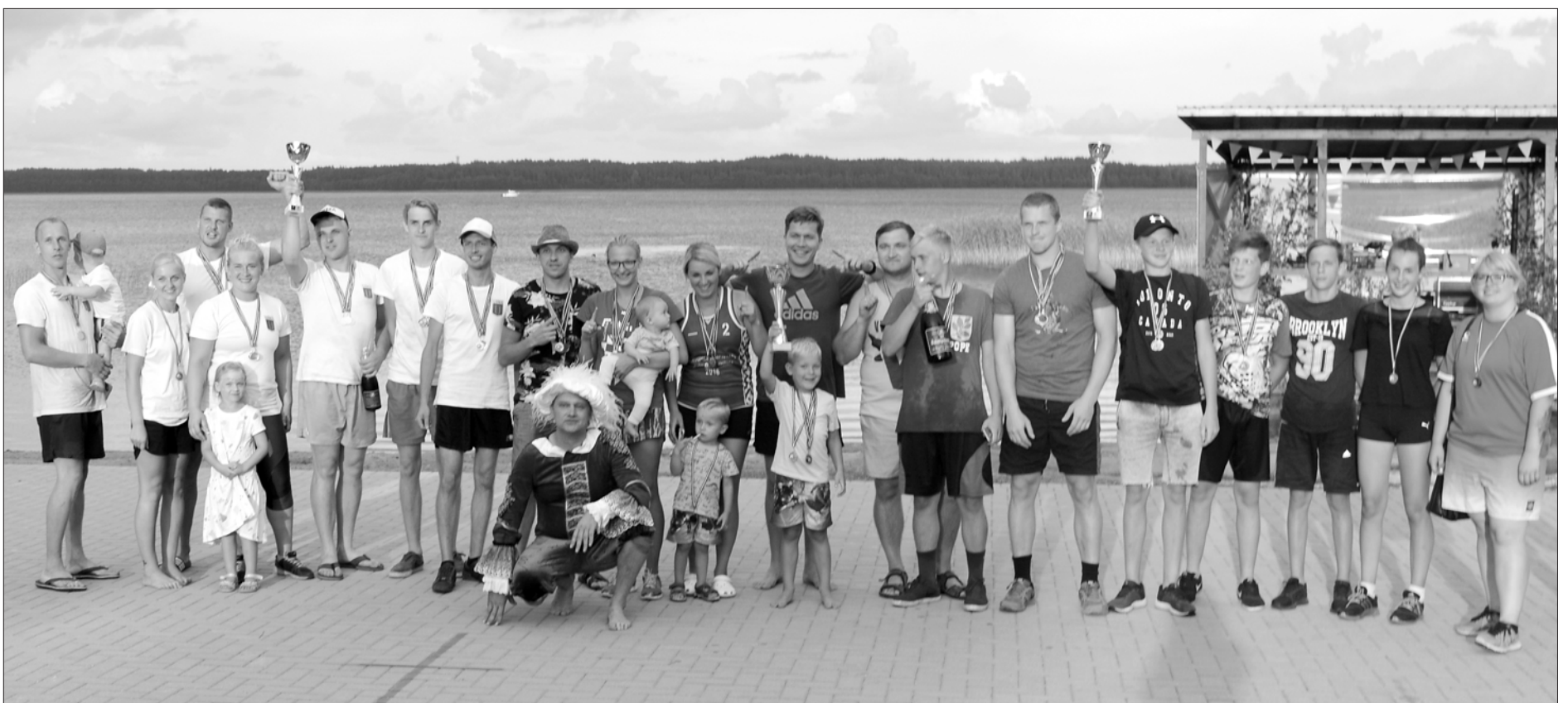
Aktīvie sporta spēļu dalībnieki.