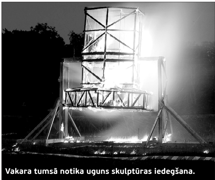
Vakara tumsā notika uguns skulptūras iedegšana.

10. jūlijā ar izstāžu atklāšanu un uguns skulptūras aizdegšanu noslēdzās devītais Jūrkalnes starptau-