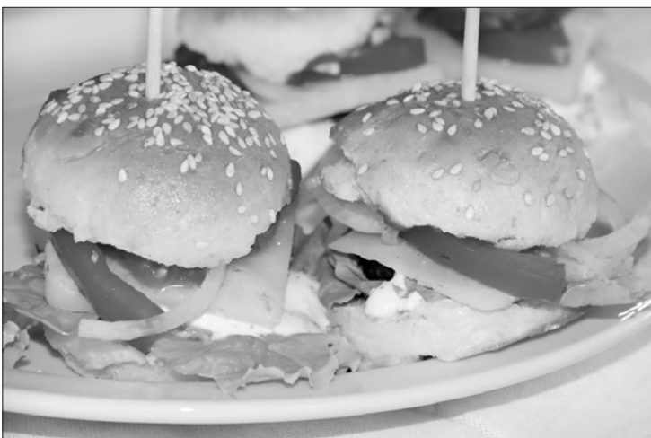
Kafejnīcas "Mežā" piedāvājumā ir nelieli burgerīši, kuru gatavošanā izmantota pašu cepta maize.