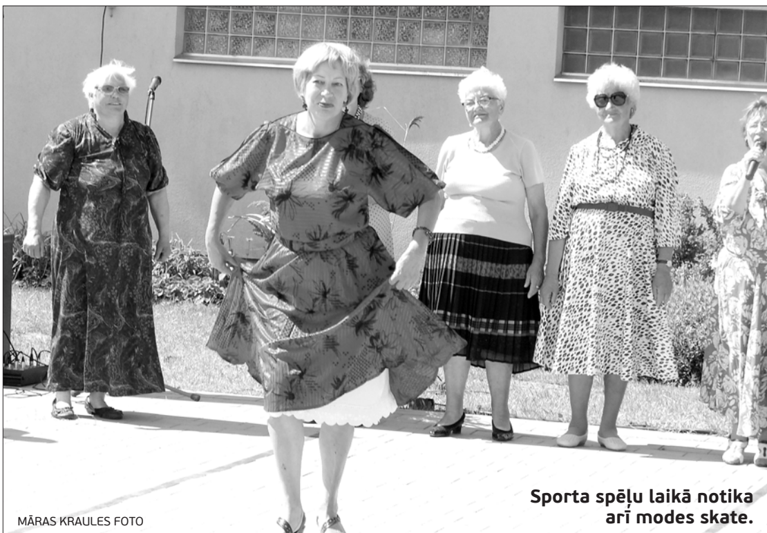
Sporta spēļu laikā notika arī modes skate.