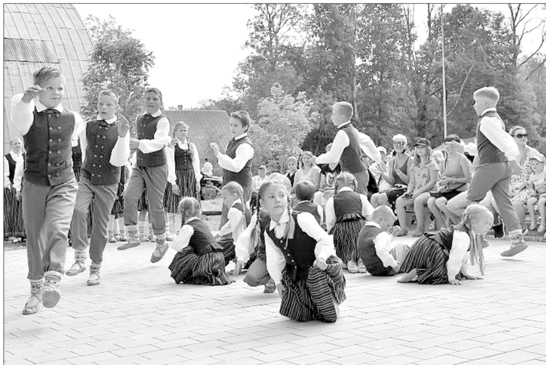
Uzstājas deju kolektīva "Vāruvīte" dalībnieki.