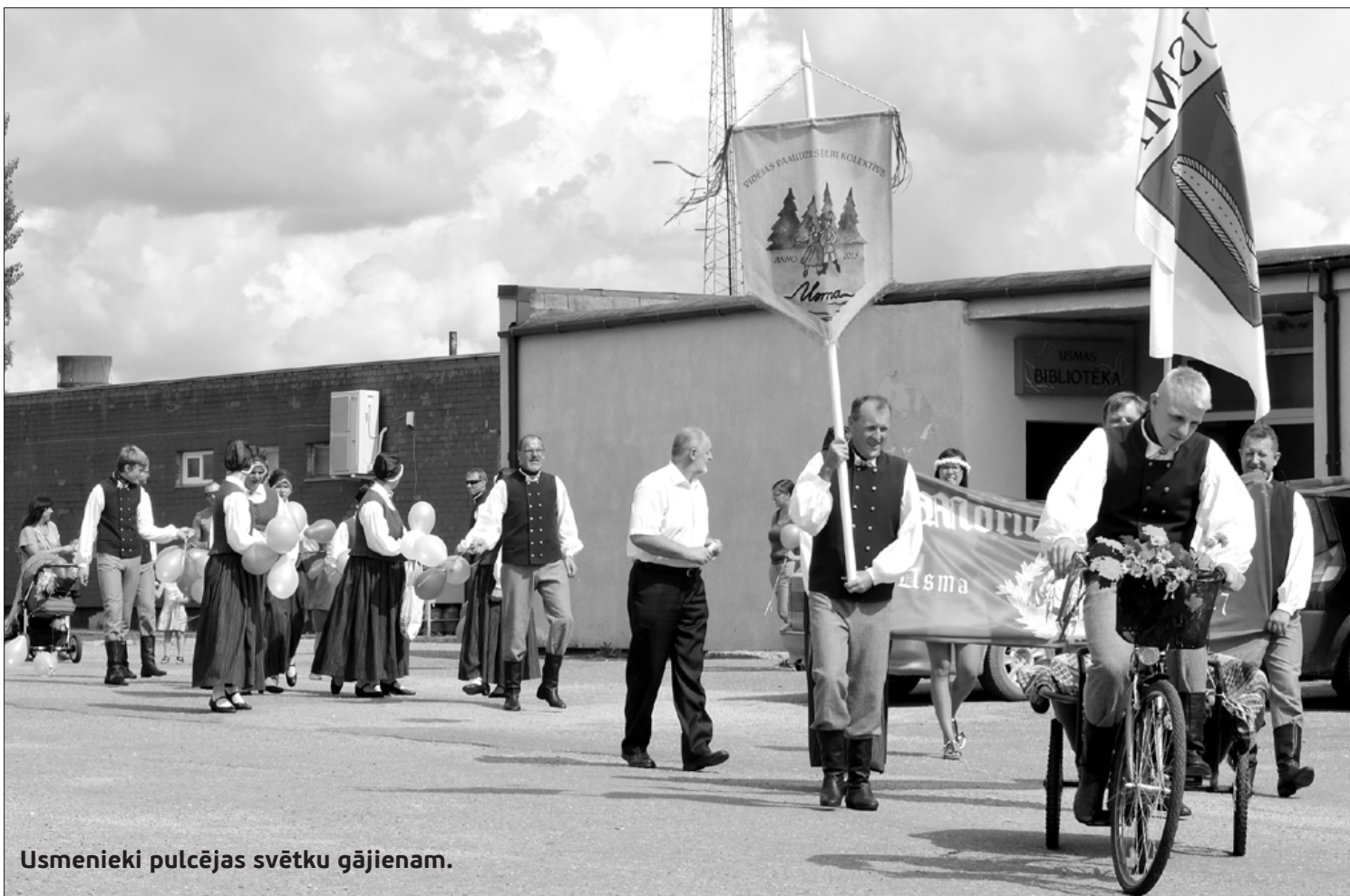
Usmenieki pulcējās svētku gājienam.