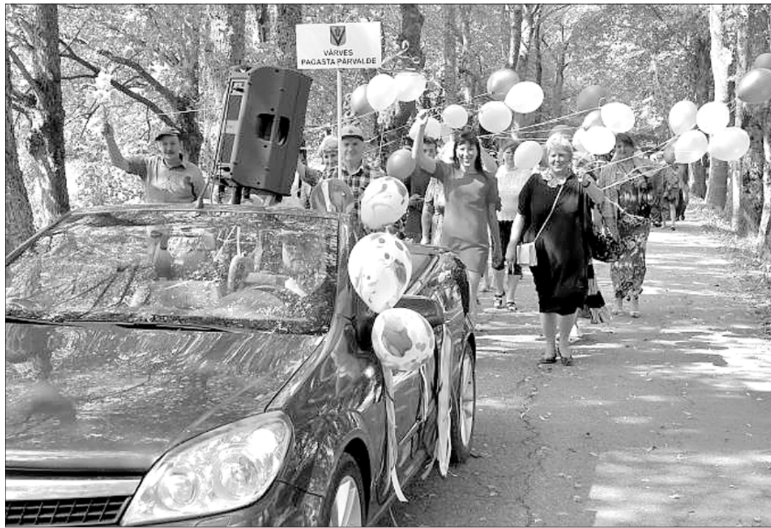
Gājienā dodas pagasta pārvaldes darbinieki.

Vārves pagasta kultūras darba organizatore Inga Berga