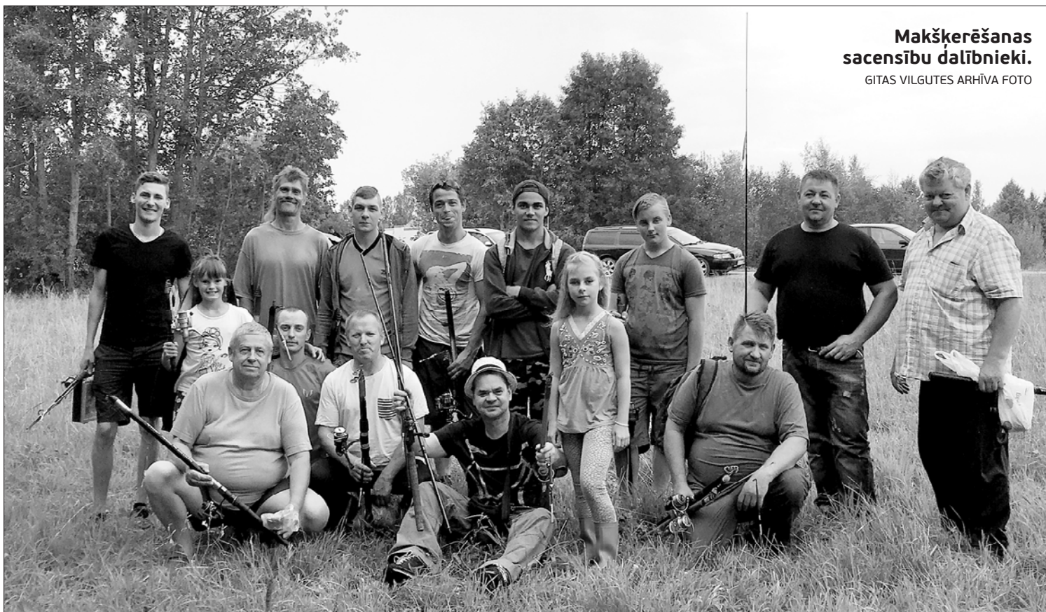
Makšķerēšanas sacensību dalībnieki.