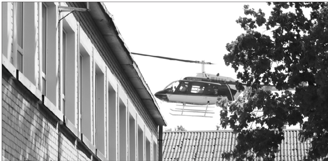
Bija neierasti pavisam zemu virs Stiklu ciema redzēt helikopteru. Gaisā strādāja ne tikai mūsu valsts, bet arī Lietuvas un Baltkrievijas pārstāvji.