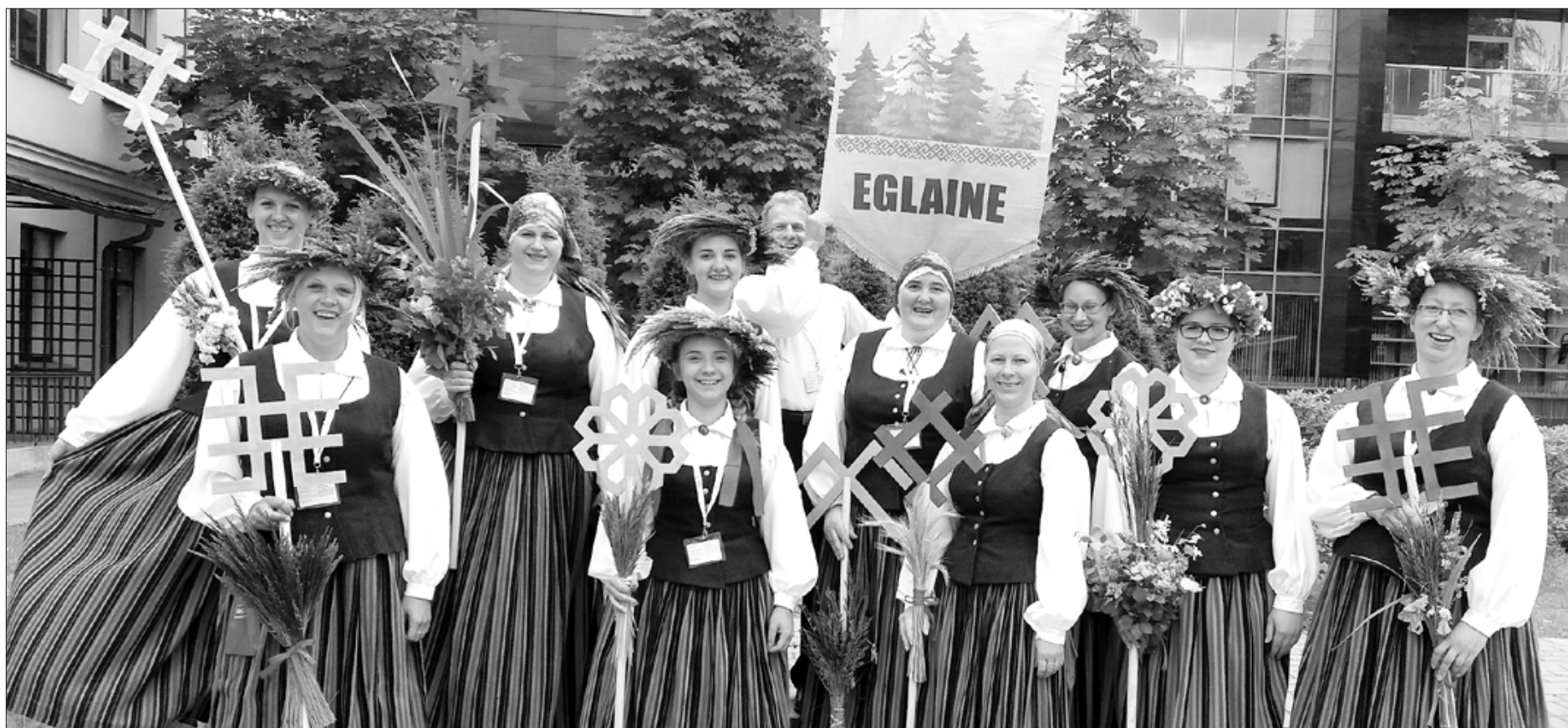
Kora "Eglaine" dziedātāji Rīgā Dziesmu svētku laikā.