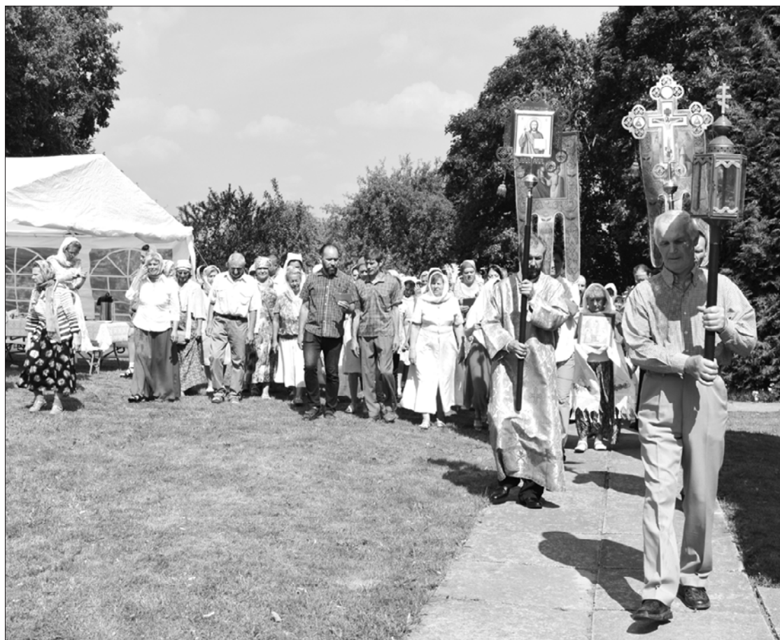
Ap 120 ticīgo Ugālē pieminēja svēto Sergiju Rodonežu.