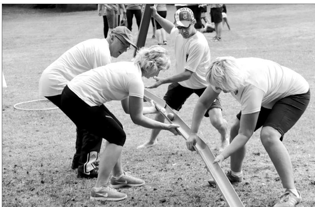
Mazajā stafetē uzvarēja Zlēku komanda.