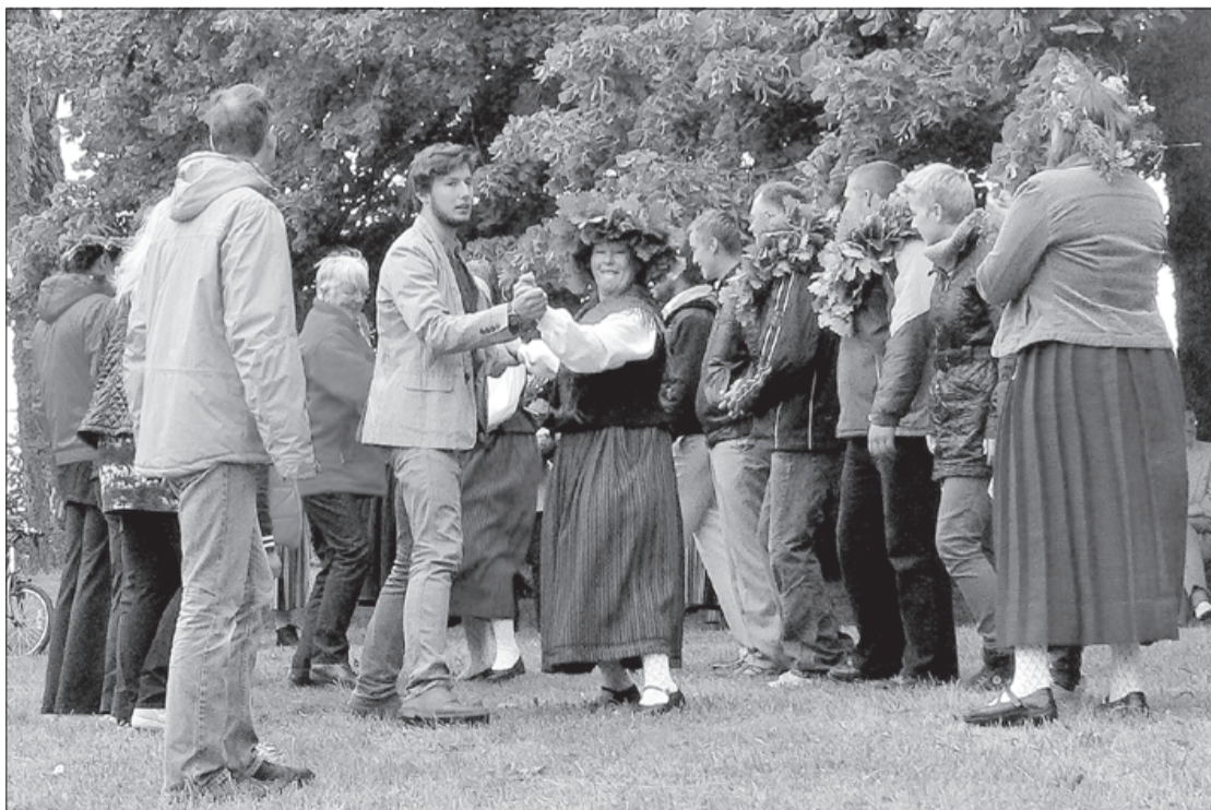
"Pūnikas" dziedātājas ielīgo vasaru.