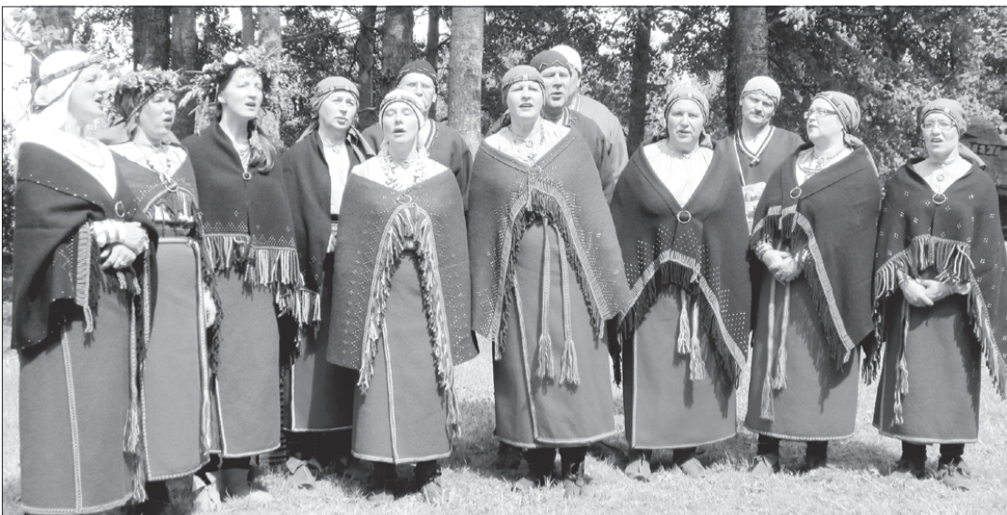
Uzstājas folkloras kopa "Egle" no Medņevas.

No 27. līdz 29. jūnijam suiti svinēja ceturto Starptautisko burdona festivālu.