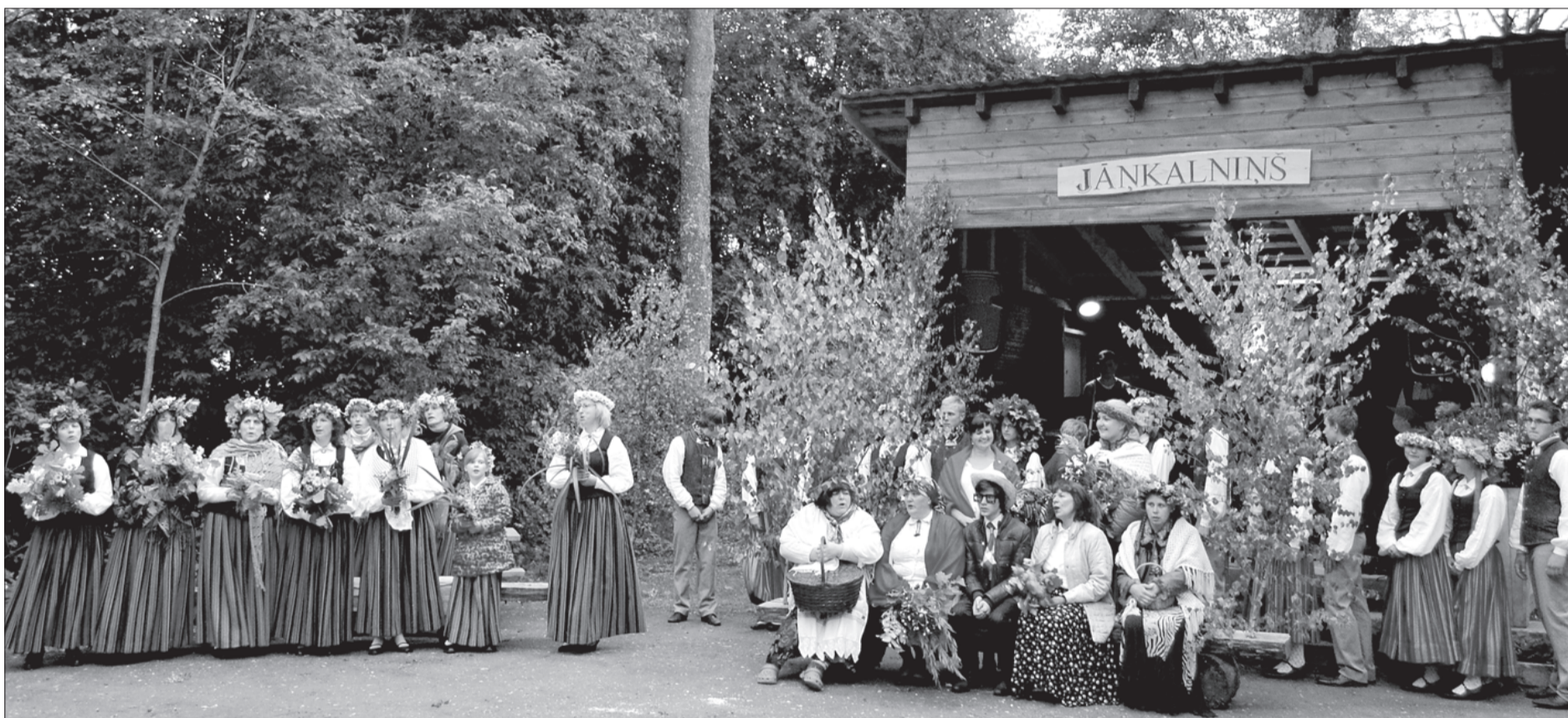
Jāņkalniņa estrādē sapulcējušies Ugāles pašdarbības kolektīvi.