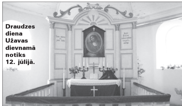
Draudzes diena Užavas dievnamā notiks 12. jūlijā.

Ventspils novads ir bagāts ar vairākiem dievnamiem, kuriem ir īpaša kultūrvēsturiska nozīme. Eiropas mēroga kultūras pērles ir Piltenē, Landzē, Užavā, kā arī citviet novadā, un šīs pērles nozīmīgas ne tikai draudzei, bet arī Ventspils novadam un Latvijai.