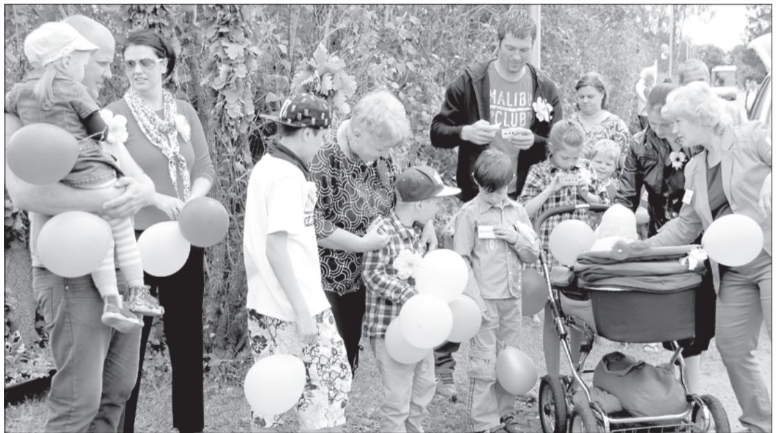
Pasākumā piedalījās ap 30 bērņus un 70 pieaugušos.