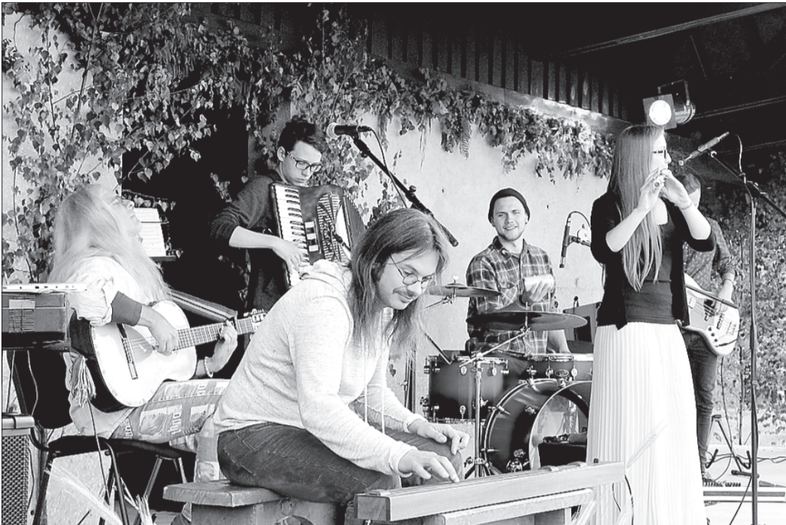
Uzstājas "Nepieradinātā folka orķestris".

Ir aizvadīti latviešu lielākie svētki – vasaras saulgrieži.