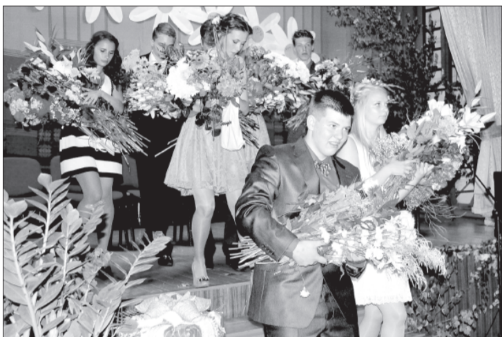
Saņēmuši dokumentus, jaunieši dodas fotografēties pie skolas.