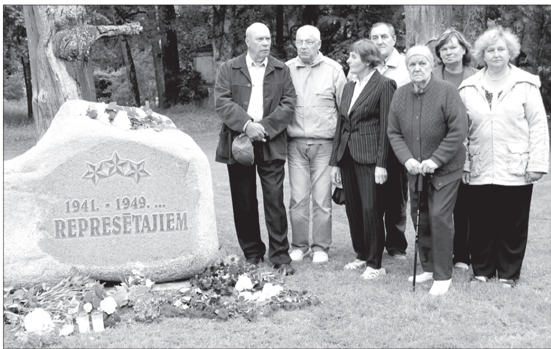
Šie cilvēki zina, ko nozīmē izsūtījums.

Līdz ar iekāpšanu lopu vagonā prātā šaudās tikai viena doma – kur un kāpēc? Liekas, ka pavisam drīz vaigos būs izgrauzušās sarkanas rievās, pa kurām baiļu un apjukuma straumes izsprauksies cauri salmiem, dēļiem, nokļūs uz vilciena sliedēm un plūdis atpakaļ uz Latviju, uz mājām, tomēr ar ikkatru nobirušo asaru es tikai attālinos no savas Dzimtenes. Brīdī, kad vilciena riteņi sāk kaut un bremzēt, esam klāt. Šeit, Tomskas apgabala stepēs, pavadīju nākamās astoņus dzīves gadus. Augu roku rokā ar badu, pārpūli, bailēm, nicinājumu, tomēr tas neļāva zaudēt latviešiem raksturīgo darba sparū un cerību, ka kādreiz būs labāk. Es, mana ģimene un pārējie izsūtītie, bijām kā ozoli,