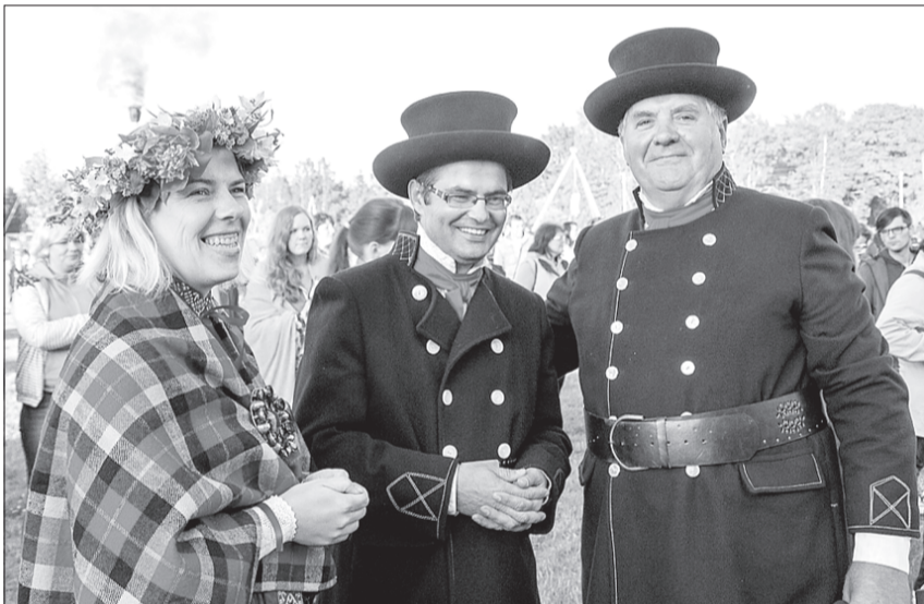
Viesus sagaida mājinieki.