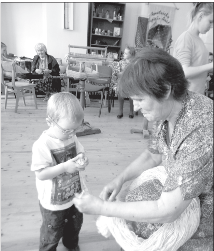
Mazās roķeles palīdz tīt kamolus.

KNHM atbalstītais projekts "Vasaras radošā darbnīca Ances muižā" rit pilnā sparā. Materiāli sagādāti, musturi izdomāti. Darba pilnas rokas. 4. jūnijā uz kamolu tīšanas talku aicinājām Ances iedzīvotājus un piedzīvojām ļoti patīkamu pārsteigumu. Kopā sanāca 30 talcinieku, un rezultāts bija iespaidīgs – satinām 111 kamolu ar kopējo svaru 19 kg. Nu jau arī velku bize uzmešta un ievilkta stellēs. Atliek vien dot startu muižas grīdas tepiķa aušanai.