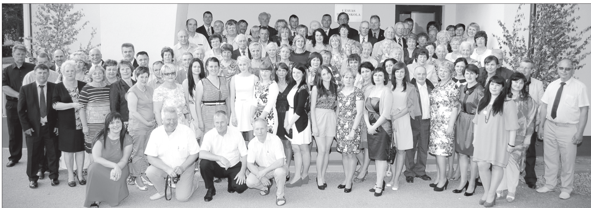
Priecīgie Užavas skolas salidojuma dalībnieki.