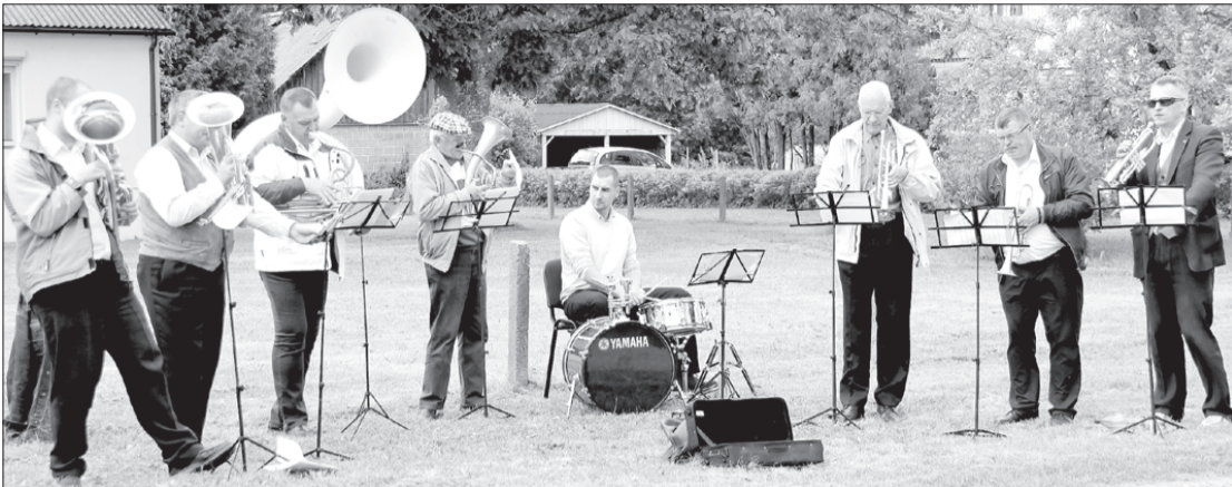
Svētkos muzicēja Ugāles pūtēju orķestris.