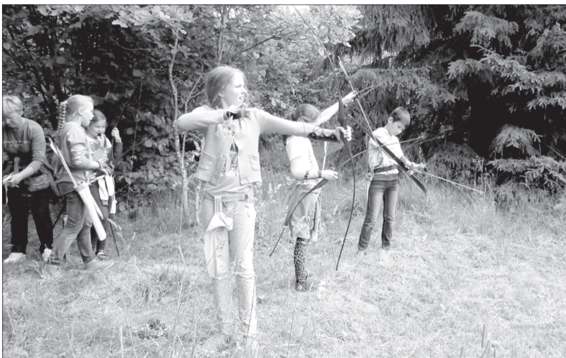
Meitenes iemēģina roku loka šaušanā.