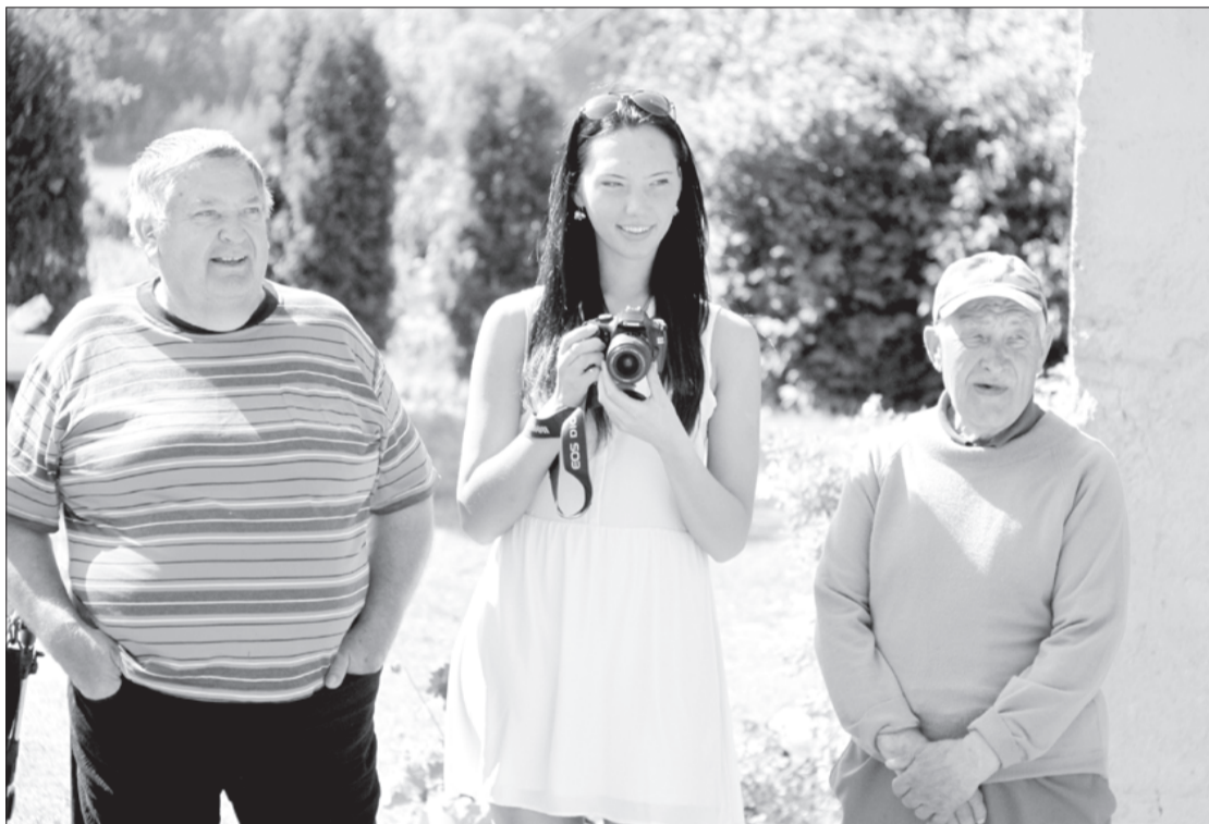
Kūts atklāšanā piedalās gan mājinieki, gan kaimiņi.