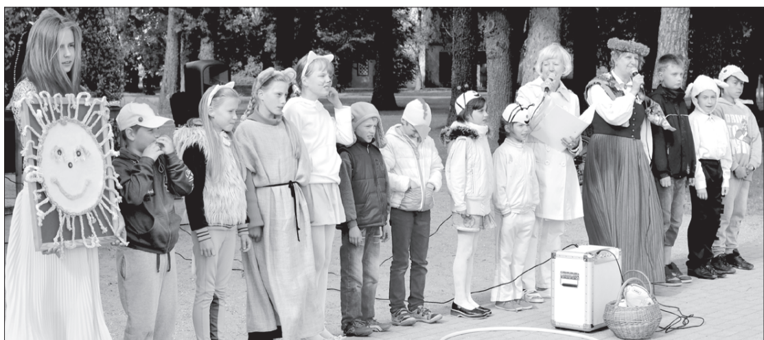
Līgotāji sanākuši Tārgales pagasta brīvdabas laukumā.