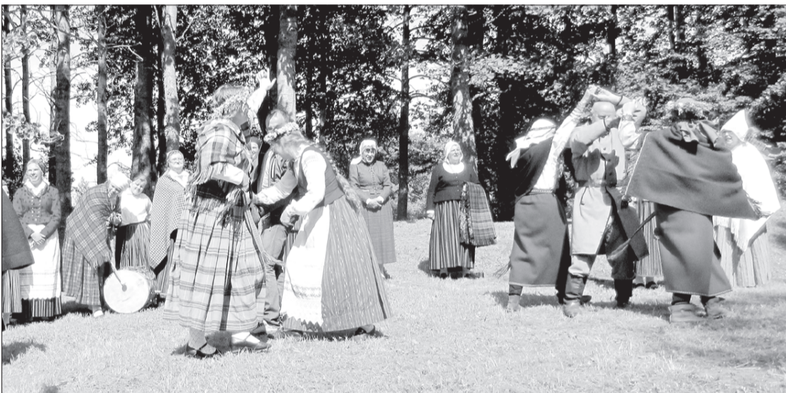
"Skandinieku" jautrie danči.

Burdona festivāls uzskatāms par valstiski un nacionāli nozīmīgu kultūras notikumu, kas norisinās suitu kopienas apdzīvotajā teritorijā – Alsungas novadā, kur mīt dižie suiti, Kuldīgas novada Gudenieku pagastā, ko dēvē par krētaino suitu zemi, un Ventspils novadā Jūrkalnes pagastā, kur dzīvo maģie suiti.