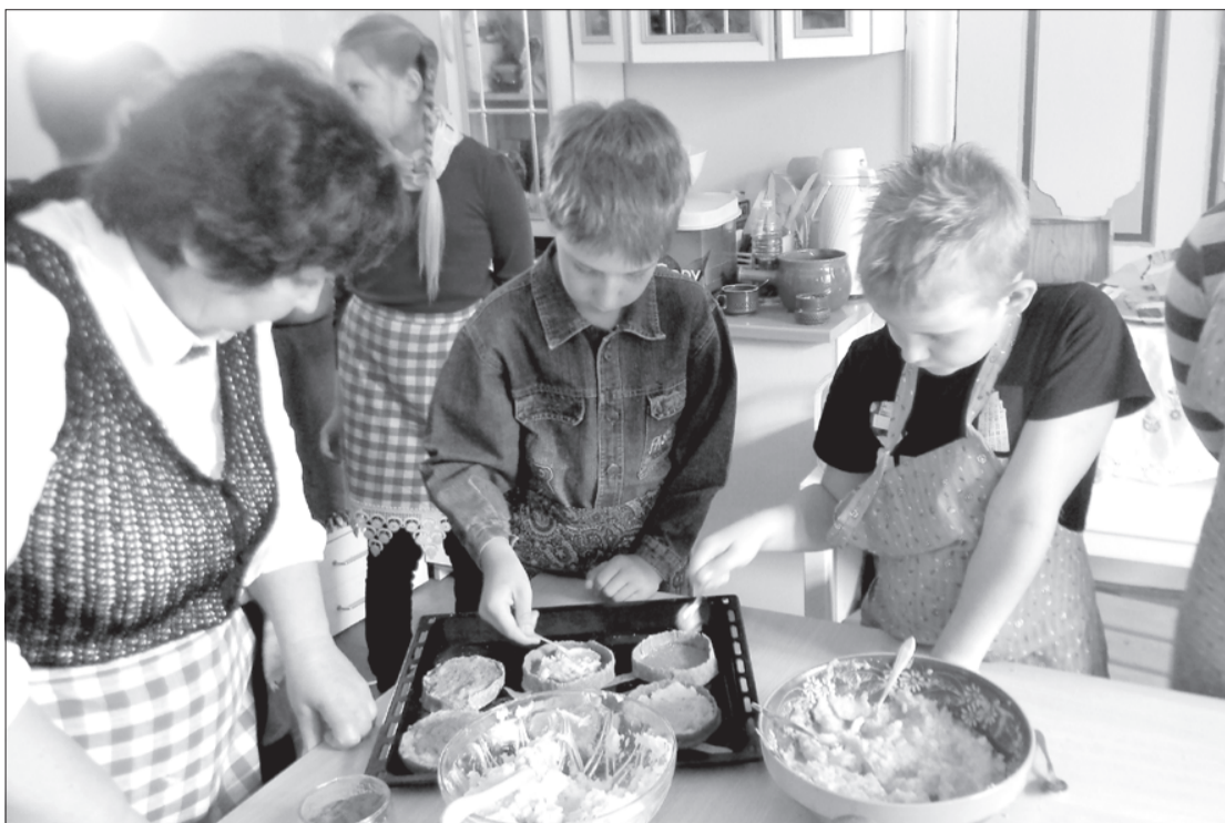
Zēni apgūst sklandrausu cepšanas prasmi.