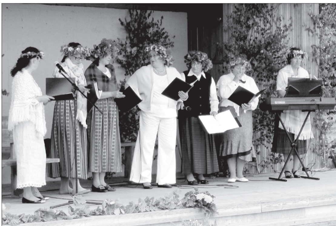
Uzstājas "Saivas" dziedātājas.