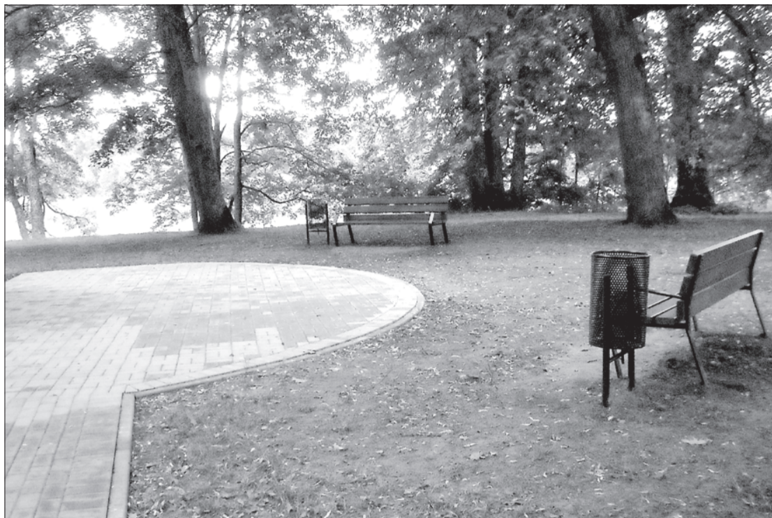
Pie Landzes baznīcas nobruģēts celiņš.