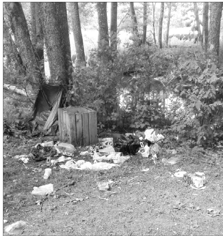
Viena no atpūtas vietām pēc atpūtnieku apmeklējuma.

Attīstības nodaļas vadītāja Ginta Roderte