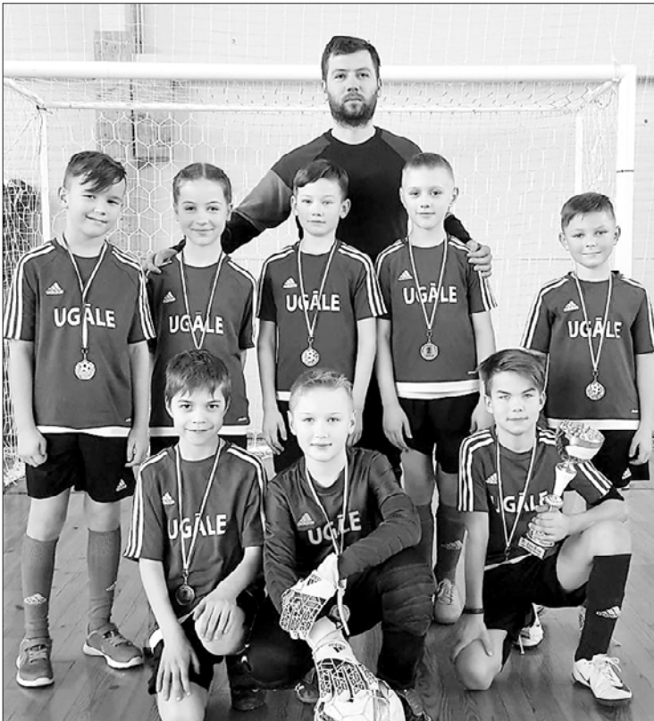
Ugālnieki priecājas par iegūto otro vietu.