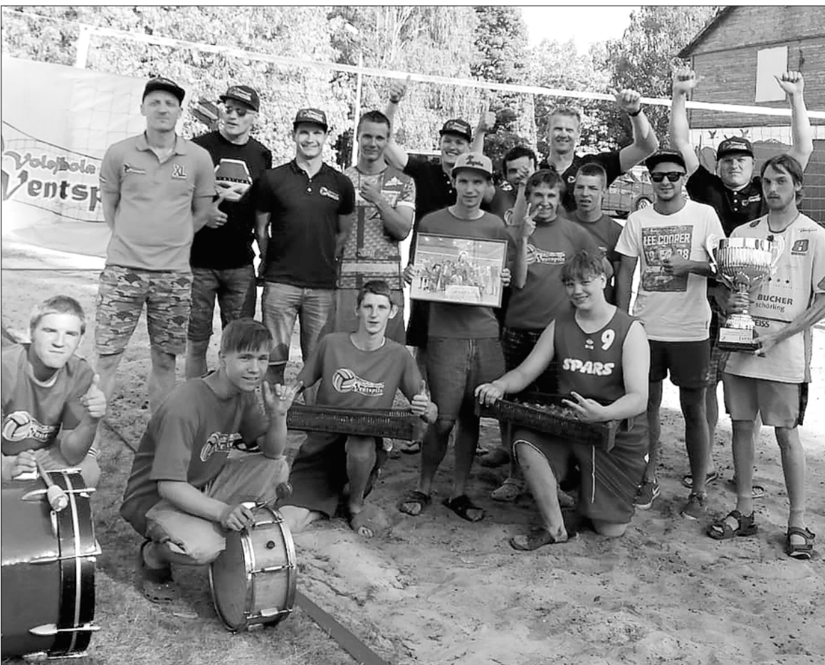
Volejbolisti kopā ar bērnu nama audzēkņiem.