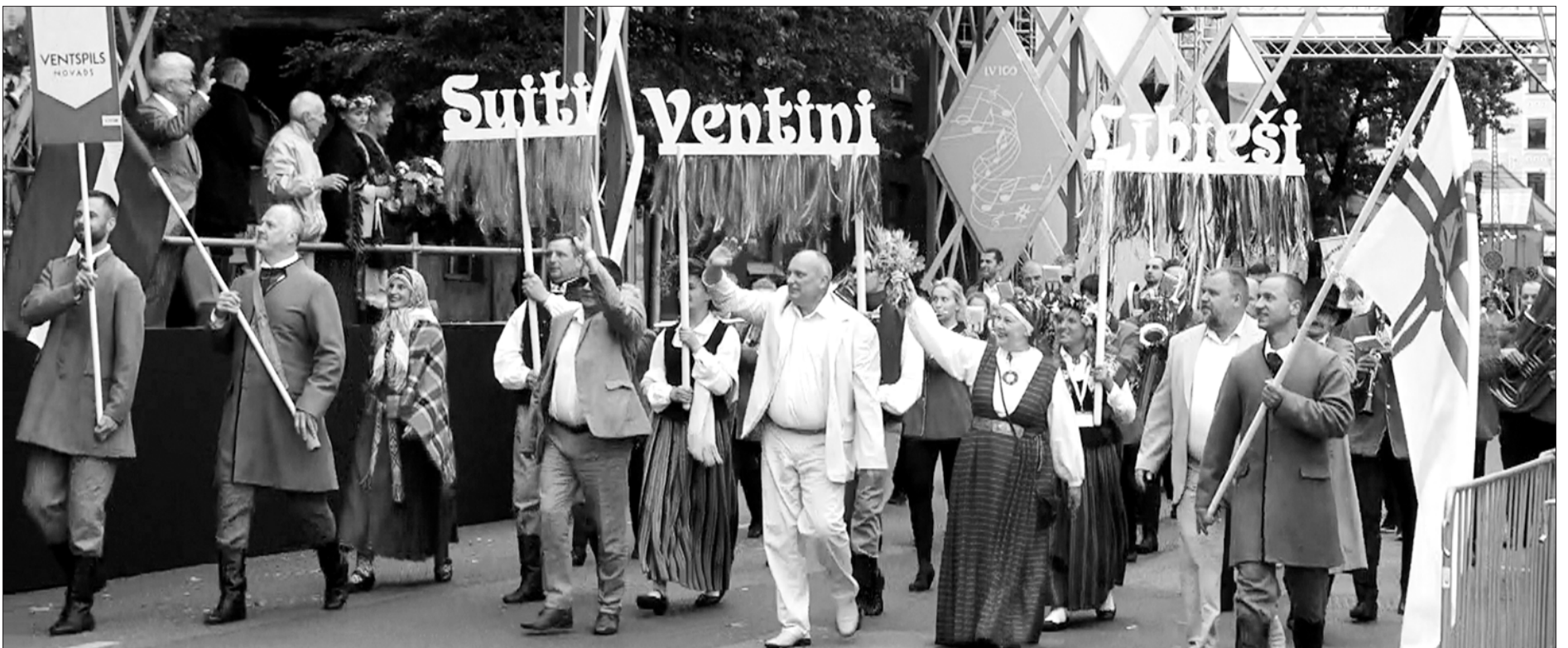
Gājiēnā dodas Ventspils novada pārstāvji.