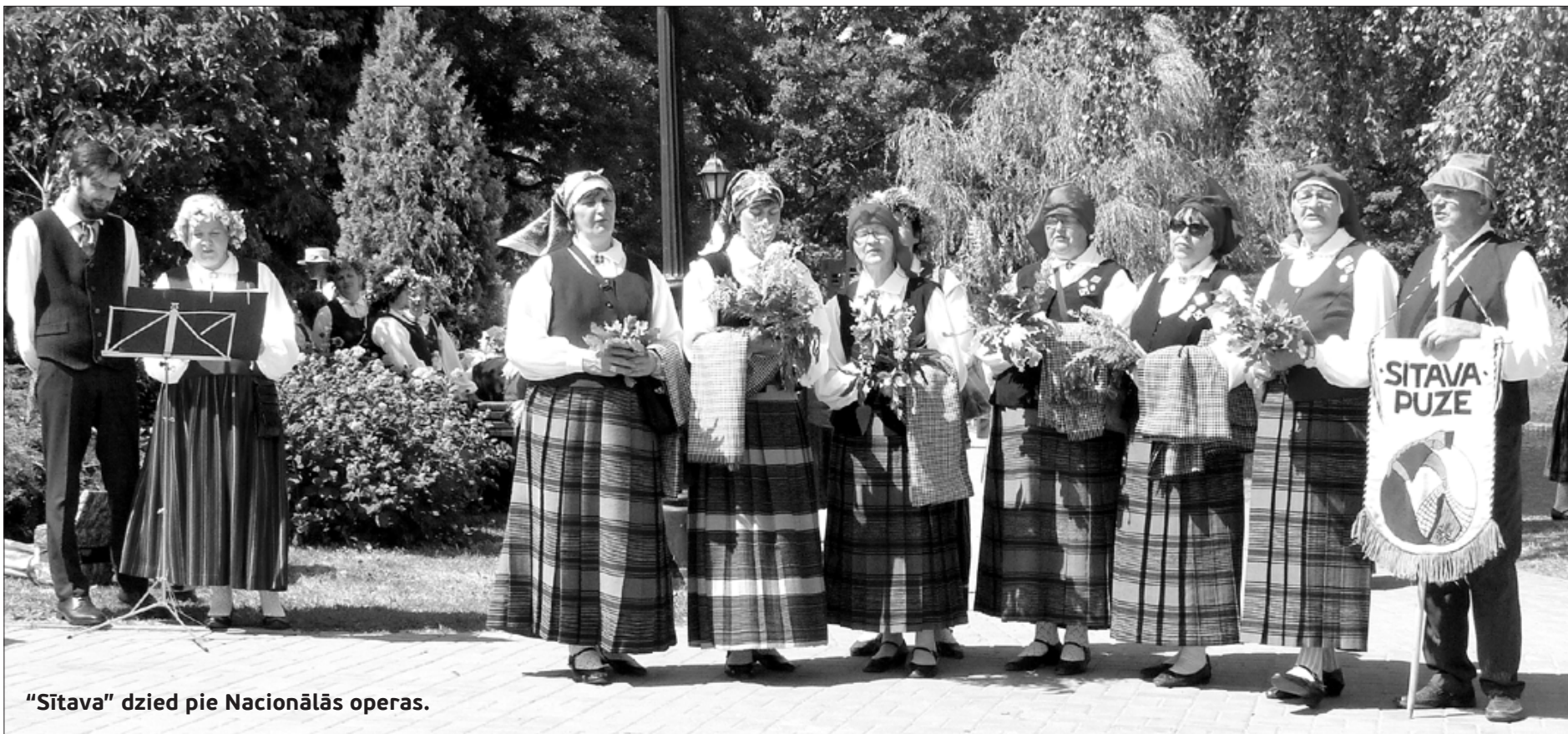
“Sītava” dzied pie Nacionālās operas.