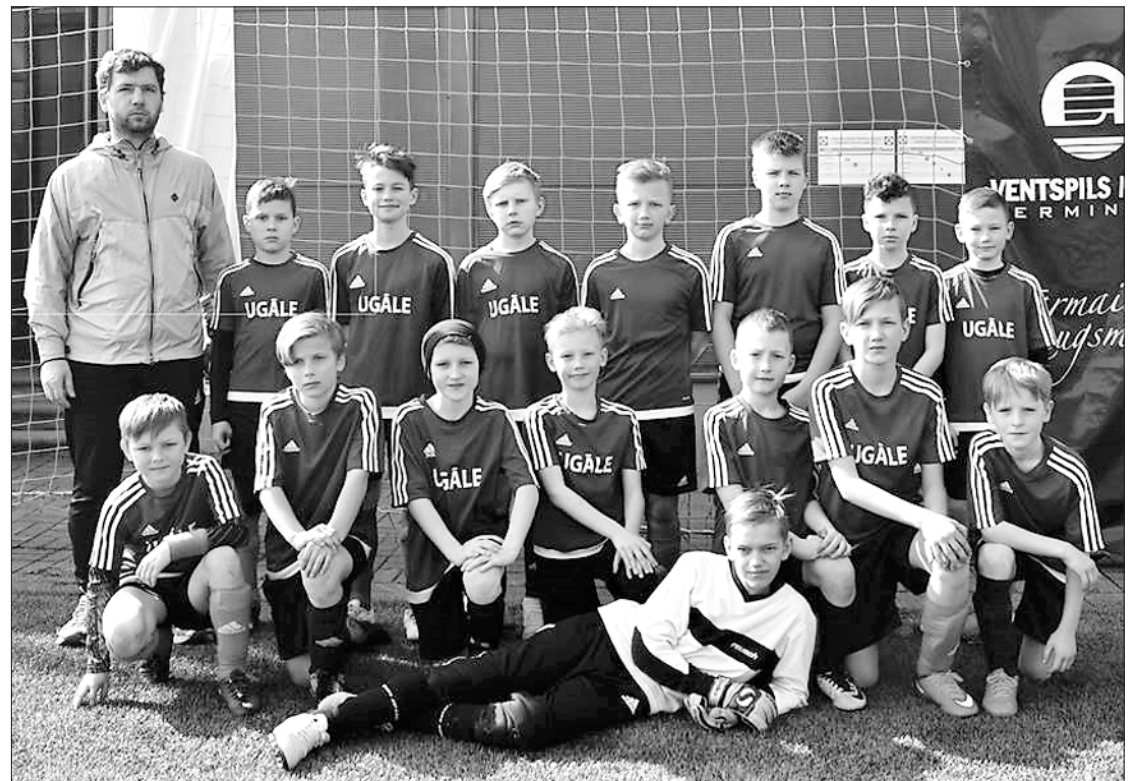
Treneris Kirils kopā ar saviem audzēkņiem.