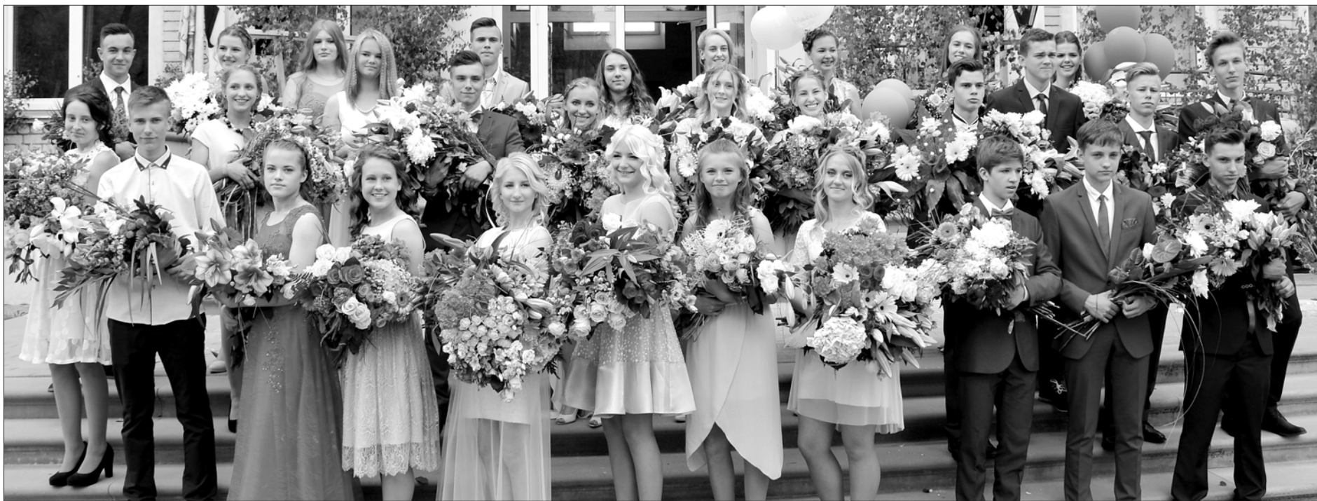
Devītās klases absolventi jau saņēmuši apliecības par vispārējo pamatizglītību.