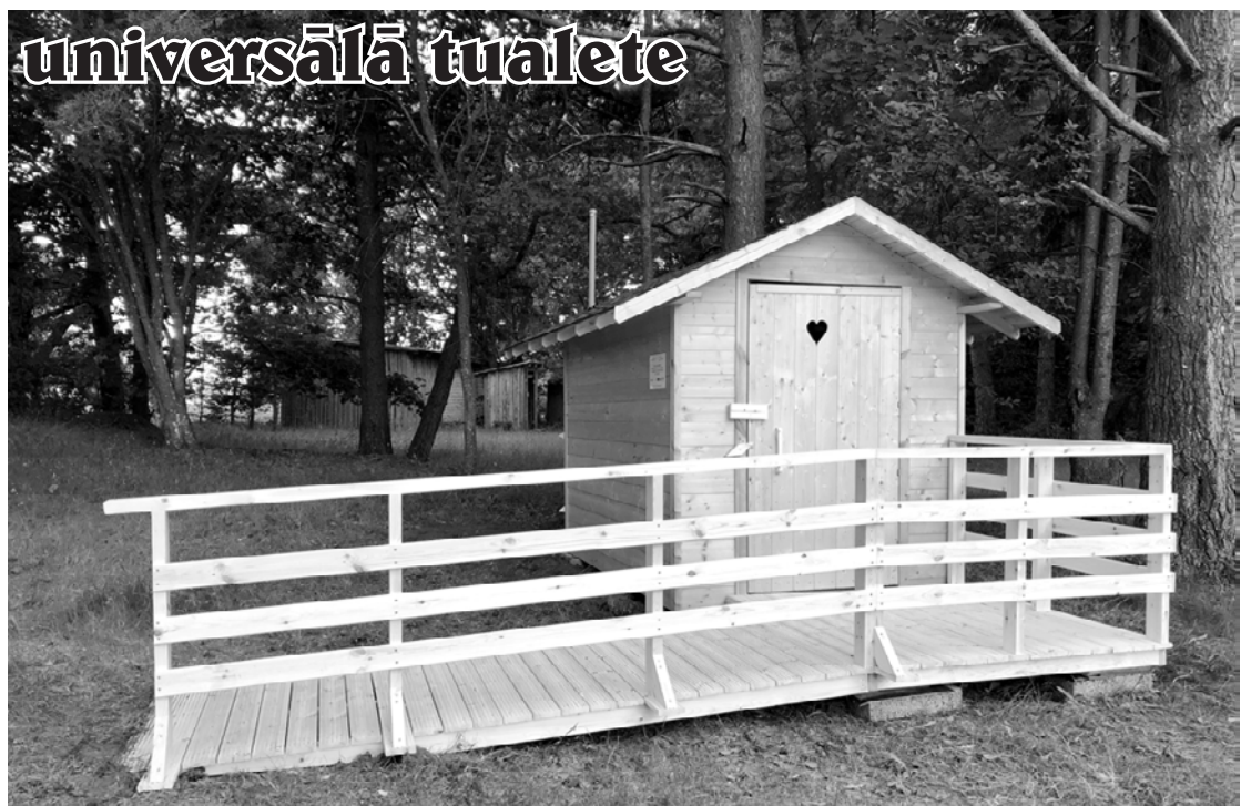
Jūrkalnē uzstādīta zaļā universālā tualete.