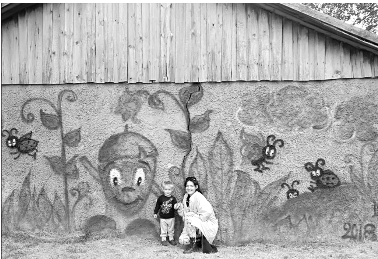
Zīļuks gaida bērnus ciemos, šī zīmējuma autore ir Ilze Lagzdiņa.