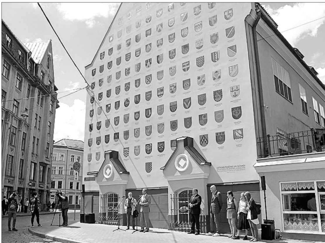
Ģerboņu sienā atrodama arī Ventspils novada oficiālā emblēma.