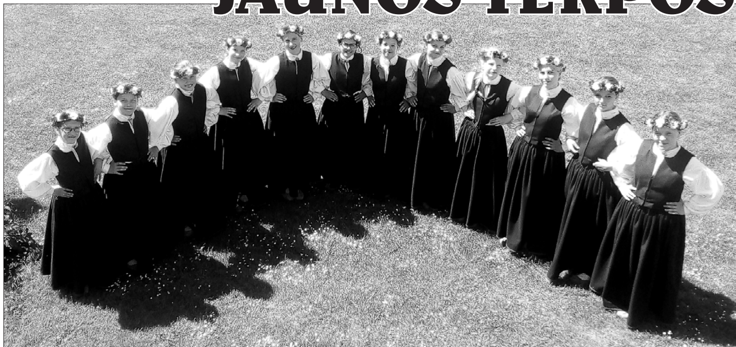
"Dores" 5.–9. klašu meitenes jaunajos tautastērpos.

Tikai pirms paša brauciena uz Jelgavu saņēmām jaunos tautastērpus 5.–9. klašu grupas meitenēm. Tie tapuši ar Ventspils novada pašvaldības atbalstu. Liels paldies! Bija patīams prieks redzēt,