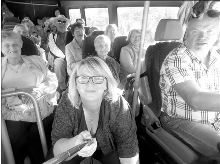
Jūrkalnieki devušies izbraucienā uz Lietuvu.

Klāt vasara un laiks, kad vairs negribas sēdēt telpās, drīzāk redzēt, kas notiek tuvākā vai tālākā apkārtnē.