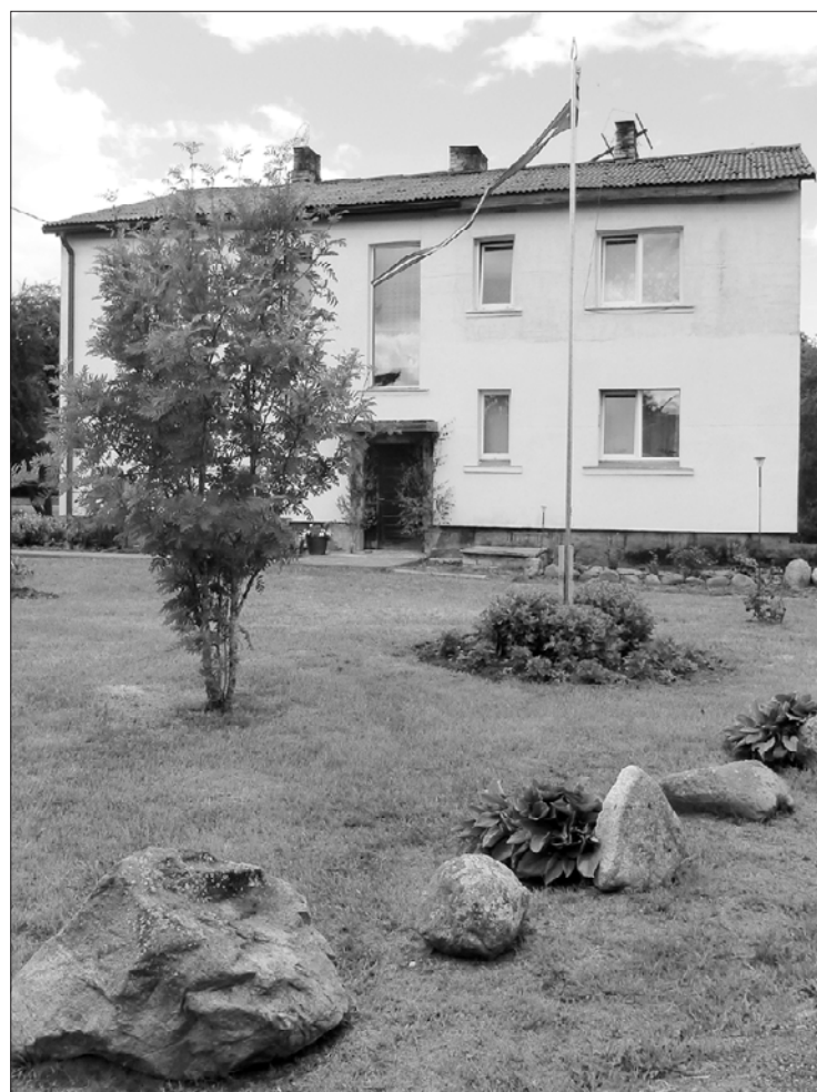
"Alejās" ir tīra un sakopta vide.