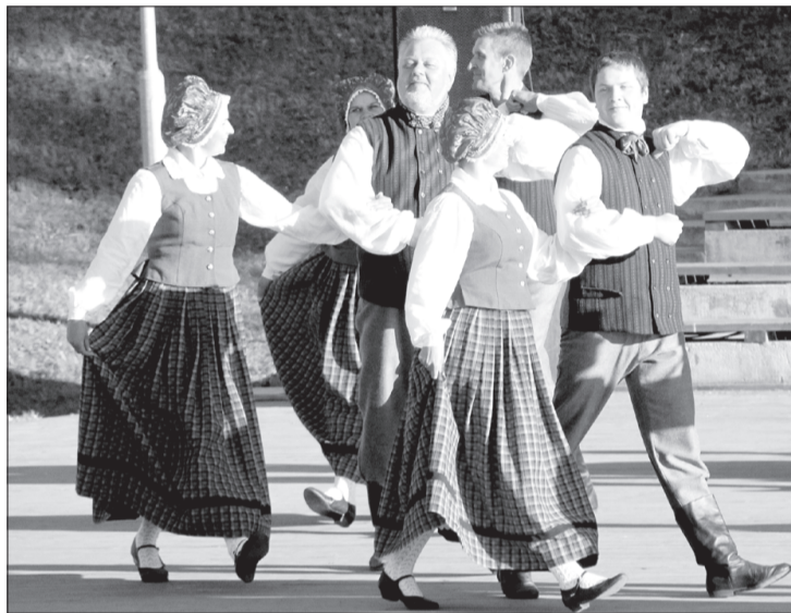
Uz skatuves – Ances pagasta vidējās paaudzes pārstāvji.