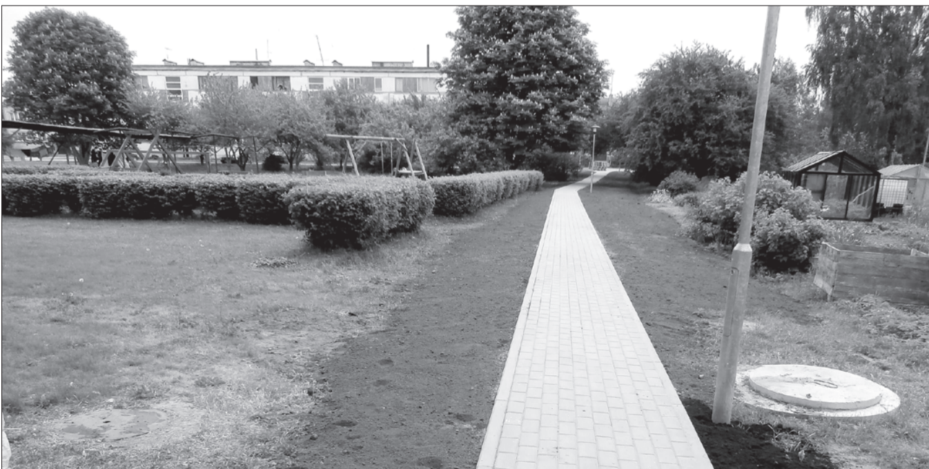
Rekonstruētais celiņš Užavā.