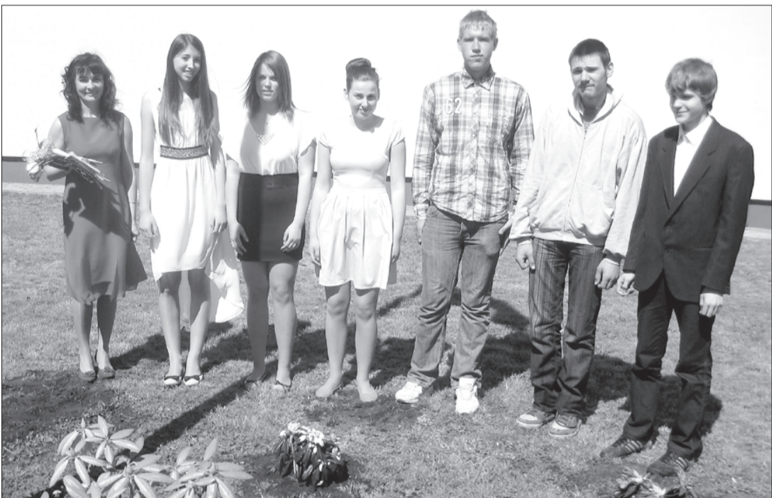
"Devītie" iestādījuši rododendrus.

Maijs Užavas pamatskolā bijis saspringta darba pilns gan skolotājiem, gan skolēniem. Prieks, ka starp gada noslēguma pārbaudes darbiem pietika laika arī dažādiem jaukiem pasākumiem.