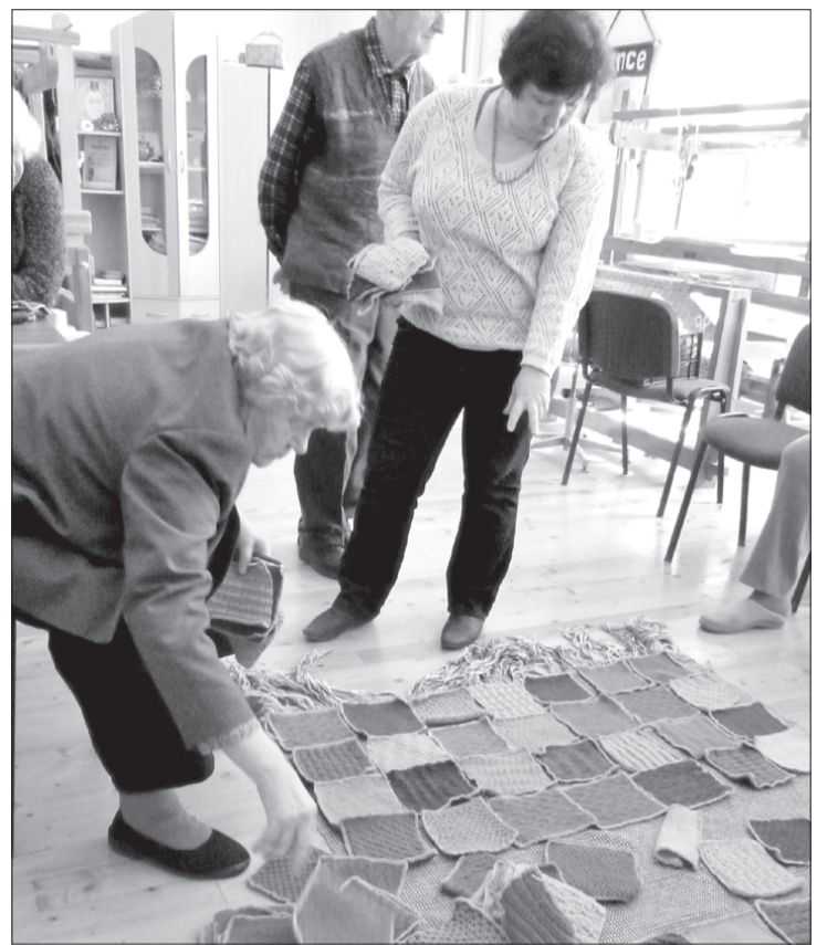
Top no dāvinātās dzijas veidotais musturdeķis.

Paukeriešu radītais "Amatnieku spiets" ir izturējis laika pārbaudi, katru gadu atkal un atkal sasaucot kopā mūsu pašu un kaimiņu novada amatniekus. Nu jau droši varu teikt, ka pēc astoņām spietošanas reizēm pasākumam ir stabila vieta Ances pagasta kultūras dzīvē. "Spiets" katru gadu dižojas ar cilvēku prasmi gan lauku apvidos, gan pilsētās radīt ar pašu rokām skaistus un konkurētspējīgus rokdarbus. Mēs rādām, ko gada laikā esam apguvuši un izgatavojuši. Ar šī pasākuma starpniecību Anci iepazīst arvien vairāk cilvēku, un, kas ir būtiski, – tie ir ne tikai rokdarbnieki! Priecē tieši tas, ka citiem ir vēlme atbraukt un piedalīties. Katra amatnieku satikšanās atšķiras. Šis gads atnesa patīkamus pārsteigumus, rosīnot uz pārdomām. Mūs apciemoja Vārves pagasta seniori, kuri atbrauca izlūkot, kā mēs Ancē dzīvojam. Viņi gan apmeklēja pasākumu, gan devās īsā ekskursijā pa Anci, rādot labu piemēru, kā saturīgi pavadīt dienu. Spāres rokdarbniecēm, kas pie mums viesojas katru gadu, šogad līdzī atbrauca deju kolektīva dalīb-