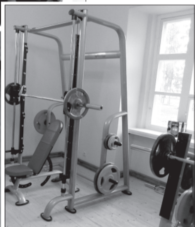
Trenāžieru zāle atrodas Ances muižā.