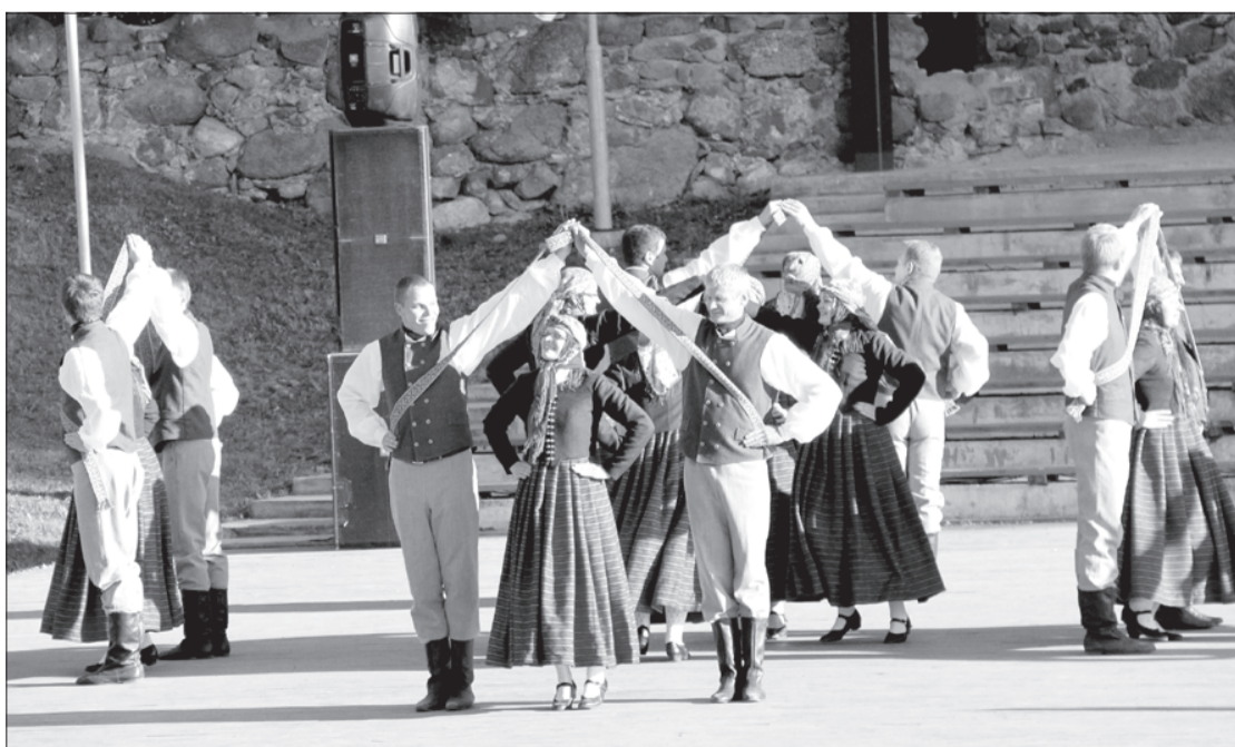
Raitā dejas soli ugālnieku vidējās paaudzes dejotāji.