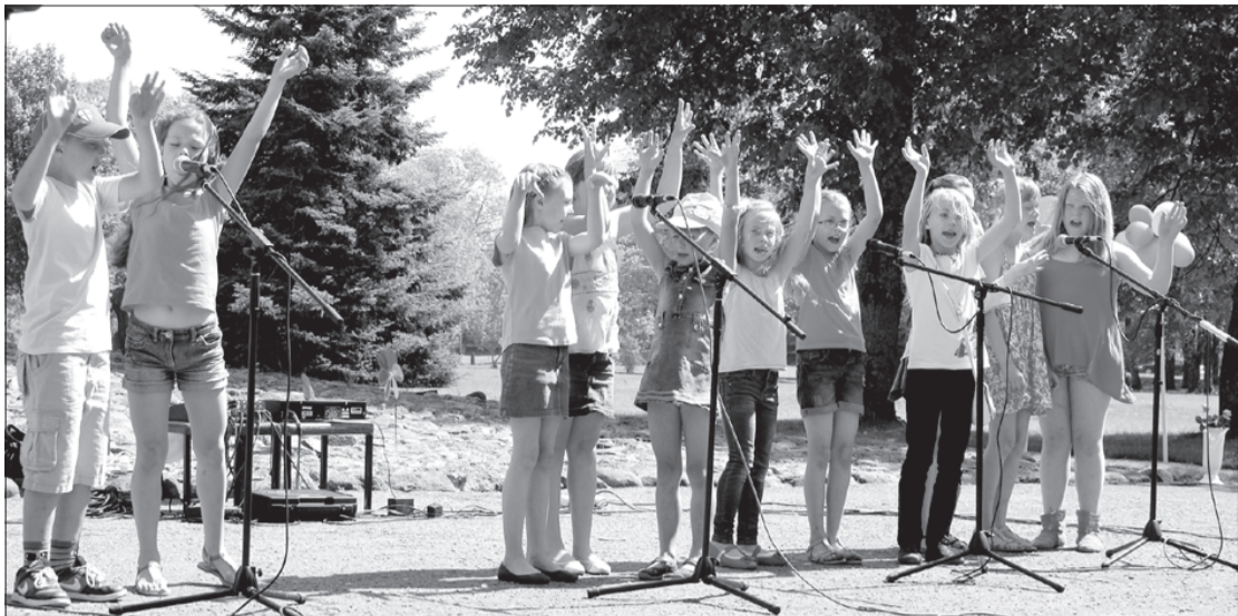
Uzstājas jaunie piltenieki.