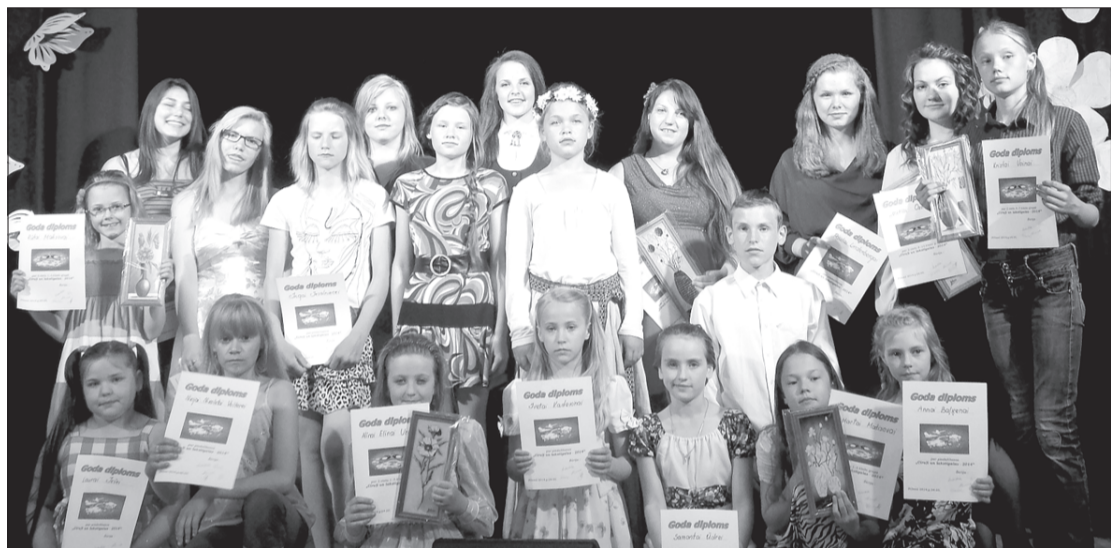
Vokālistu konkursa dalībnieki.