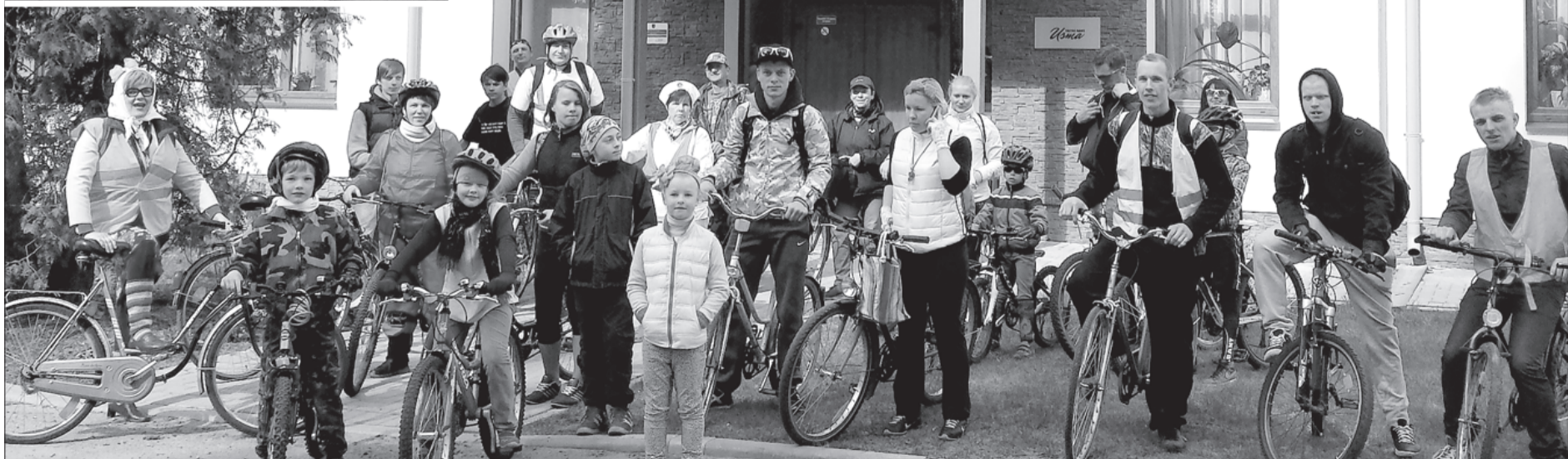
Velosezonas atklāšanas dalībnieki pie tautas nama "Usma".