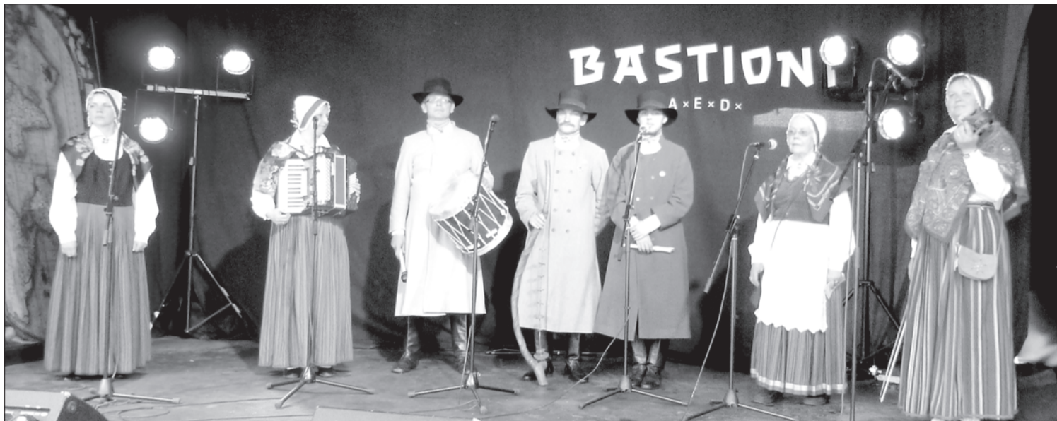
"Kāndlas" dziedātāji uzstājas Tallinā.

Šie svētki ilgst vairāk nekā nedēļu, un katrai no dienām ir sava tematika: Veselības diena, Muzeju diena, Teātra diena, Tradicionālās kultūras diena, Mūzikas diena, Seno laiku un Bērnu diena. Svētku bagātīgajā programmā ir iekļauti koncerti, performances, sporta