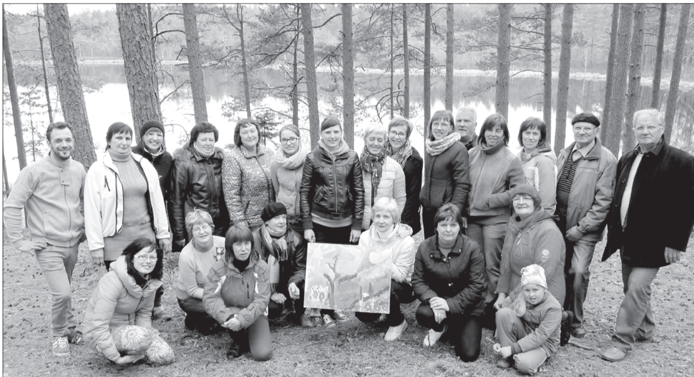
Visi atpūtas pasākuma dalībnieki.