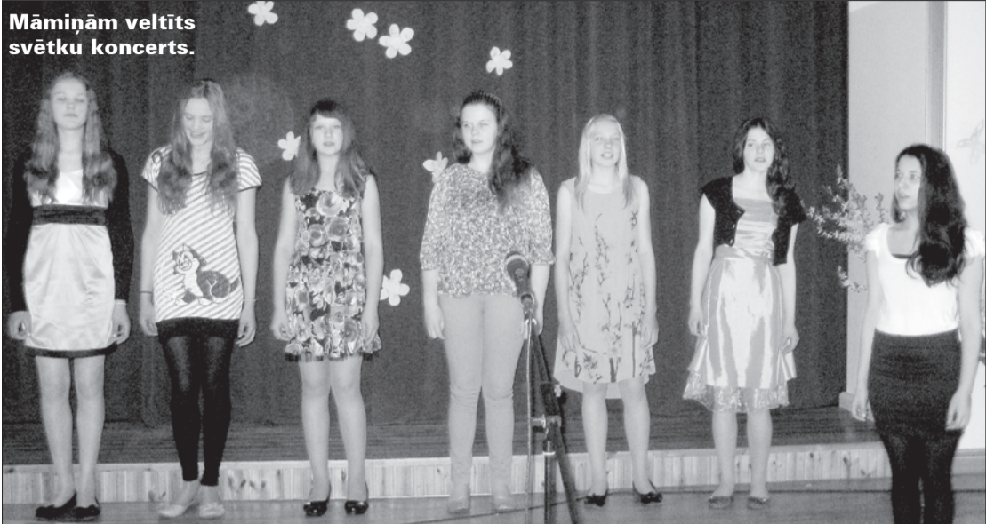
Māmiņām veltīts svētku koncerts.