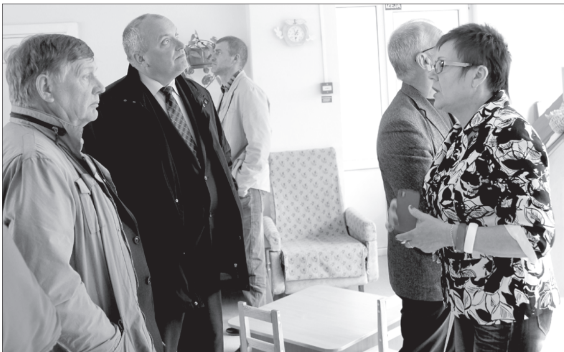
Deputāti novērtē, kas paveikts "Lācītī".