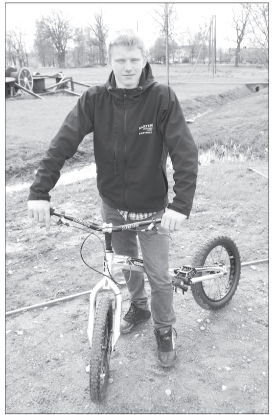
"Kartera" braucējiem tagad jauni velosipēdi.