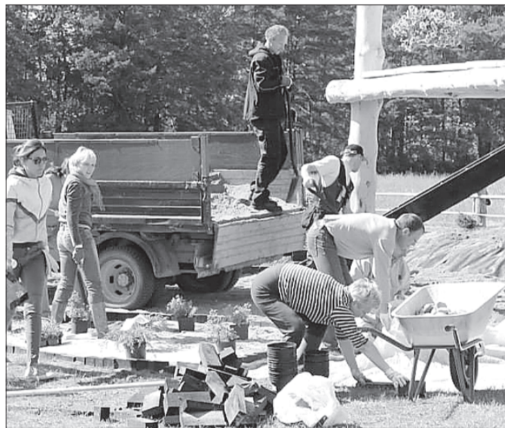
Tūrisma sezonas atklāšanas pasākumā paveikts daudz.

No 30. maija līdz 1. jūnijam jau 12. gadu notika Jūrkalnes vasaras sezonas atklāšana un talka.