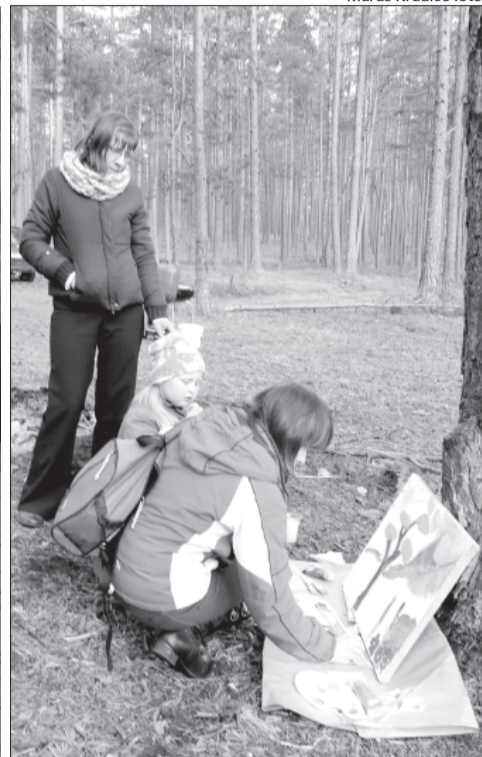
Glezšanas tapšanas mirklis.