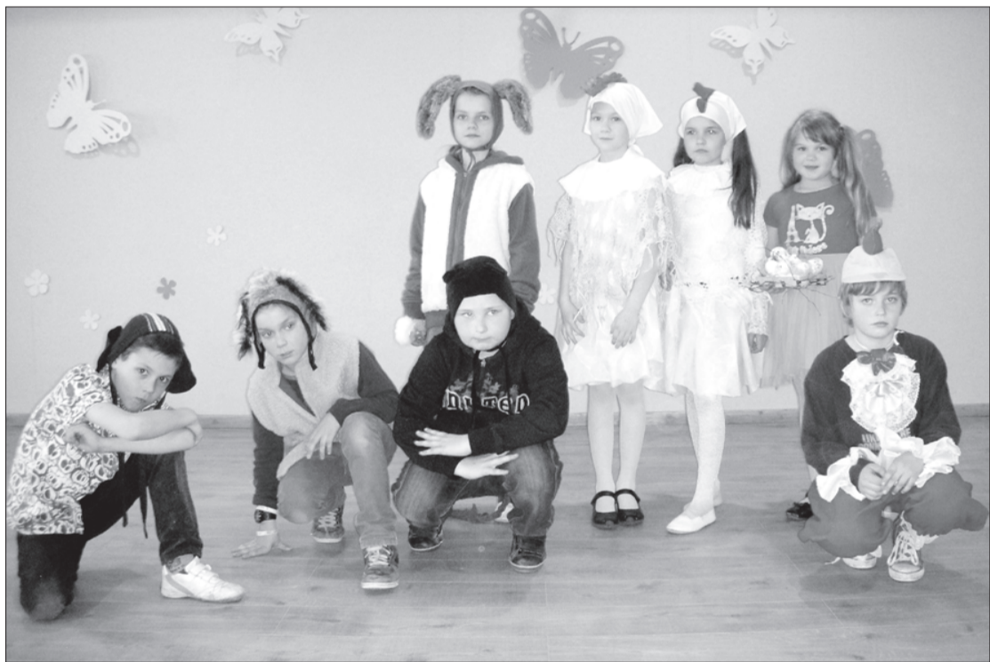
Pašpārvaldes rīkotās "Popielas" dalībnieki.