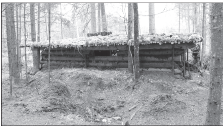
Zemessardzes 46. kājniņu bataljona karavīru, zemessargu un Valsts meža dienesta darbinieku atjaunotais partizānu bunkurs.

Ar patiesu cieņu novērtēju visu sabiedrisko organizāciju un atsevišķu privātpersonu veikumu šīs piemiņas vietas izveidošanā un sakopšanā, šogad vēl veicot lielu darbu – atklājot partizānu bunkuru, kur varējām skatīt informāciju par notikumiem šajā apvidū pēc kara. Brāļu kapi ir nezinātajam grūti atrodamā vietā, bet tie izstaro īpašu auru. Ventspils novada