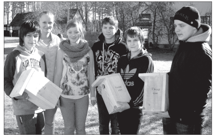
7. klases zēni ar izgatavotajiem putnu būriņiem.

13. martā katras klases komanda iepazīstināja pārējos ar vienu putnu. Ar viktorīnas palīdzību visi skolēni tika iesaistīti pasākumā, jo no klausītājiem kļuva par dalībniekiem. Visbeidzot praktiskā no-