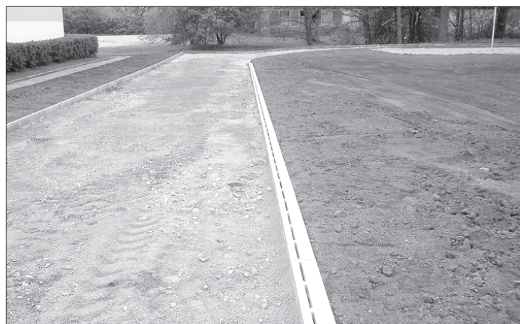
Puzē rekonstruē sporta laukumu.