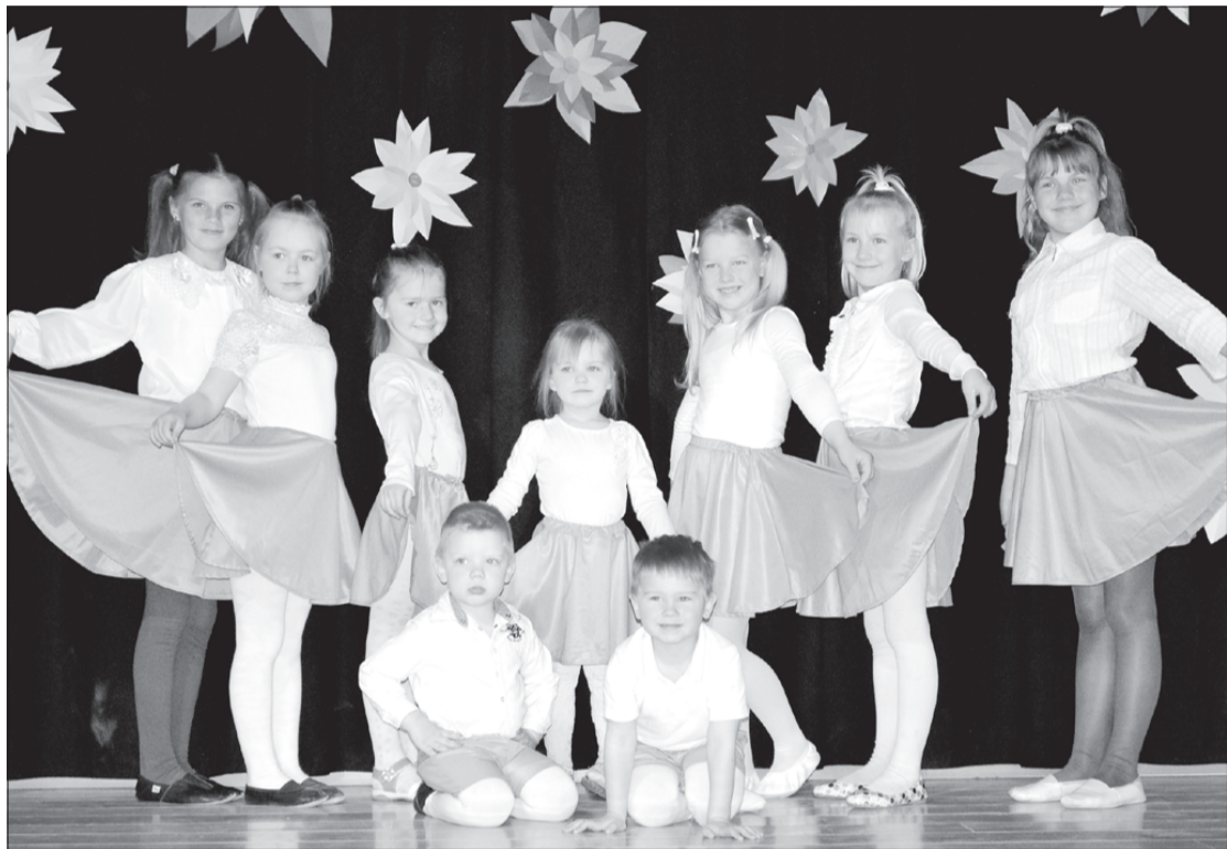
Māmiņdienas koncerta dalībnieces.

Saulīte spīdēja ne tikai laukā, bet arī katra bērna sirsniņā un acīs, jo piedalīties Māmiņdienas koncertā un dāvināt māmiņām prieku ir īpaši nozīmīgs mirklis ikvienam. Bērni bija krietni strādājuši, lai šajā īpašajā dienā varētu ar savu sirds siltumu sveikt ikkatru omīti un māmiņu.