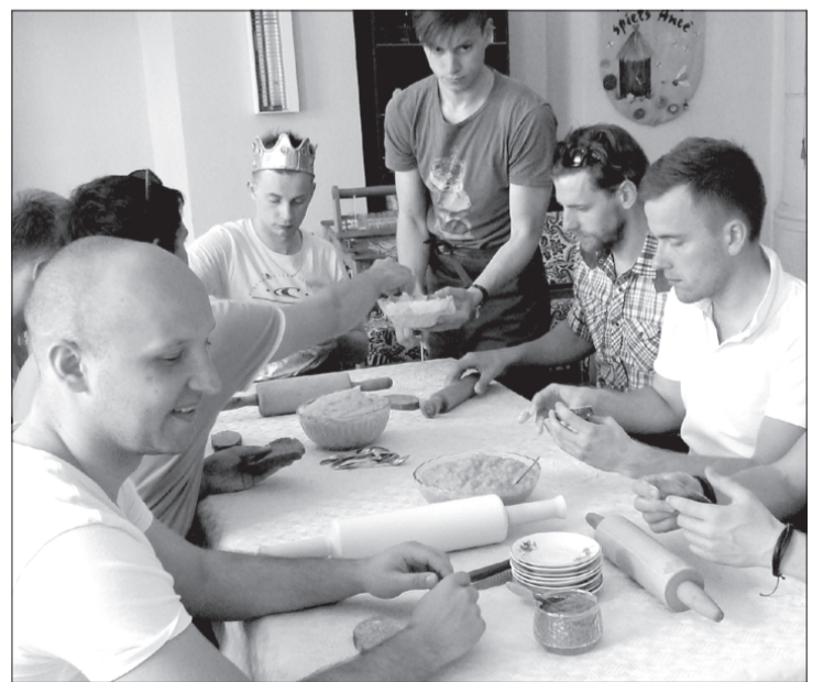
Vecpuišu ballītes dalībnieki mājās cept sklandraušus.

Arī 24. maijā draugu kompānija, kas apmeklēja Ances muižu, ar lielu aizrautību piedalījās gan sklandraušu cepšanā, gan citās aktivitātēs, ko piedāvājām. Kompānija šoreiz tiešām bija savdabīga un oriģināla,