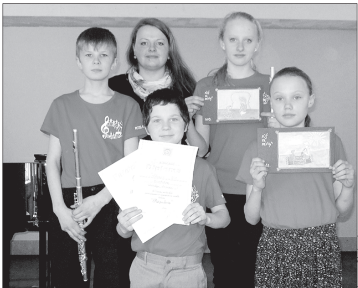
Antras Šķēles foto