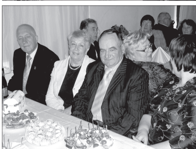
Kopā ar bijušajiem darbabiedriem.