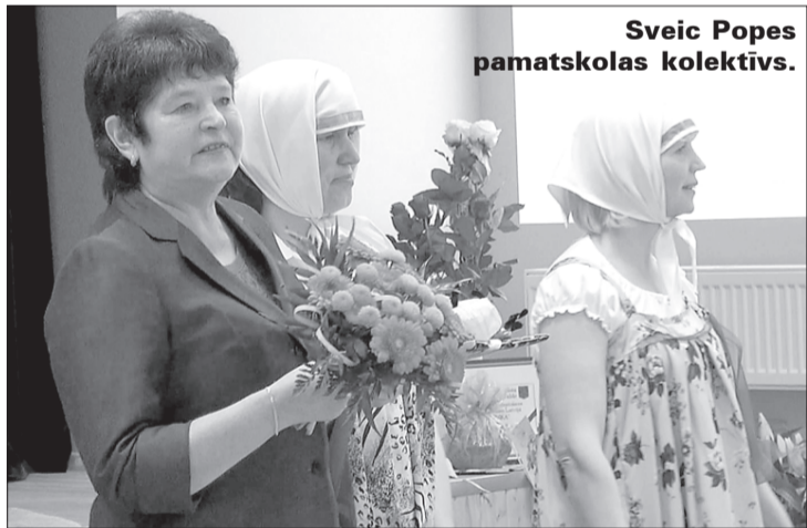
Sveic Popes pamatskolas kolektīvs.

Šodien ar prieku varam svinēt svētkus – noslēdzies neliels, tomēr mums pašām pietiekoši garš posms "Pūnikas" darba ceļā. Skatoties uz padarīto un sasniegto 10 gadu ilgmā, ir tāda laba gandarījuma sajūta – esam ļoti strādājušas. Protam sevi parādīt un citos klausīties. Caur tautas dziesmu esam kļuvušas gan sirdsgudrākas, gan vērigākas. Ar draugu pulks kļuvis lielāks. Un pēc katriem lieliem svētkiem aizvien ilgāks stiepjas laika periods, kurā esi lidojumā – vienkārši dvēsele dzied un pasaule šķiet krāšņāka un skanīgāka. Bet – jo vairāk tiek novērtēts, jo atbildības nasta smagāka!