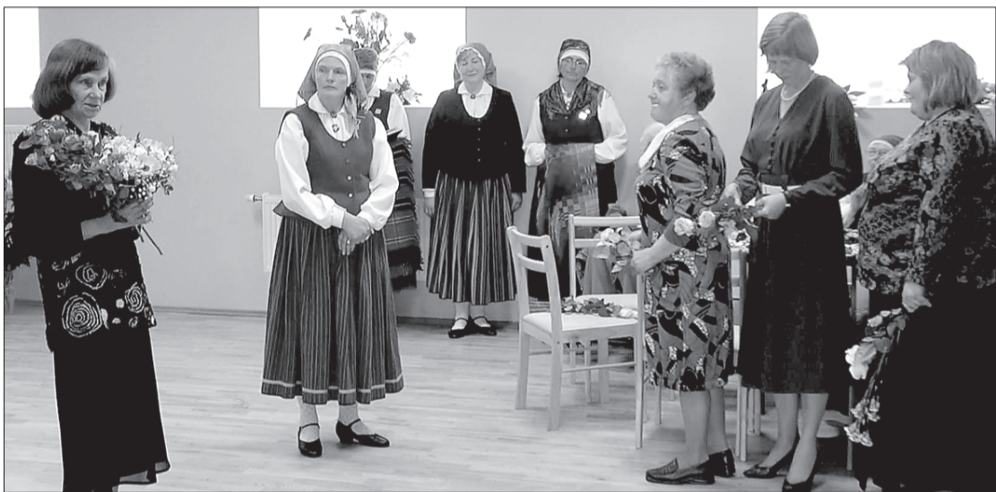
Sveic dāmu klubiņš "Puceņogas".

"Ceļš, kurš aizsākās 2002. gada 16. oktobrī – "Pūnikas" 1. mēģinājumā. Ceļš cauri tautas dziesmām, skatēm, festivāliem "Baltica", Dziesmu svētkiem, sadziedāšanās priekam dažādos pasākumos un saietos, cauri Metenīem, Lielai dienai, Ziemassvētkiem, Ušiņiem un Mārtiņiem, Jāņu ielīgošanai gan tepat Popē, gan Jūrkalnes Ugunsplavā ar maģisko uguns rituālu. Ceļš cauri sniegiem un puteņiem, cauri putekļainiem ceļiem un pielijušām ielām, krāšņi ziedošiem rudzupuķu un margrietīņu vainagiem, cauri Rīgai krāsainā Ziemeļkurzemes tērpā, cauri smaržīgu ziedu mākoņos slīgstošām Popes liepu alejām. Ceļš uz Dainu kalnu – Siguldas pievilcības un dzīvības pilns. Cauri Vecpiebalgas ūdensrožu burvībai. Ceļš cauri miglai uz sauli – darba un maizes ceļš. Bez darba nekais notiek. Maize kā darba svētība. Bez darba nav svētku un piepildītas laimes sajūtas.