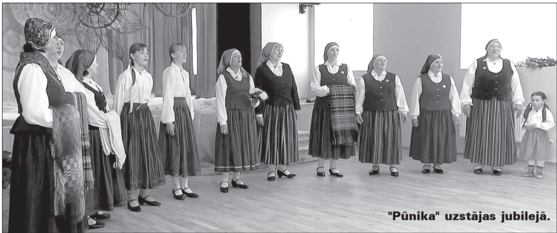
"Pūnika" uzstājas jubilejā.