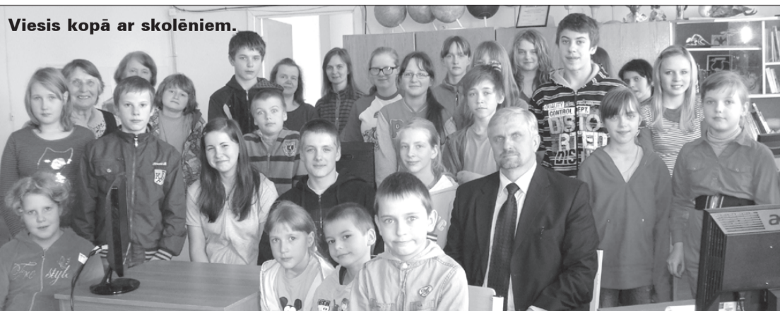
Viesis kopā ar skolēniem.