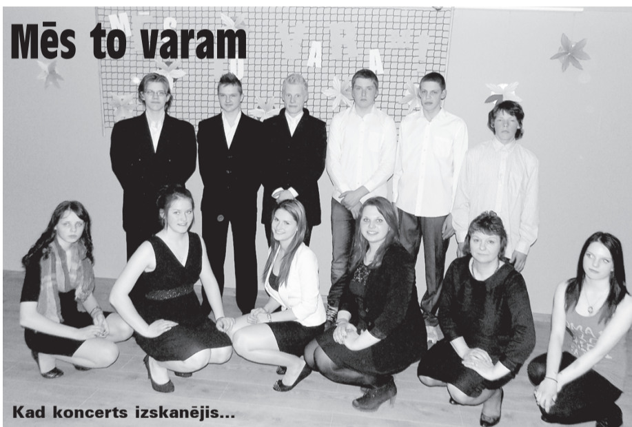
Kad koncerts izskanējis...