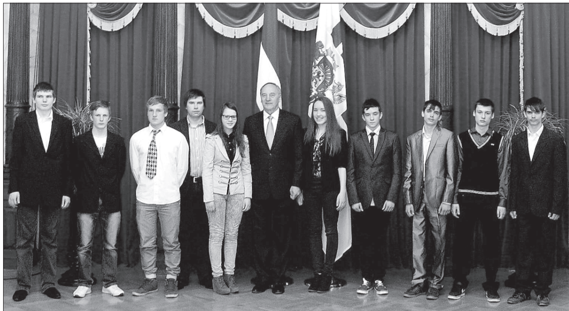
9. klases skolēni kopā ar prezidentu.

23. aprīlī Ventspils novada Tārgales pamatskolas devītklasnieki Rīgā svinēja uzvaru mūsdienu zināšanu pārbaudes konkursā "Kas notiek?".