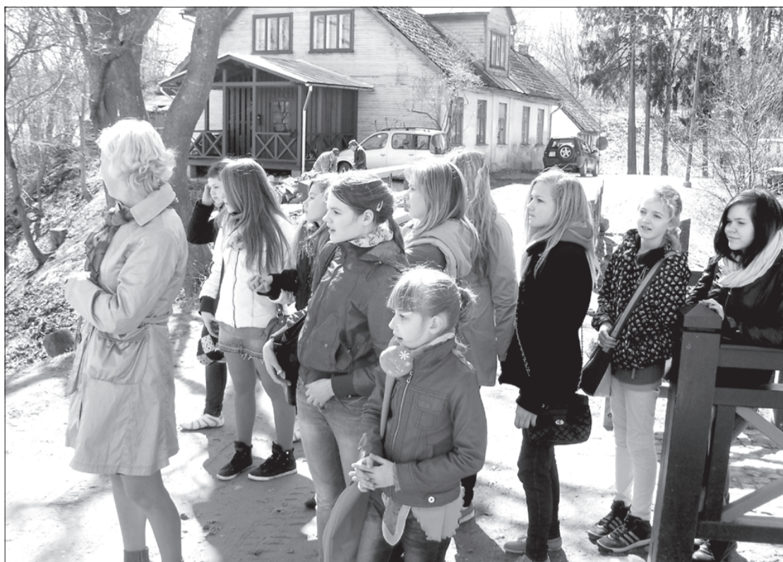
Ekskursija pa Kuldīgu.