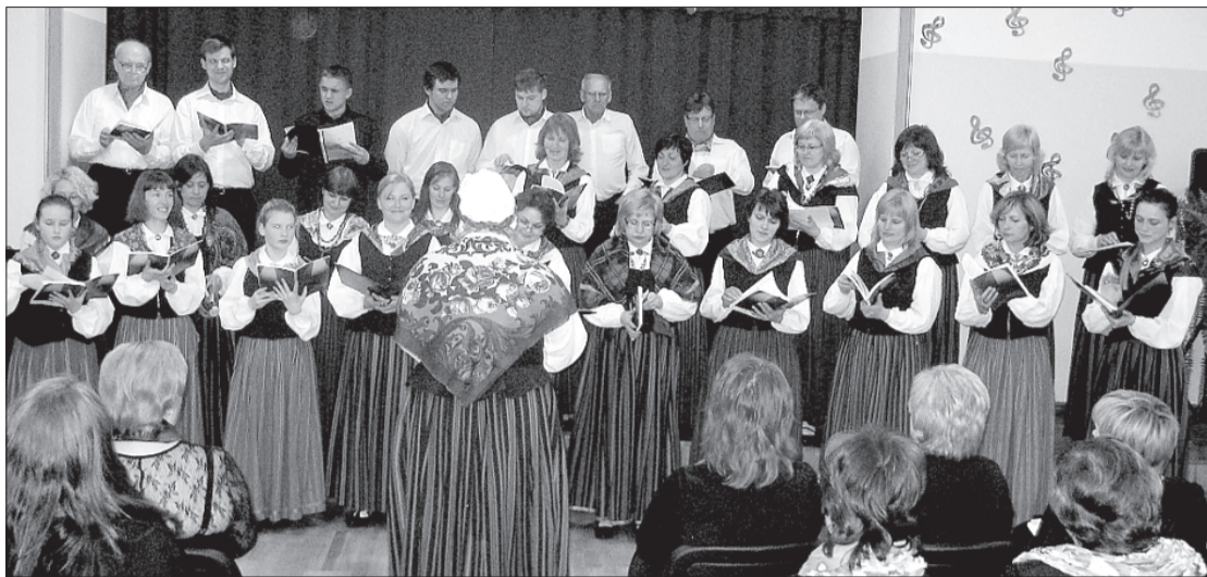
Jauktais koris "Līvzeme".