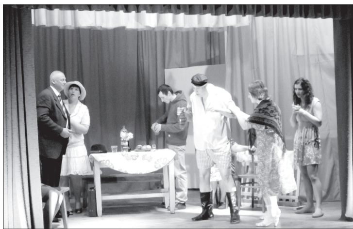
Skats no izrādes "Visi radi kopā".