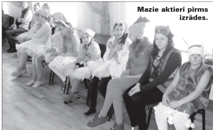
Mazie aktieri pirms izrādes.