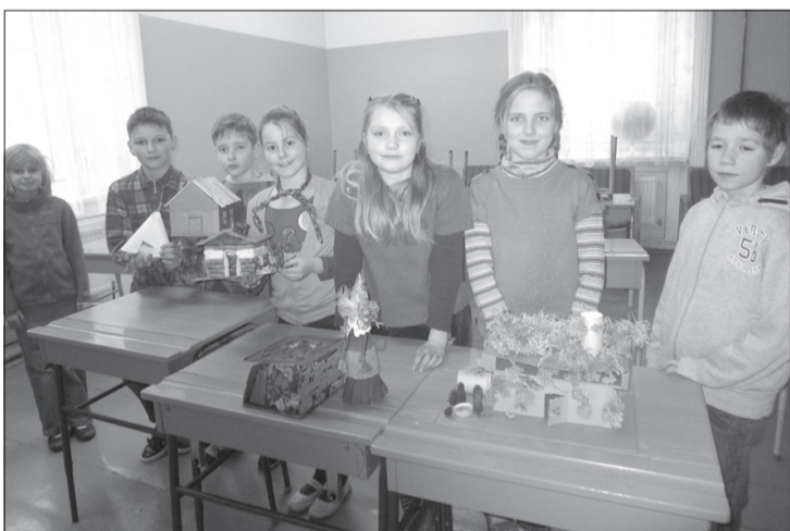
3.klases skolēni ar izveidotajām mājām.