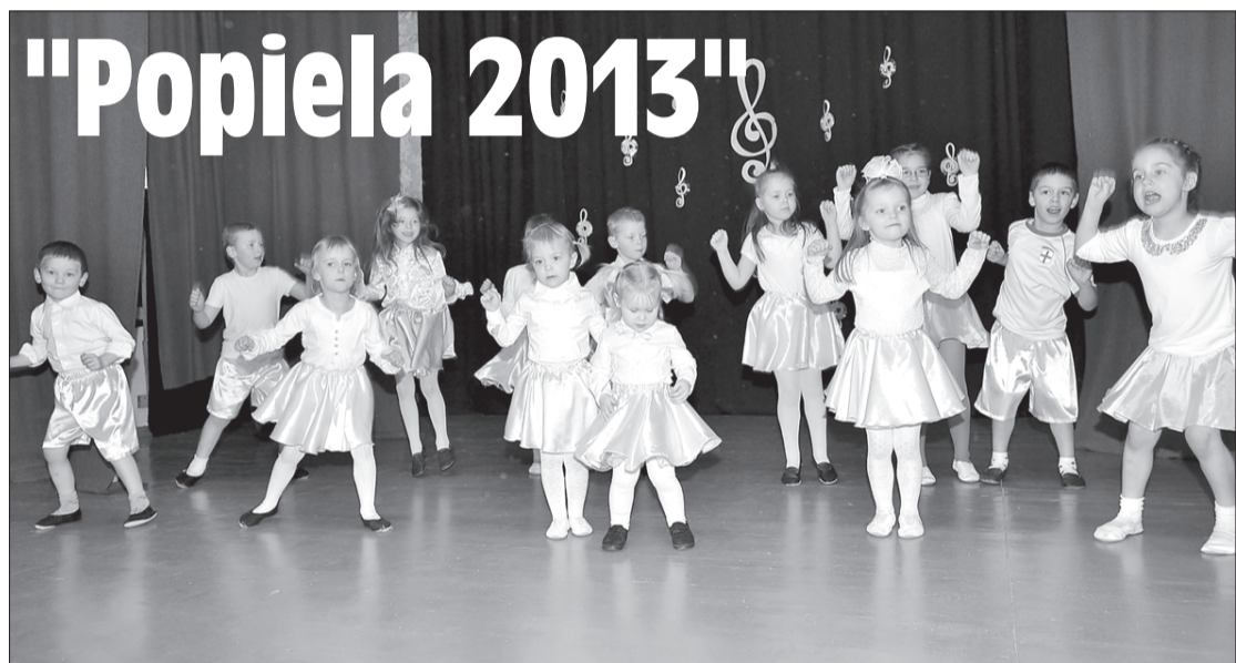
Dejo mazās ziedlapiņas.