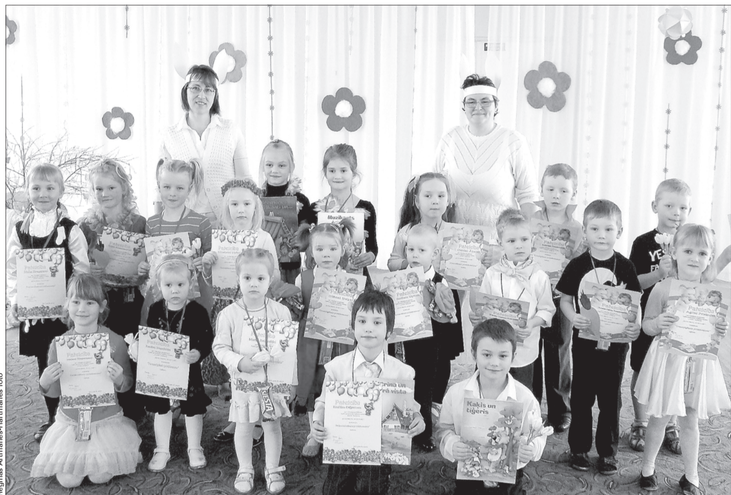
"Lācīša" talantīgākie bērni.