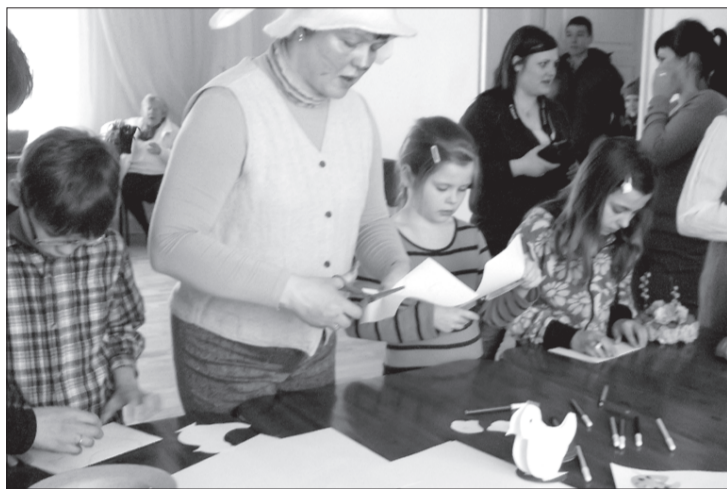
Zaķa Pēča radošā darbnīca.