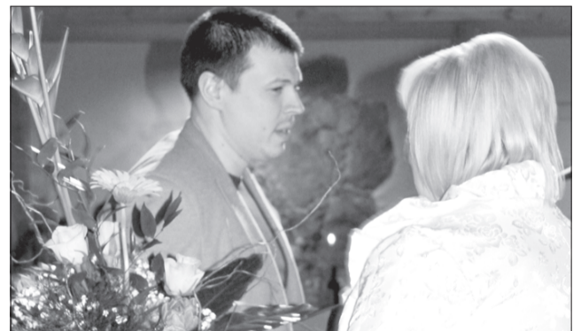
SIA "Zibu Ventspils".