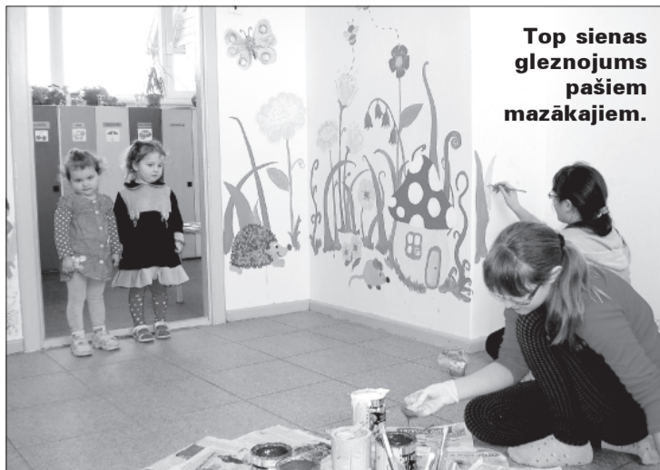
Top sienas gleznojums pašiem mazākajiem.