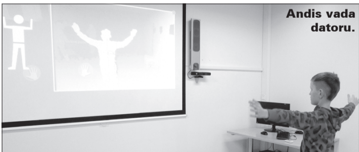
Andis vada datoru.