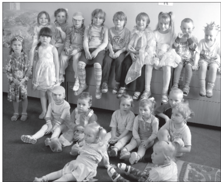
Pavasara svētki PII.

Saulīti un gaidīja Lieldienu zaķi. Zaķis šoreiz slēpās no bērniem, tomēr olu grozu gan bija atstājis.