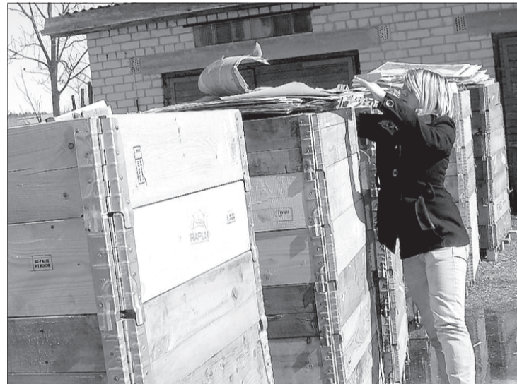
Šī makulatūra – Līgatnes papīrfabrikai.

Pa logu raugoties, tā īsti noticēt nevar, bet vasara tuvojas. Tas nozīmē arī to, ka skolās tuvojas remontdarbu sezona. Šogad pirmais rindā uz uzprisināšanu ir skolas vecais malkas šķūnis. Tas savus pienākumus veic jau kopš 1962.gada, un laika zobts to nepavisam nav žēlojis. Šķūni glabājas malka skolas katlumājai, no kuras tiek