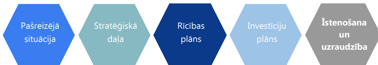
ATTĒLS 1. ATTĪSTĪBAS PROGRAMMAS SASTĀVDAĻAS

Attīstības programma sastāv no vairākām daļām (Attēls 1). Ventspils novada attīstības programmas 2020.–2026. gadam īstenošanas un plānošanas procesā būtiski ir izveidot un izpildīt tās uzraudzības sistēmu.